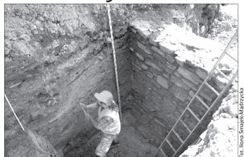
Pod schodami łączącymi ul. Śrutarską z ul. Przykopa odkryto fragmenty murów miejskich.

Prace w tym rejonie zostały wstrzymane i archeolodzy przystąpili do oczyszczenia i dokumentowania odkrytych murów. Prace budowlane ruszyły już jednak dalej i obecnie są na ukończeniu. (ox.pl)