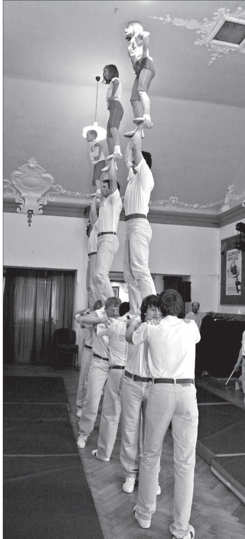
Wędryńscy Gimnastyści podczas występu w „Czytelni”.

Gdy było trzeba zbudować dla siebie dom, zbudowali sobie „Czytelnię”. Dla jej obrony nauczyli się już przed wojną sięgać po pomoc do Polski, a dla ratowania jej zbiorów nie wahali się ryzykować i narażać życia podczas drugiej wojny światowej. A było wiadomo – kto dotknął „Czytelni”, dla tego był przeznaczony obóz koncentracyjny, więzienie, wywózki. Dotknięci „Czytelnią” leżą też w Katyniu, Miednoje i Charkowie.