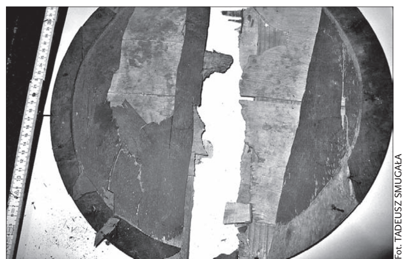
Nieznanemu darczyńcy przekazał DPŻiW odłamki samolotu, w którym zginęli Żwirko i Wigura.

Opiekunowie Żwirki i Wigury są przekonani, że chodzi o oryginalny fragment historycznego samolotu. Zdjęcie odłamków wystali bowiem do Muzeum Sił Powietrznych w Dęblinie, które skonsultowało je dodatkowo z ekspertem z Warszawy. Ten potwierdził, że są to odłamki z RWD-6, wstępnie ustalając, że może chodzić o wręgę za silnikiem. Nowy nabytek Domu Polskiego zostanie udostępniony odwiedzającym. (dc)