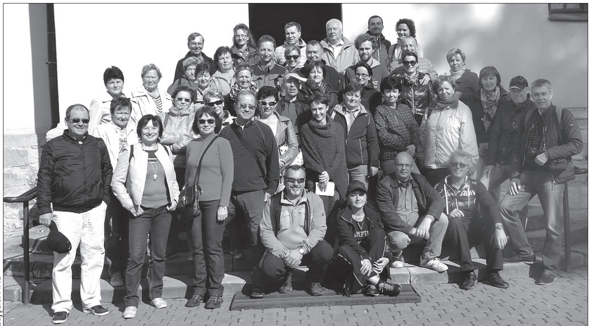
Pamiątkowe zdjęcie uczestników wycieczki do Sandomierza.

cegly, każdy z inną elewacją – nie ma dwóch identycznych. Pralnia, suszarnia i magiel do wspólnego użytku, sklepy, szkoła, dom noclegowy dla niezonatych górników, wszystko po to, aby większość ważnych spraw załatwić na miejscu. Bloki ustawione do czworoboku posiadają dziedzińce, kiedyś z chlewikami i piecami do