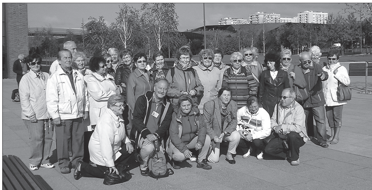
Tym razem emerytowani nauczyciele wybrali się na wycieczkę do Katowic.