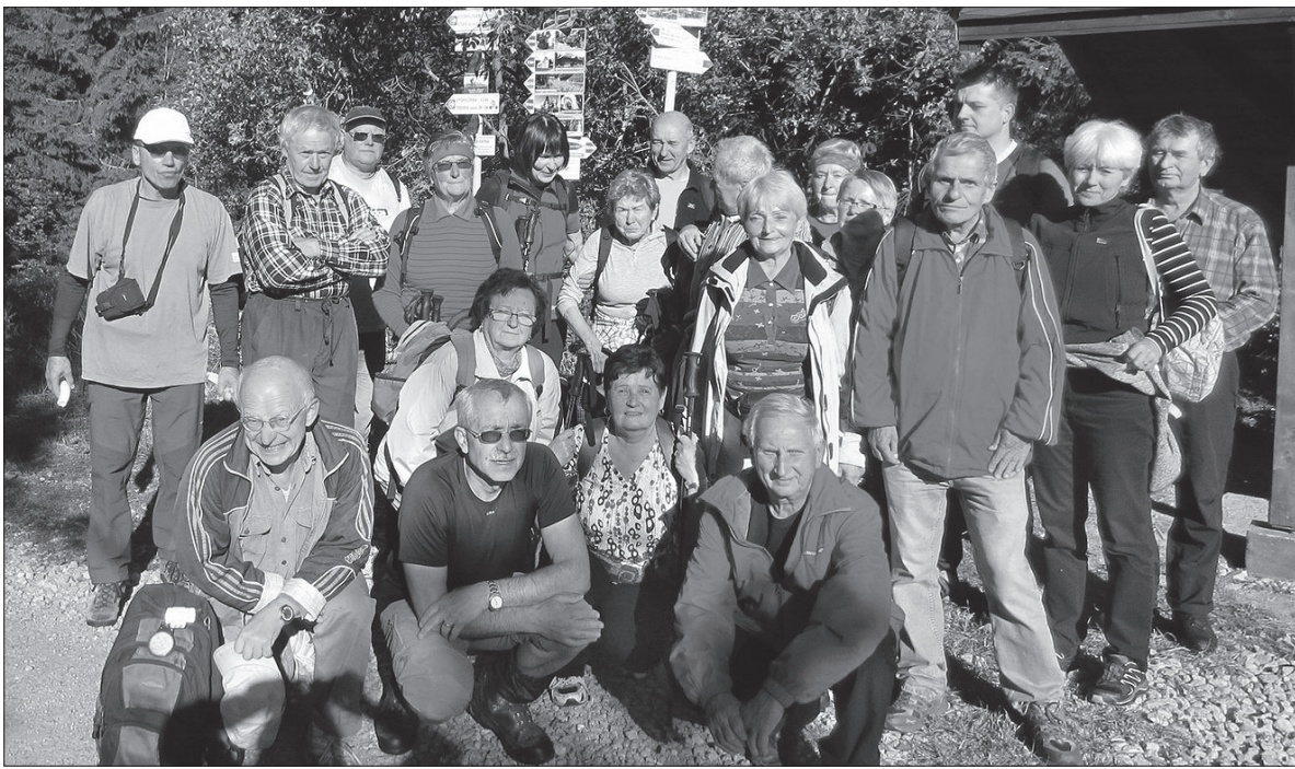
Uczestnicy wyprawy na przełęcz Demänova.

Zwiedzanie rozpoczynamy od niezwykłego pomnika. Wchodzimy między dwa równoległe mury i czytamy o dokonaniach Ślązaka Henryka Sławika i Węgra Józefa Antalla. Polak i Węgier, narażając życie, uratowali ok. 5 tysięcy polskich Żydów. Na płycie nie widać twarzy bohaterów, pracowali przecież w ukryciu przed okupantem. Wystarczy tylko stanąć z boku i spojrzeć pod pewnym kątem, aby obu bohaterów zobaczyć. Na dawnym placu drzewnym stoi okazały budynek Narodowej Orkiestry Symfonicznej Polskiego Radia. Siedziba muzyków posiada salę koncertową dla niemal dwutyśięcnej publiczności, sale prób, salę konferencyjną, bibliotekę, a w podziemiach parking. Gmach z cegły brunatno-czerwonej nawiązuje do miejscowego sposobu budowania.