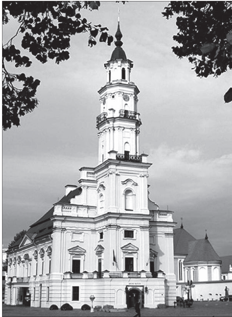
Dzisiaj Polacy w Kownie stanowią 0,6 proc. mieszkańców.