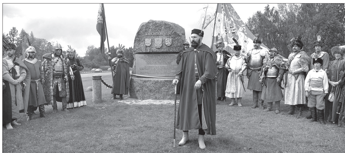
Bitwa pod Kircholmem miała miejsce w 1605 roku.