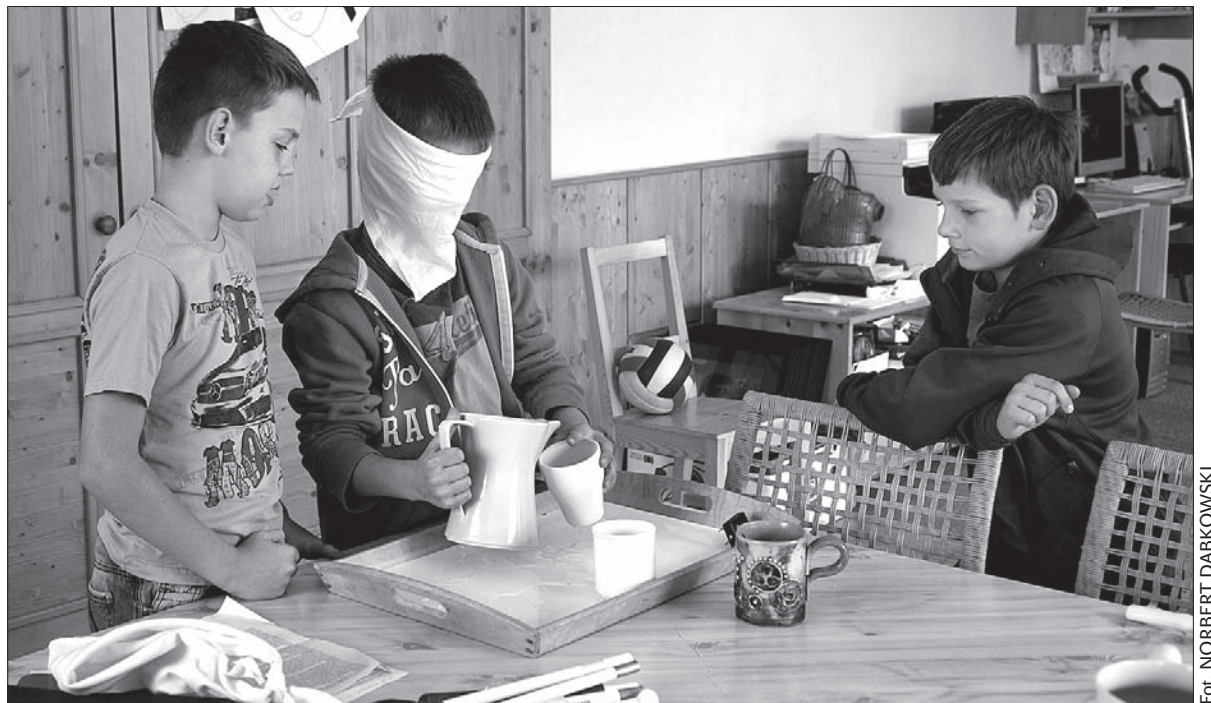
Dzieci miały okazję przekonać się, jak to jest być upośledzonym.

Inauguracja nowego Centrum Pomocy Świętego Rafała zbiegła się z Tygodniem Usług Społecznych, odbywającym się w różnych miastach, także w Jabłonkowie. W trakcie