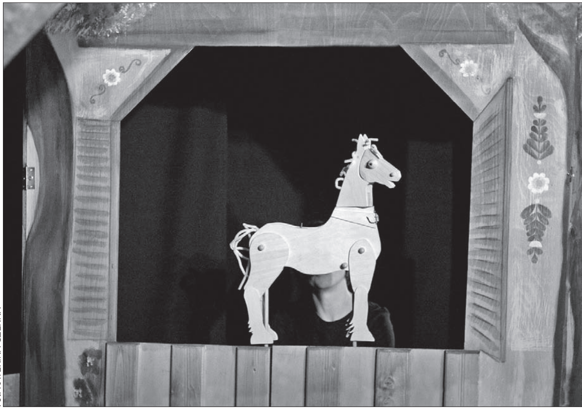
Fot. KATEŘINA CZERNA

W Roku Gustawa Morcinka na scenie „Bajki”, w tzw. Białej Galerii Teatru Cieszyńskiego, ożyją postaci z jego podań i legend. Widzowie przeniosą się do podziemi, gdzie rządzi Pusteki, a Hawiryz Kubok codziennie zwozi klatkę z kanarkiem. Nie zabraknie również wiernego ko-