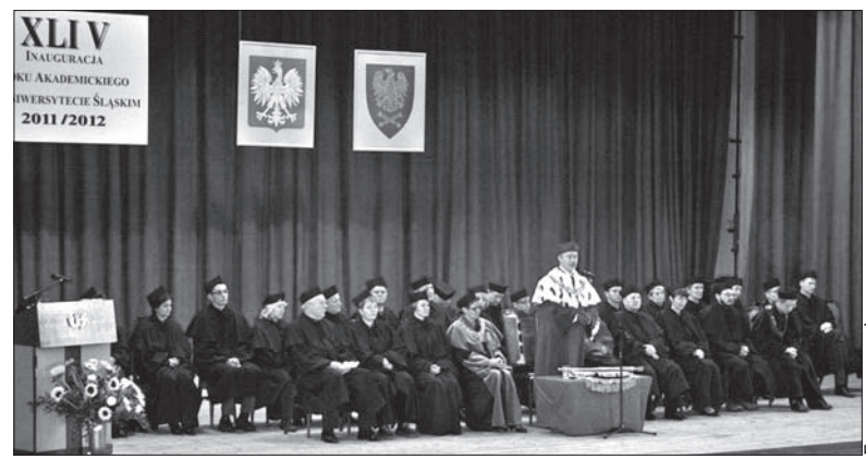
Uroczysta inauguracja roku akademickiego na wydziałach Uniwersytetu Śląskiego w Cieszynie.

ście zainaugurowała swój rok akademicki Wyższa Szkoła Biznesu z Da-