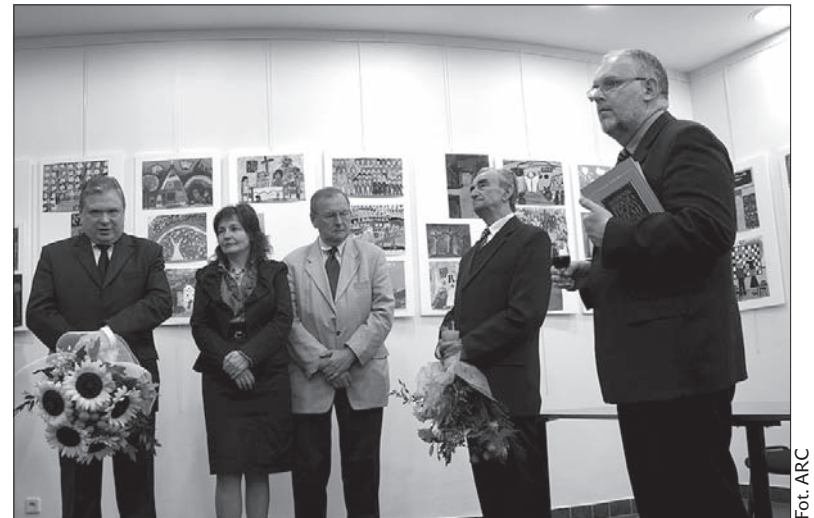
Z wernisazu wystawy w Książnicy Cieszyńskiej.