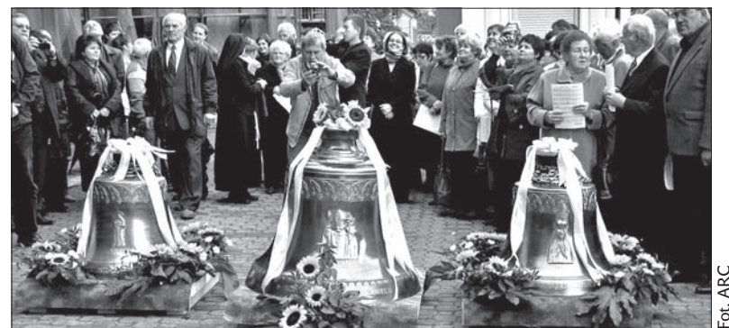
Trzy nowe jabłonkowskie dzwony. Środkowy nosi imię bł. Jana Pawła II.