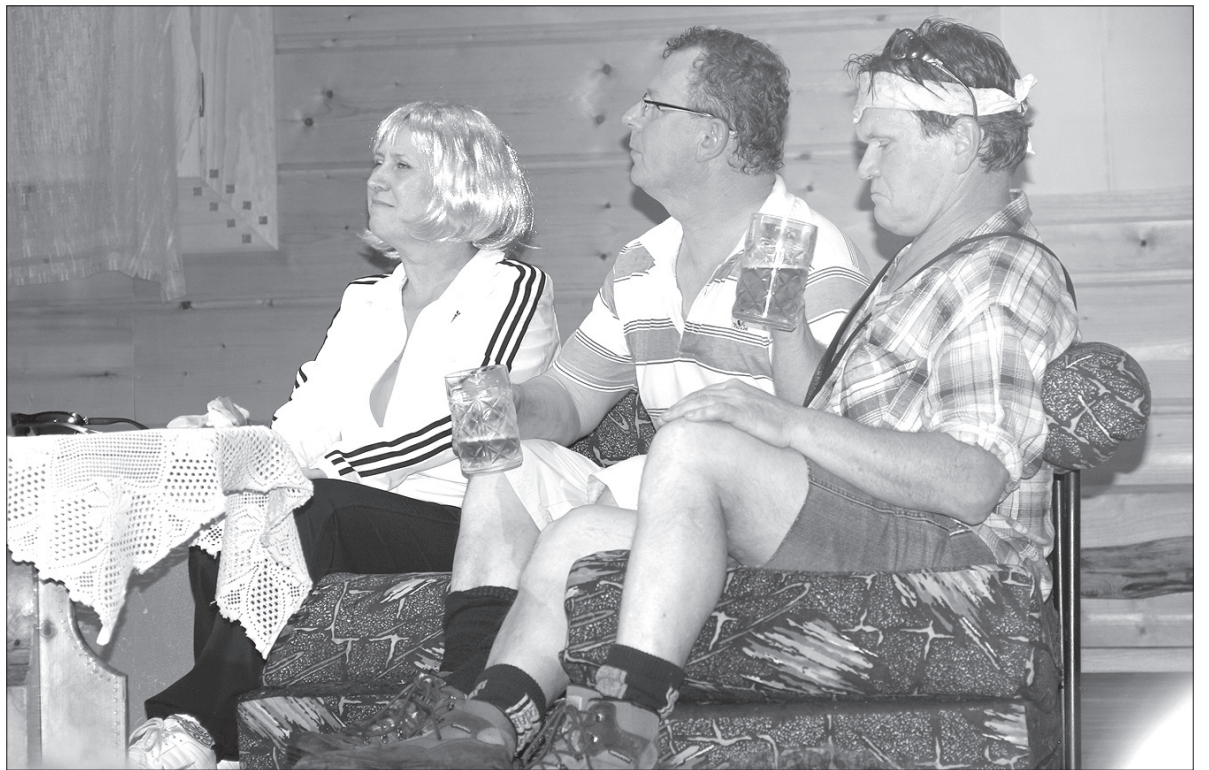
„Rocznica, czyli trzycet років zech nie widziol słónka”.

O tym, że wbrew pozorom w gwarze trudniej jest zagrać niż w