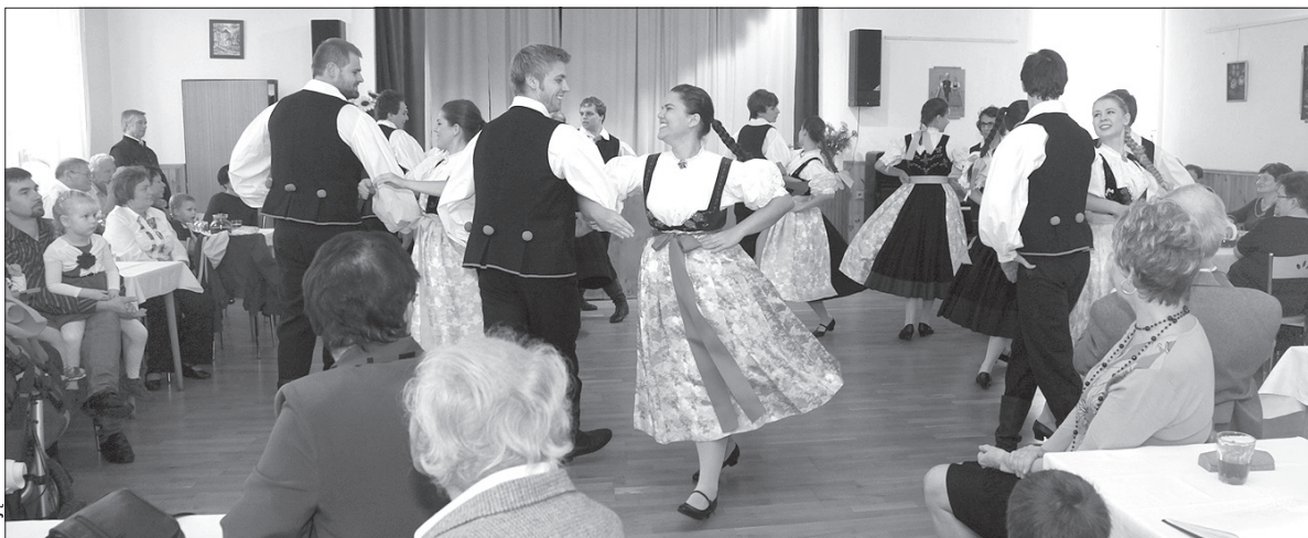
Zespół „Błędowice” podczas występu w sali Domu PZKO w Olbrachcicach.