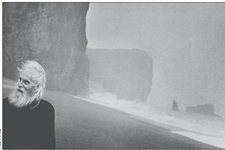
Jedna z prac Ragnara Axelssona.