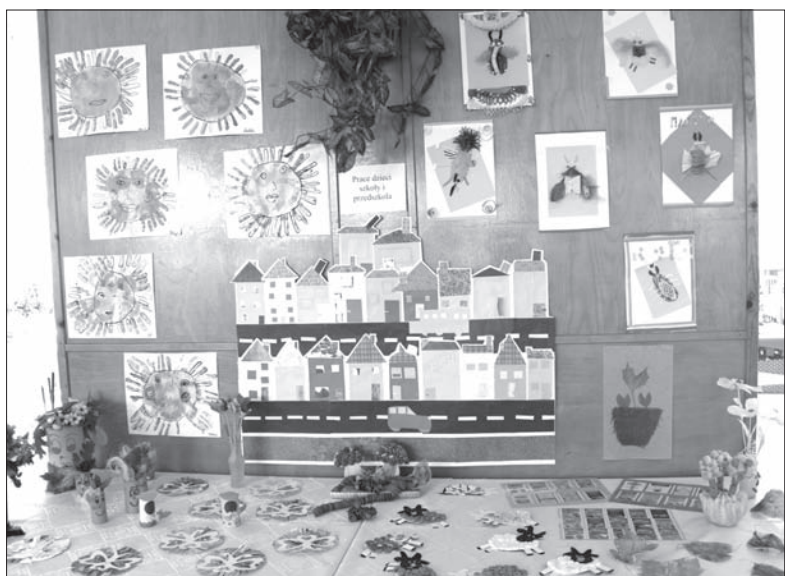
W Domu PZKO w Milikowie wystawiały również dzieci.