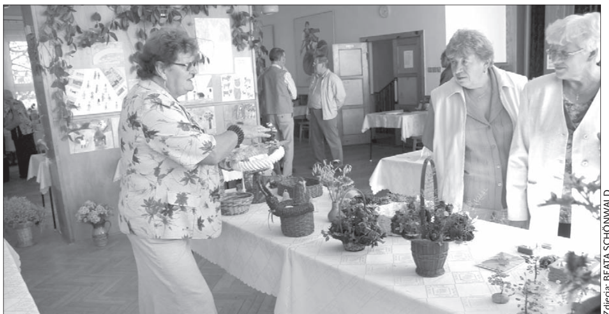
W niedzielne popołudnie wystawa w Milikowie-Centrum była oblegana przez odwiedzających.

Panie czerpią inspiracje z różnych kursów, uczą się od swoich koleżanek. Przykładem nowo poznanej techniki są choinkowe ozdoby – małe aniołki z koralików. Jak je wykonać, milikowianki nauczyły się od