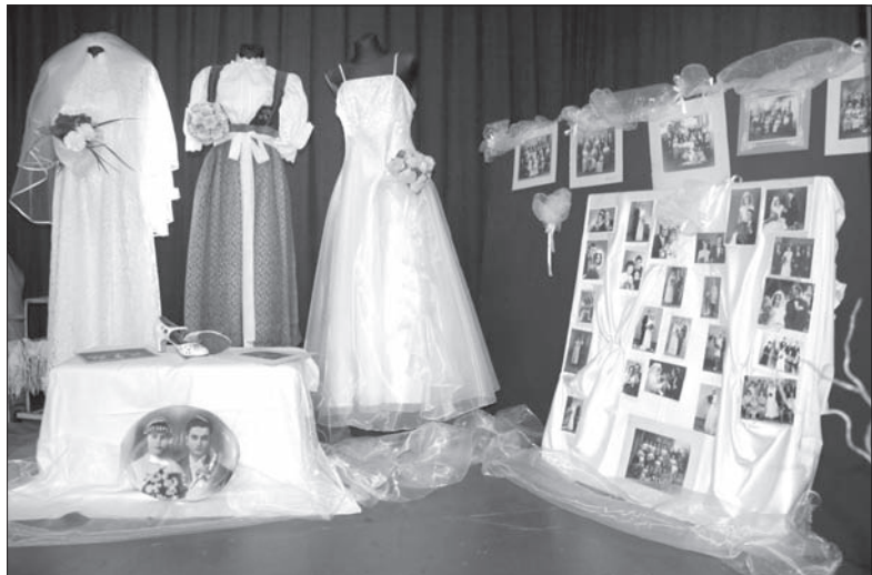
Na przykładzie zmieniającej się mody ślubnej można zobaczyć, jak zmieniał się świat.