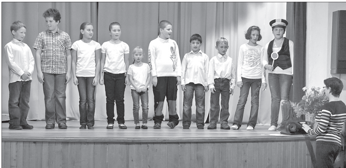
Na scenie uczniowie olbrachcickiej podstawówki.

W drugiej części imprezy panie z Klubu Kobiet częstowały przybyłych smacznymi strykanami w kilku wariantach. (sam)