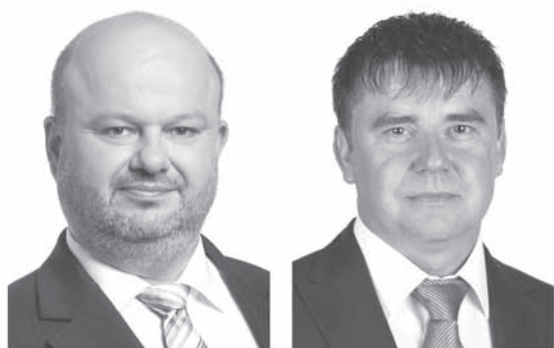
Ing. Martin Pecina, MBA wicepremier rządu, minister spraw wewnętrznych w dymisji

Każdy obywatel musi mieć pewność, że państwo postara się o jego bezpieczeństwo