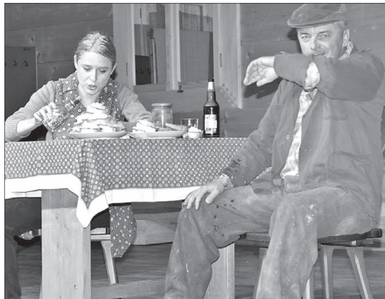
Scena z przedstawienia „Majster Babrok”.