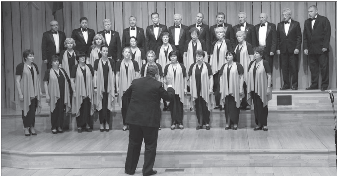
„Hutnik” podczas niedzielnego występu w sali Zespołu Państwowych Szkół Muzycznych w Bielsku-Białej.