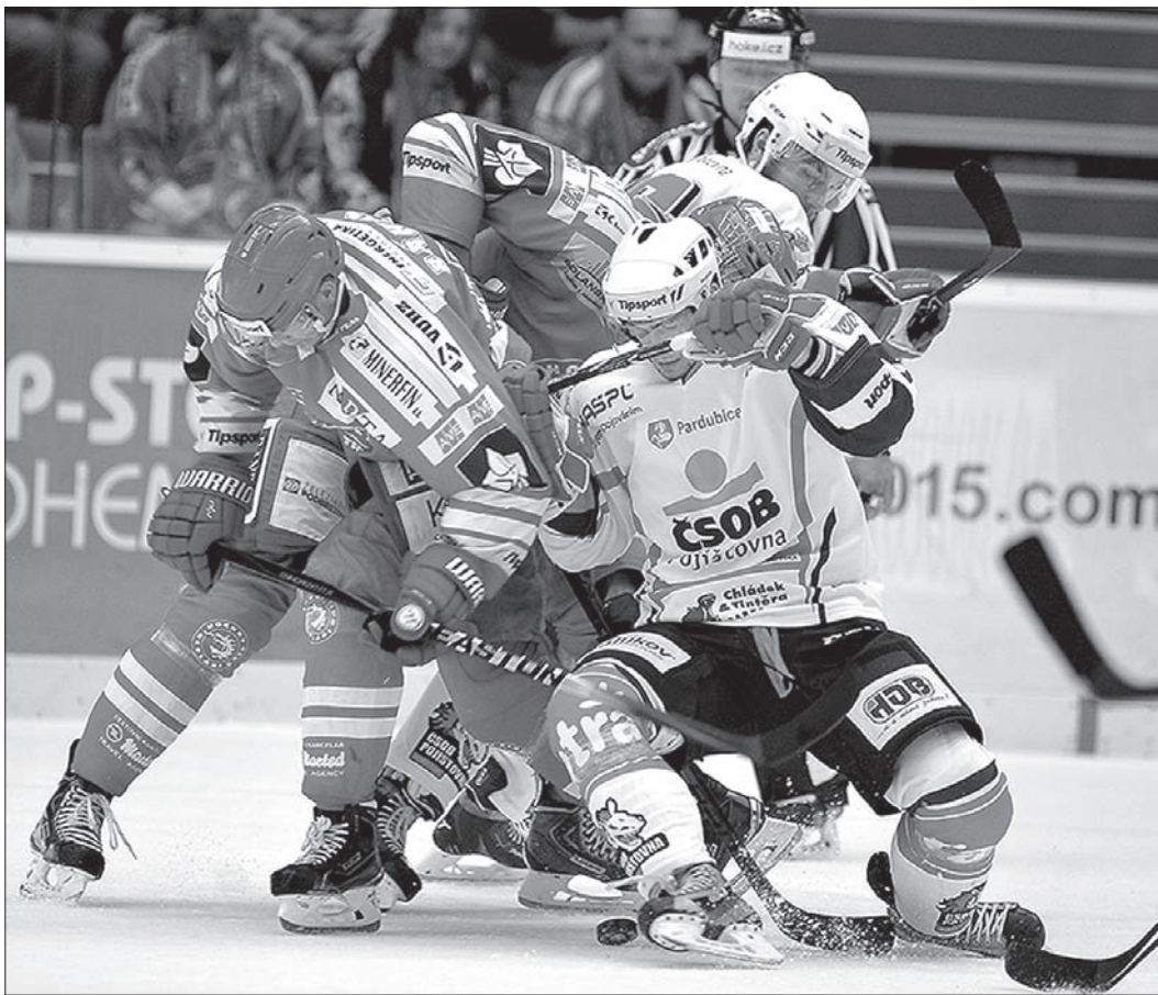
Właśnie tak hartuje się stal w Werk Arenie.