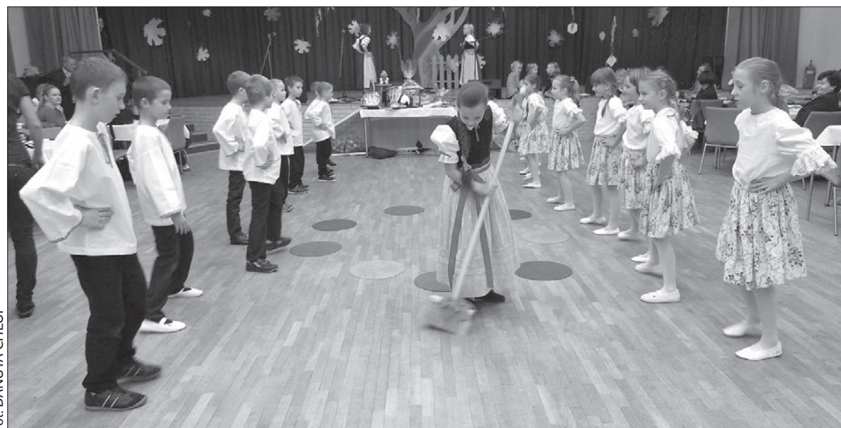
Uczniowie najpierw sami zatańczyli „mietlorza”, potem zaprosili do tańca rodziców.