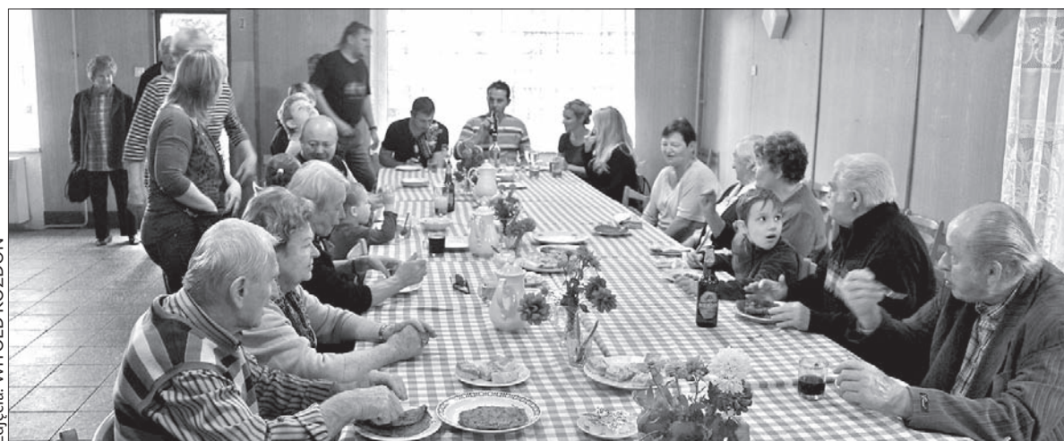
Sobotnia impreza była okazją do spotkania się i rozmowy w gronie znajomych.