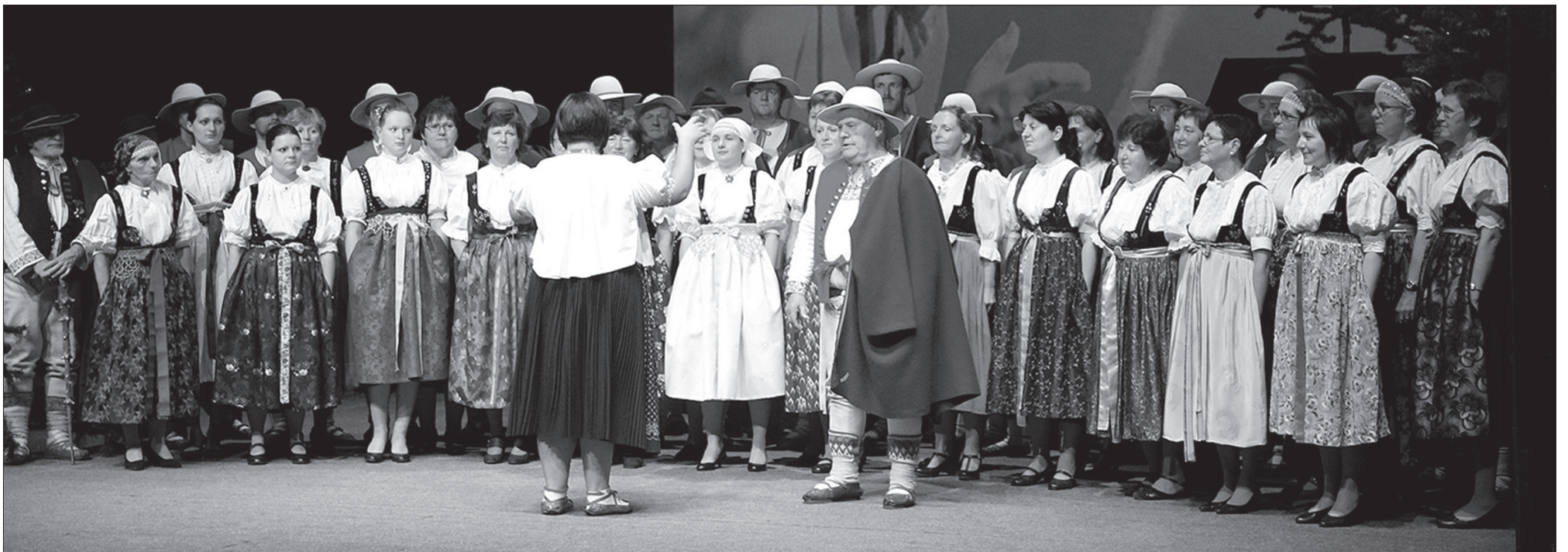
Polłączone chóry na scenie Teatru Cieszyńskiego.

– Spotkaliśmy się dziś, by przypomnieć sobie setną rocznicę urodzin Władysława Niedoby, Jury spod Grónia, człowieka, który stworzył Gorolski Święto, prowadził i kształtował zespół „Gorol”, ale także człowieka, który spełnił swój sen. Sen o stworzeniu, profesjonalnego, polskiego teatru narodowego na Zaolziu. Wspominamy więc aktora, reżysera, długoletniego kierownika artystycznego Sceny Polskiej – mówił Bogdan Kokotek, aktor Sceny Polskiej Teatru Cieszyńskiego, otwierając sobotni koncert pt „Starzikowe urodziny, czyli 100 lat Władysława Niedoby – Jury spod Grónia”.