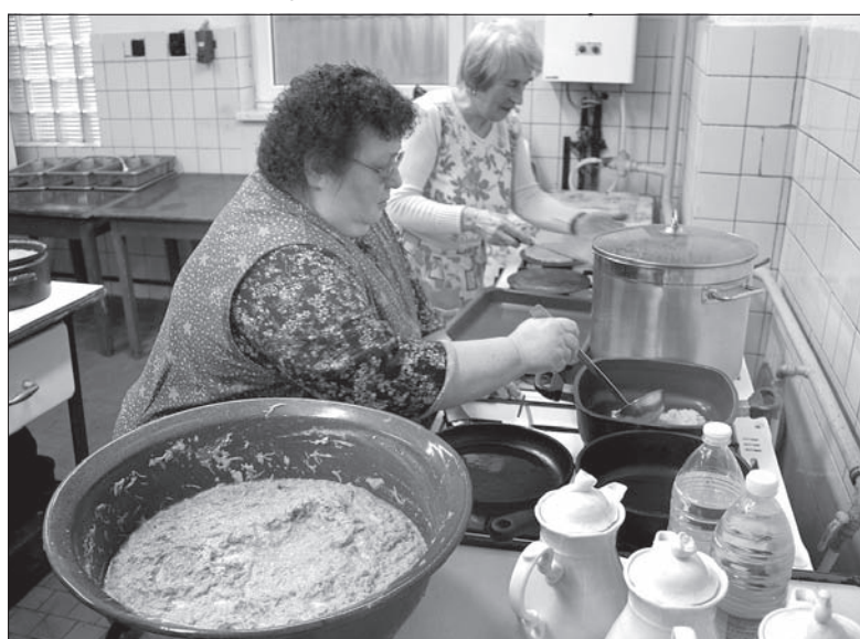
Panie z mosteckiego Koła Kobiet przygotowały placki z 20 kg ziemniaków.