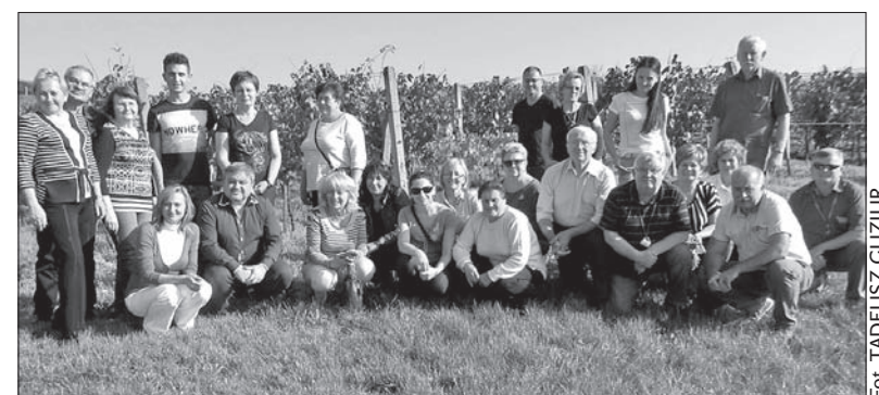
W takich okolicznościach przyrody pewnie chcieliby się znaleźć wielu z nas.