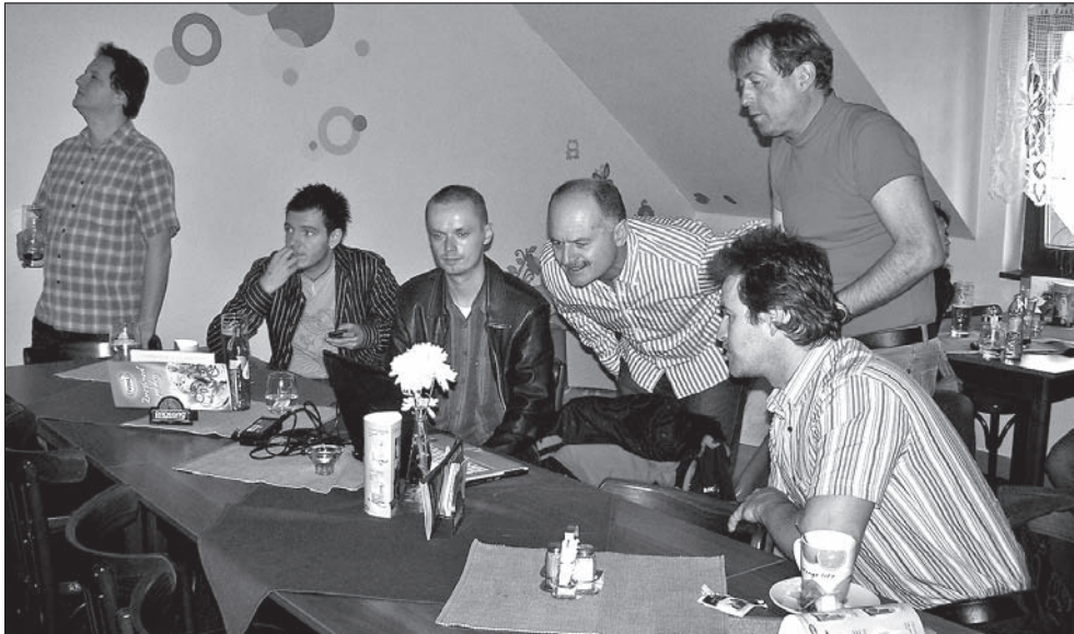
Na razie idzie dobrze!...

W sztabie rozbrzmiewają oklaski. Kierownictwo VV dziękuje swemu kandydatowi, który jako jedyny w całym kraju doznał do drugiej