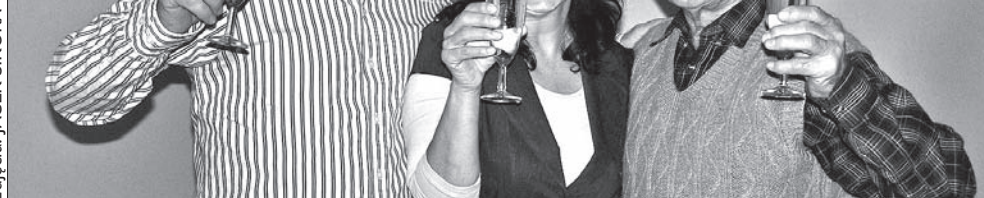
Senator Petr Gawlas z żoną Ewą i ojcem Alojzym.