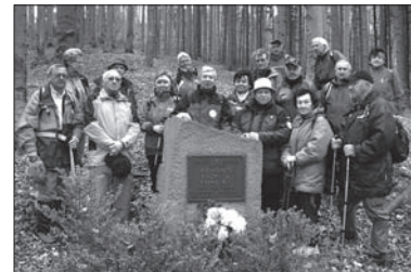
„Beskidowcy” pod pomnikiem.

W ubiegłą sobotę turyści PTTS „Beskid Śląski” wyruszyli na wycieczkę na Kozubową. Trasa prowadziła z Boconowic przez Małą Kikulę. Pod wierzchołkiem Małej Kikuli „beskidowcy” zatrzymali się przy pomniku przypominającym tragiczną śmierć trzech młodych ludzi, którzy pod koniec II wojny światowej wpadli w zasadzkę prowokatora i zostali rozstrzelani przez hitlerowców właśnie w tym miejscu. Co roku w okresie Zaduszek członkowie „Beskidu” składają bukiet kwiatów pod pomnik, by uczcić ich pamięć. Po chwili spokoju odśpiewali nieoficjalny hymn Beskidu „Szumi jawor” i wyruszyli do celu wędrowki, na Kozubową. (kor)