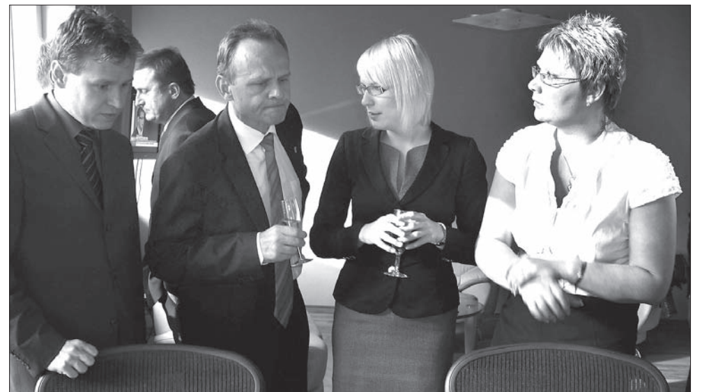
Ostatnie chwile napięcia przed laptopem. Za chwilę będą już znane definitywne wyniki wyborów.

Kiedy idę na autobus, wiatr podrywa z bruku pierwsze zerwane afisze wyborcze. No to po wyborach... JACEK SIKORA