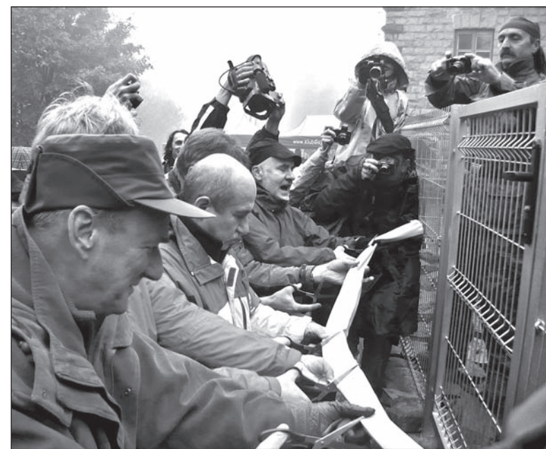
Uroczyste otwarcie alpinarium na beskidzkiej Szyndzielni.

Alpinarium najokazalej będzie się prezentowało na wiosnę. Jeżeli ktoś chce odwiedzić to miejsce już teraz, nic nie stoi na przeszkodzie. Klucze do ogrodu są w pobliskim schronisku. (wot)