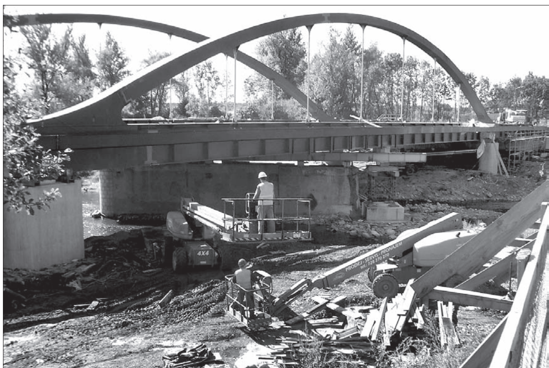
Prace przy budowie karwińskiego mostu wydłużą się o pięć dni.

szyn – Karwina – Ostrawa został uszkodzony w czasie ubiegłorocznej powodzi. Dyrekcja Dróg i Autostrad