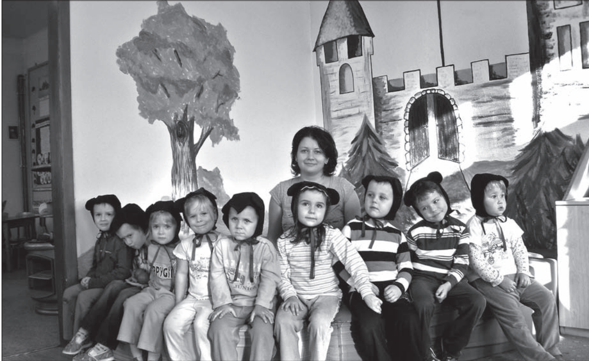
Przedsiębiorcy z Lutyni Dolnej będą jutro pasowane na misie.

Na pewno słyszeliście już o pasowaniu na przedszkolaka lub na ucznia. Ale czy wiecie, że jest takie przedszkole, gdzie dzieci będą pasowane na misie? Ja takie właśnie przedszkole odwiedziłam w zeszłym tygodniu. Znajduje się w Lutyni Dolnej, pracuje pod dyktando mieszczącej się obok Polskiej Szkoły Podstawowej, zapisanych jest do niego 20 dzieci. To właśnie dolnolutyńskie przedszkolaki będą jutro, w obecności rodziców, pasowane na misie.