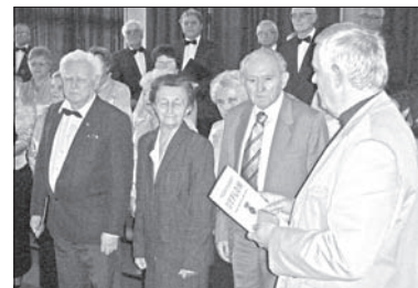
Członkowie darkowskiego koła uhonorowani odznaczeniami PZKO.