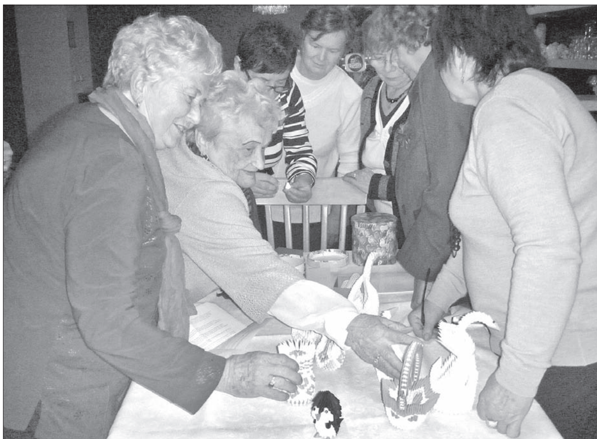
Panie poznawały m.in. tajniki wschodniej sztuki origami.