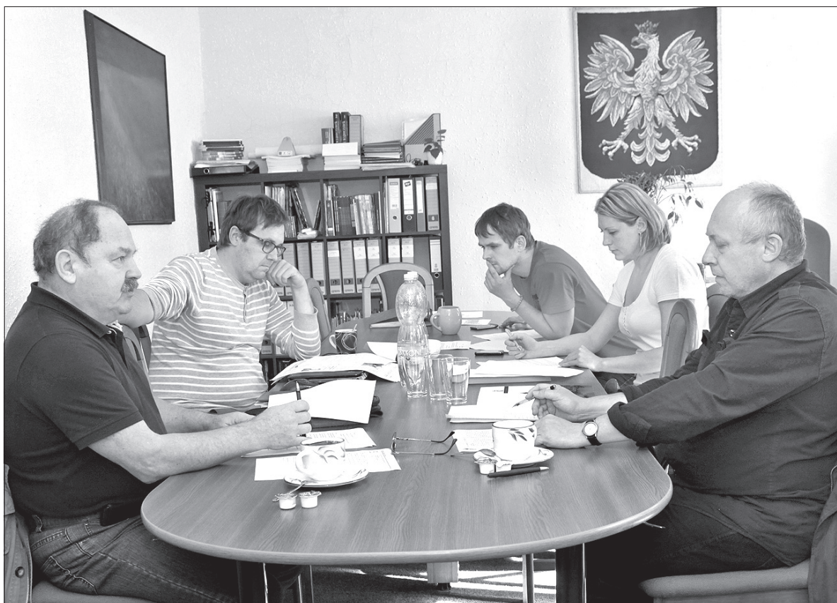
Z wczorajszych obrad kapituły.

– Okazało się, jak zresztą co roku, że jest bardzo dużo osiągnięć na naszym terenie, że ludzie są bardzo aktywni i to w przeróżnych dziedzinach, począwszy od zespołów teatralnych przez folklorystyczne czy osiągnięcia indywidualne. Z 26 nominacji mieliśmy wybrać 10, które przedstawimy naszym czytelnikom. Po półtoro godzinie obrad