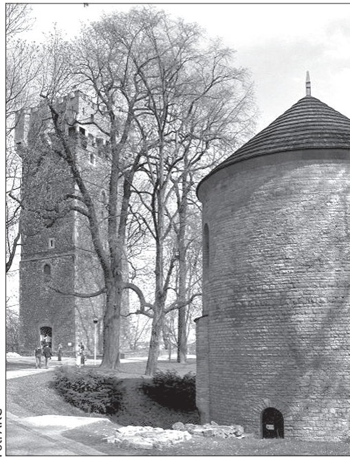
Romańska rotunda i Wieża Piastowska.

Z kolei w gronie nominowanych do miana „cudu” Polski znalazło się m.in. Centrum Dziedzictwa Szkła Krosno, Zamek Piastów Śląskich w Brzegu i Wzgórze Zamkowe w Cieszynie. W uzasadnieniu nominacji napisano: „W XIII w.