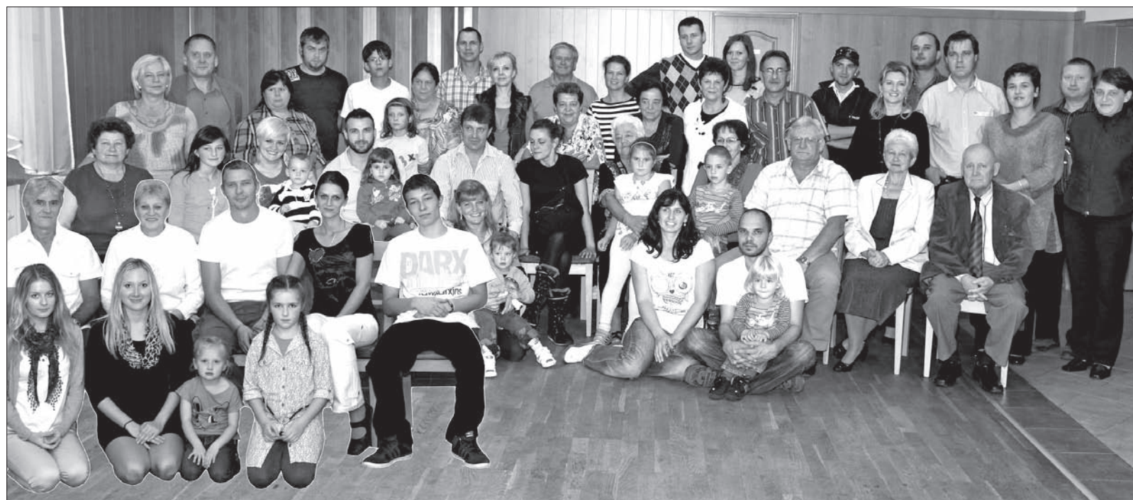
Uczestnicy sobotniego zjazdu rodziny Leitkepów.

kawałku roli we własnym gospodarstwie z dwiema lub trzema krowami, prosiakami i drobiem. Pięcioro starszych dzieci uczęszczało do polskiej szkoły w Olbrachcicach. Po roku 1920, kiedy we wsi otwarto szkołę czeską, tzw. masarykową, rodzice pod groźbą utraty pracy na kopalni przez głowę rodziny, zmuszeni byli kolejne dzieci zapisać do założonej wtedy szkoły czeskiej. Narodowość jednak zachowali polską. Na spotkaniu królowała gwara cieszyńska, ale najmłodsze pokolenie w większości posługiwało się już językiem czeskim.