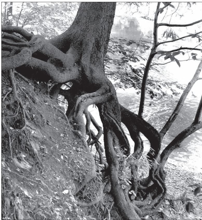
Nadmierna eksploatacja drzew w ostatnich latach martwi nie tylko ekologów.

Obszary, gdzie nie ma drzew, porasta wysoka trawa i gąszcz. Zagłuszają m.in. miejsca, gdzie stoją pomniczki upamiętniające ofiary Tragedii Żywocickiej, przez co nawet te, które znajdują się tuż obok głównej alei, stały się niewidoczne. Nadmierna eksploatacja drzew w lasach podmiejskich (nie tylko Żywocickim) realizowana w ostatnich latach martwi nie tylko mieszkańców. Nie podoba się również władzom Hawierzowa. W marcu wystosowały list do dyrektora generalnego spółki Lasy RC. Na konkretne wyniki, a raczej tylko obietnicę zmiany, trzeba było czekać pół roku. Dyrekcja generalna skierowała wódatrzy miasta do zarządu lasów w Ostrawie i dyrekcji wojewódzkiej w Frydku-