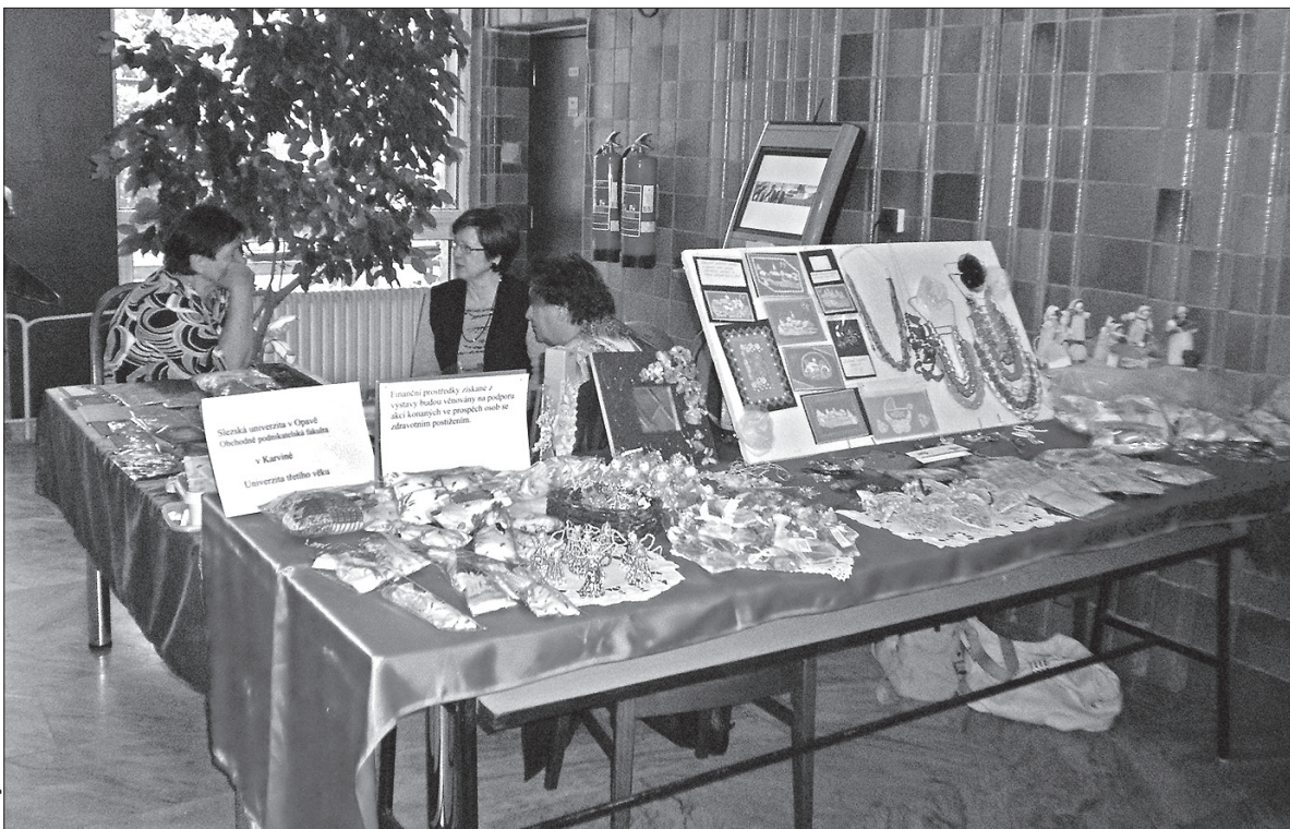
Swoje produkty przedstawili w Karwinie także pensjonariusze tzw. warsztatów pracy chronionej z Olzy.