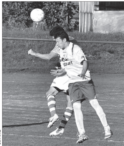
Z meczu Lutynia Dolna – Czeladna.

Piłkarzom Starego Miasta wystarczyły dwa strzały na bramkę Kreželoka, by wygrać te zawody. Gra toczyła się przeważnie w polu karnym gości, którzy liczyli na kontry i wybijanie piłki na osłep. Taktyka stosowana przez większość zespołów gra-