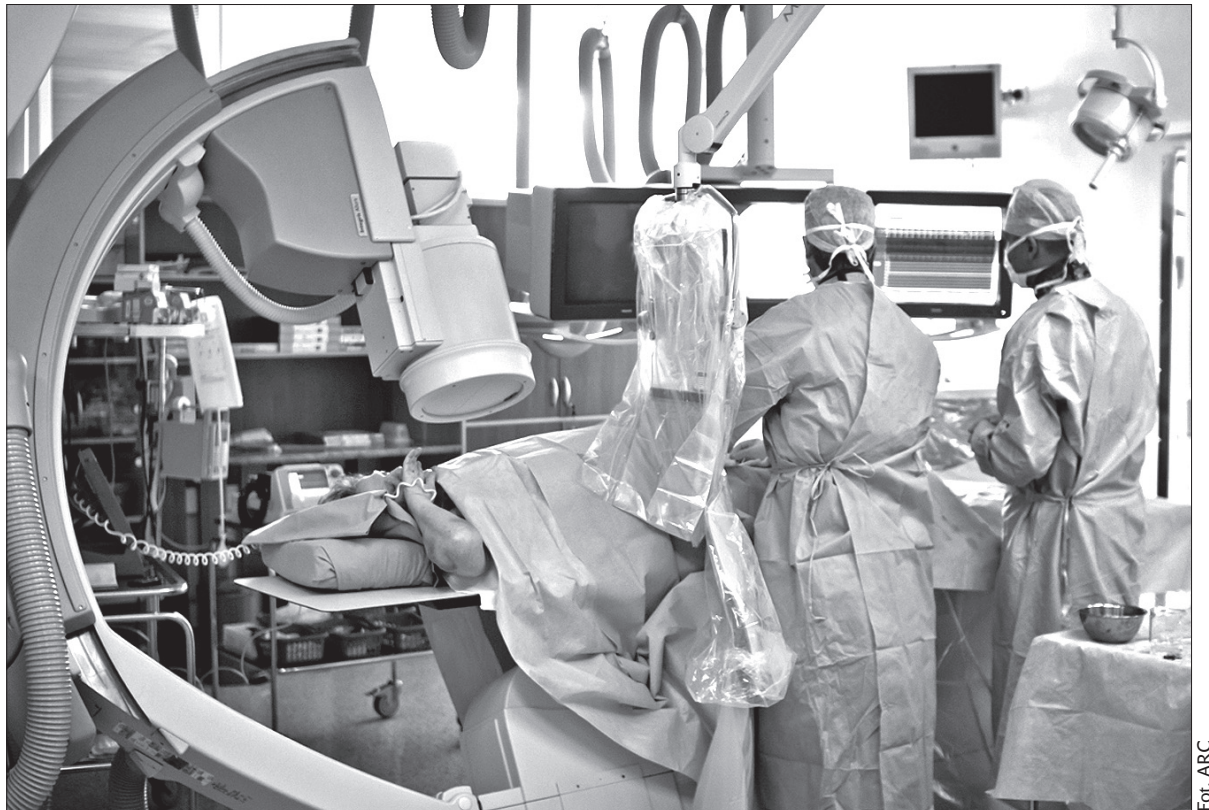
Unikatowy zabieg w Szpitalu Podlesie.

Szpital Podlesie od 2009 wchodzi w skład narodowej sieci ośrodków leczenia chorób sercowo-naczyniowych, utworzonej przez ministerstwo zdrowia. Trzyńscy lekarze, jako pierwsi w kraju, przeprowadzili od tego czasu kilka unikatowych zabiegów. (dc)