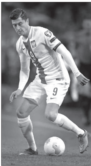
Robert Lewandowski znalazł się w gronie 23 piłkarzy, którzy powalczą o „Złotą Piłkę” FIFA.

alu Madryt, Portugalczyka Cristiano Ronaldo. Tuż za nim plasują się Brazylijczyk Neymar, Argentyńczyk Lionel Messi (obaj FC Barcelona) i właśnie Robert Lewandowski. Co ciekawe, „Lewego” faworyzują wysoko chociażby rodacy Ronaldo, czyli portugalscy dziennikarze. „Lewandowski zwrócił na siebie uwagę występem we wrześnieym meczu Bundesligi przeciwko VfL Wolfsburg, kiedy to w zaledwie dziewięć minut zdobył pięć bramek. Kapitan reprezentacji Polski był też najsukcesywniejszym snajperem eliminacji do Euro 2016” – czytamy na łamach Polskiej Agencji Prasowej, która cytuje prestiżowe portugalskie pismo „Record”. Lewandowski nie dał się jednak wciągnąć w zabawę portugalskich dziennikarzy. – W tym momencie nie myślę o nagrodach indywidualnych. Jeśli będę miał szansę na to trofeum pod koniec sezonu, to będę się tym zajmował. Teraz jest na to za wcześnie. Dla mnie najważniejszy jest następny mecz. Jako napastnik muszę zachować spokój – powiedział Lewandowski. – Znam tę sytuację z występów w moim poprzednim klubie, Borussia Dortmund. Strzelałem gole w dwunastu meczach Bundesligi z rzędu, a także cztery bramki w pierwszym meczu półfinałowym Ligi Mistrzów przeciwko Realowi Madryt. Czasami trudno jest przejść spokojnie obok