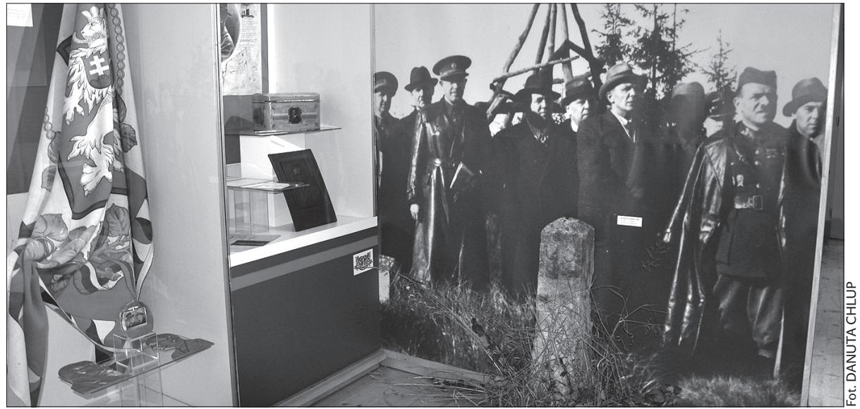
Kamień graniczny z granicy czechosłowacko-polskiej i gablota poświęcona T.G. Masarykowi.

Kustosze jabłonkowskiego muzeum wyjaśniła, że ze względu na ograniczone możliwości lokalowe placówki, podjęte przez muzeum tematy zostały tylko zasygnalizowane. Do autora ekspozycji zwróciliśmy się z pytaniem, czy – mimo wszystko – nie można było tak ważnych tematów, rzutujących również na dzisiejsze współżycie Czechów i Polaków w tym regionie, potraktować bardziej kompleksowo? Zasugerowaliśmy, że w przypadku, gdy w jabłonkowskiej