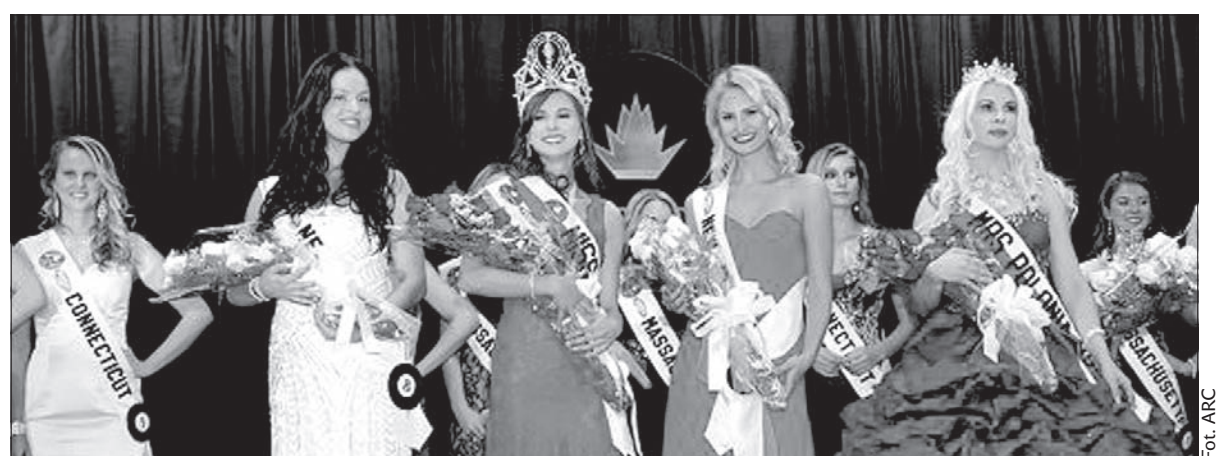
Polki zachwycają urodą na całym świecie.