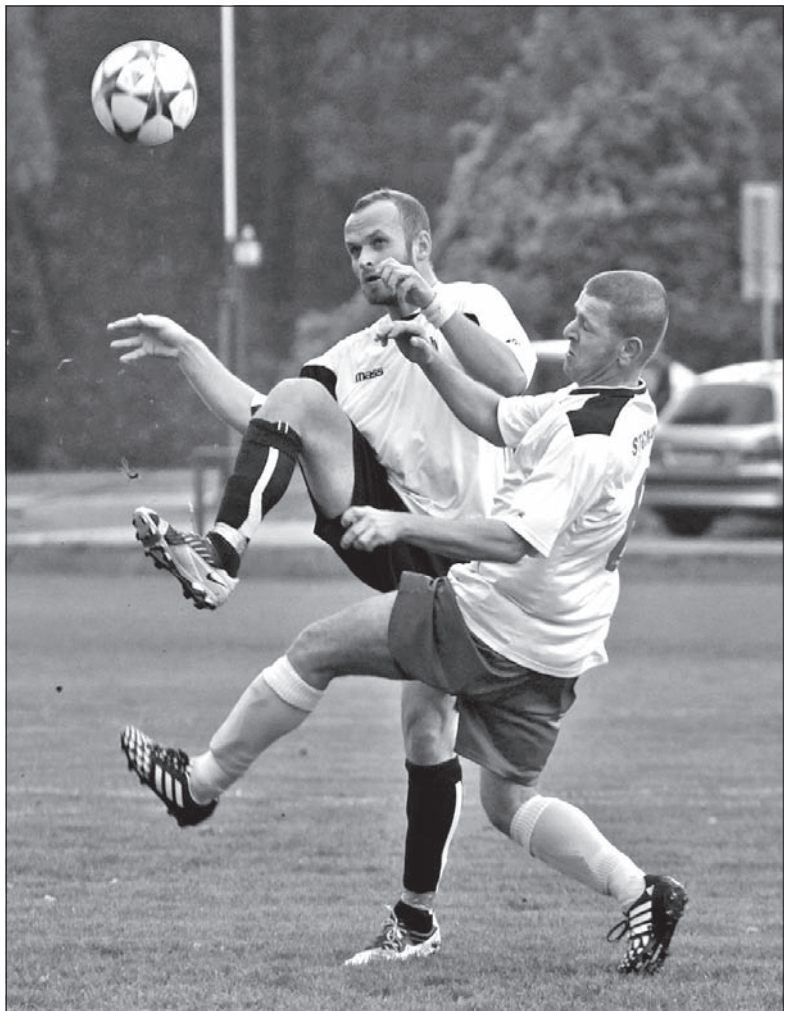
Banik Olbrachcice rozbił w derbach Stonawę 4:1.