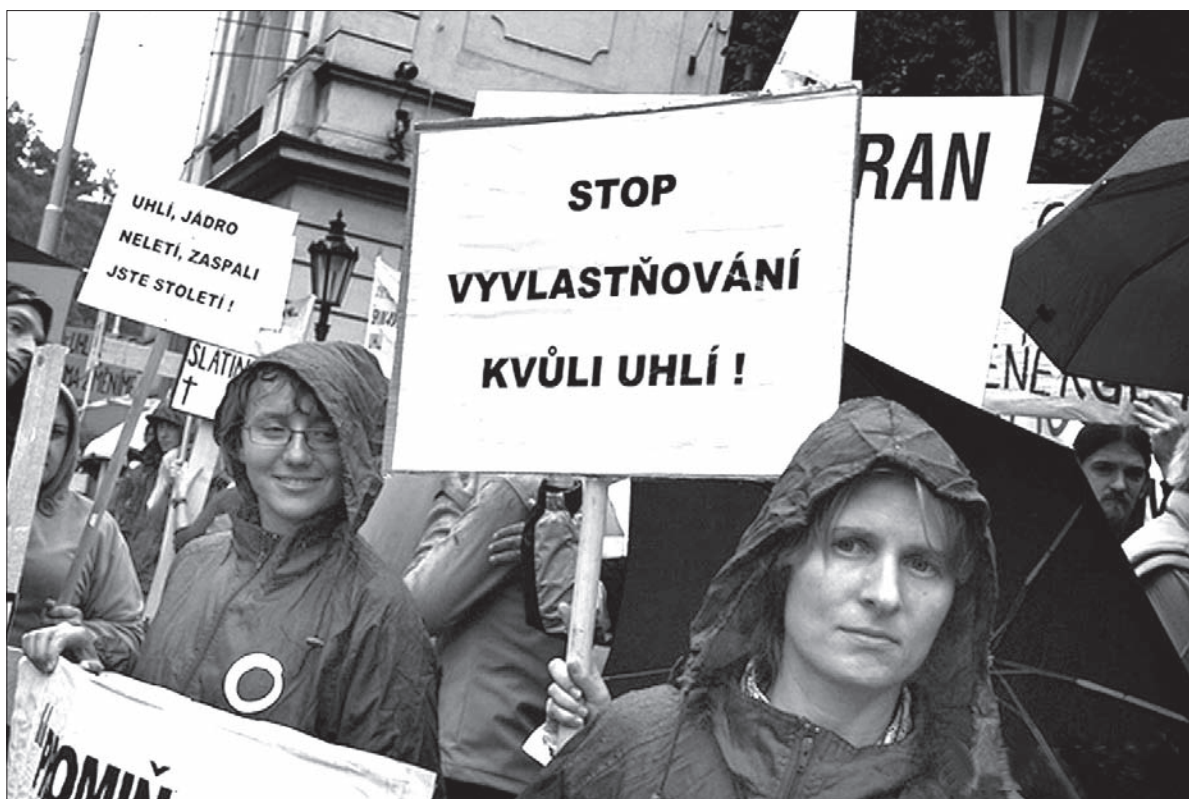
Protest aktywistów Greenpeace w Pradze.