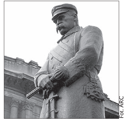
Pomnik Piłsudskiego w Warszawie.