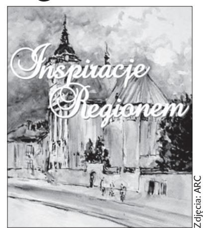
Zaproszenie na wystawę.

Wernisaż wystawy odbędzie się 5 listopada o godzinie 14.00 w sie-