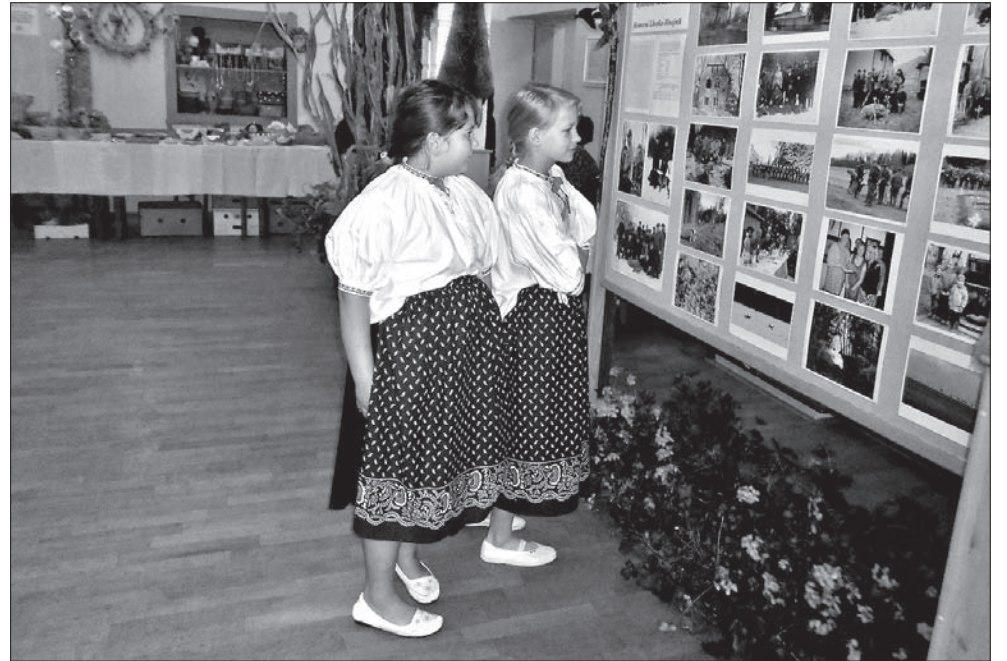
Wystawa zdjęć o historii ligockich myśliwców zainterесowała także uczennice gnojnickiej polskiej podstawówki.