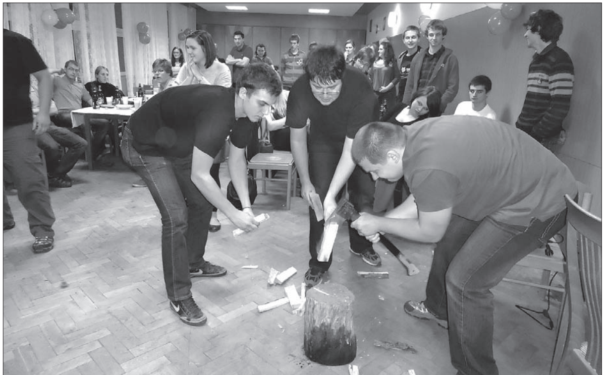
Podczas Kluboturnieju rąbano też drewno...

Dyscyplin, bardzo ciekawych, było kilka. Pierwszą była pięciominutowa, multimedialna prezentacja poszczególnych drużyn. Później były trzy serie pytań dotyczących Zaolzia, Klubów Młodych PZKO i Polski. Młodzieżowcy współzawodniczyli