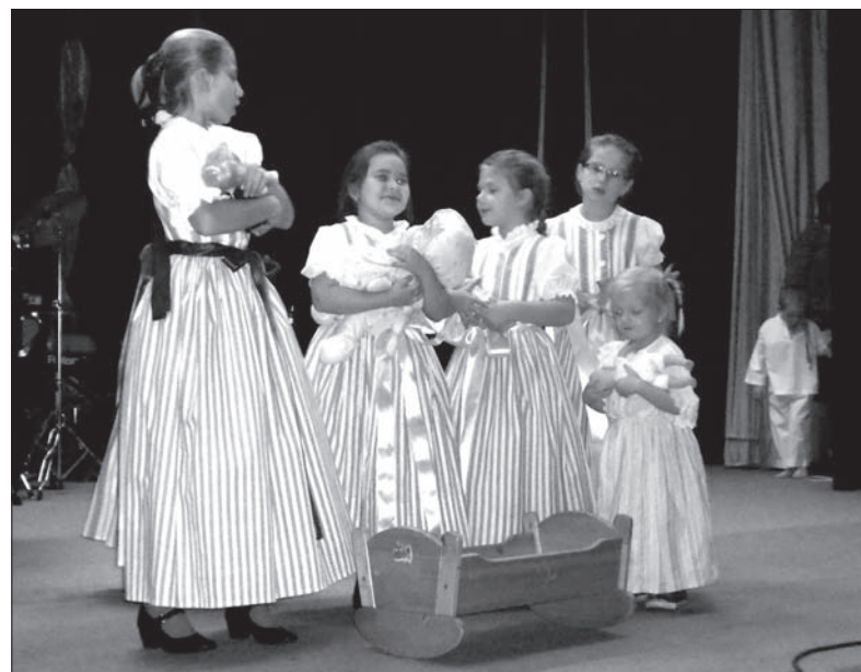
Orłowian wzsruszyły tańce i piosenki w wykonaniu „Skotniczki”.

– Cenimy sobie osiągnięcie folklorystycznej tanecznej „Skotniczki” –