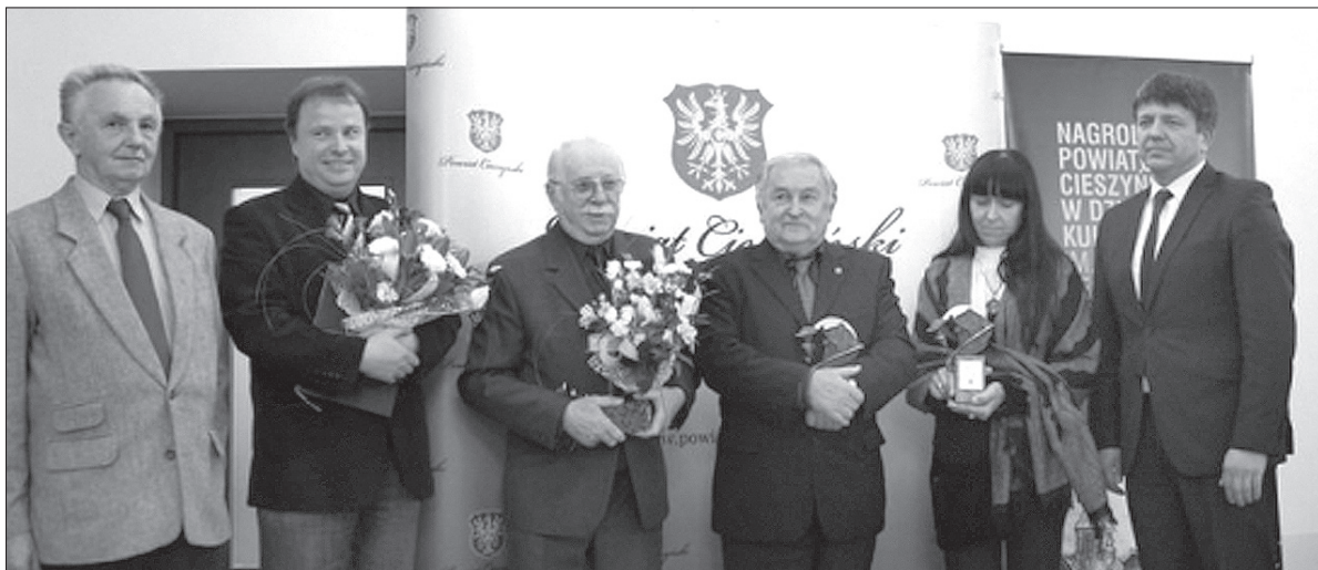
Tegoroczni laureaci nagrody ks. Szersznika.