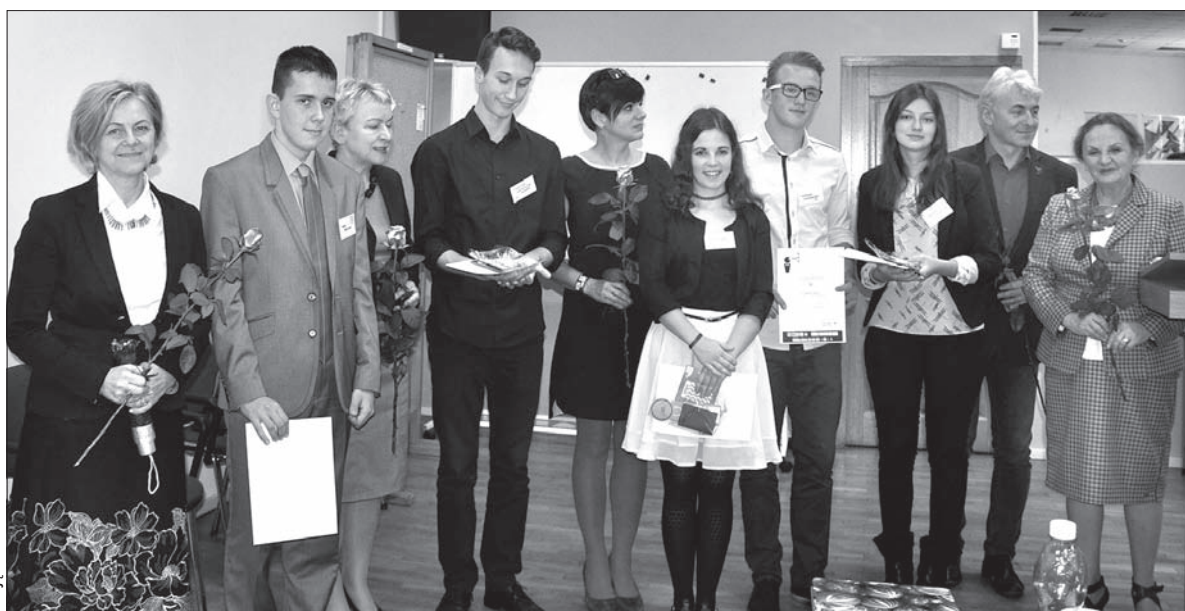
Laureaci oraz jurorzy cieszyńskich eliminacji Ogólnopolskiego Konkursu Krasomówczego im. Wojciecha Korfanteo.

– Wzięliśmy pod uwagę kryteria związane z budową wypowiedzi, jej kompozycją, zawartością meryto-