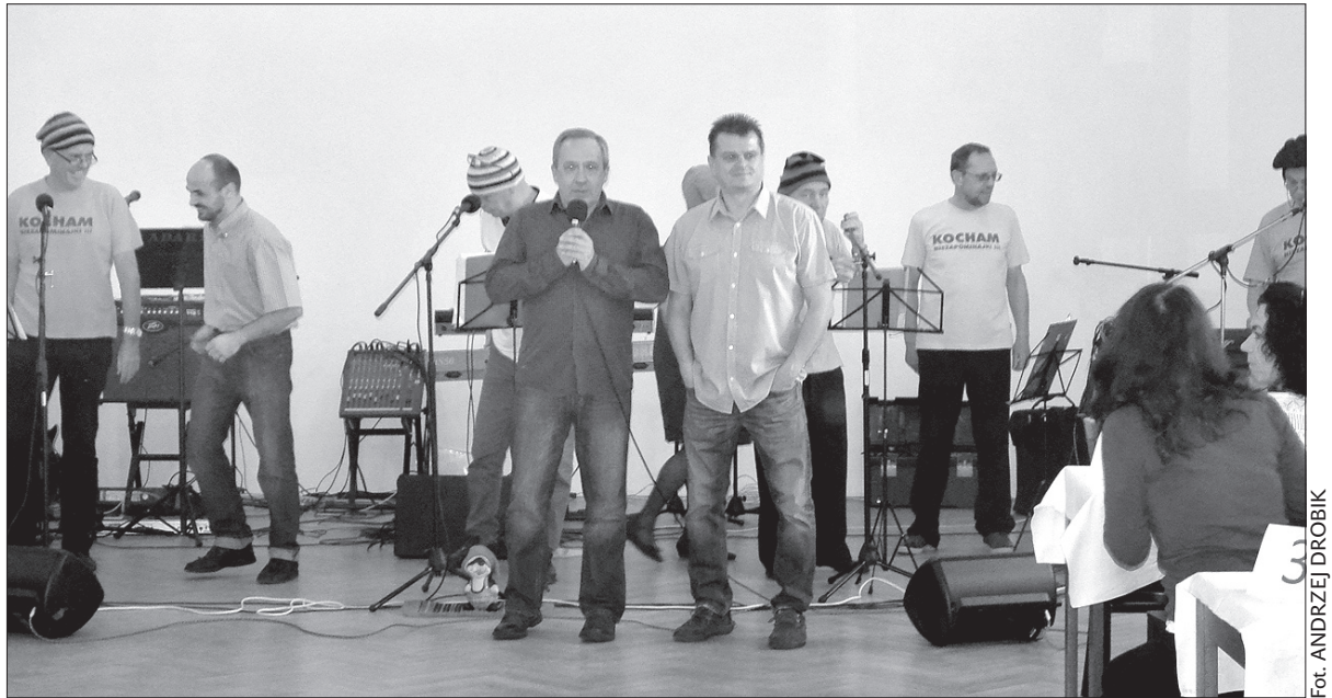
Zabijaczka ma wymiar nie tylko kulinarny, ale przede wszystkim jest okazją do wspólnej zabawy.

Przy okazji imprezy można też zamówić domowe wyroby. Wiele osób, które zrobiło tak w latach ubiegłych, powraca, a zamówień jest więcej. – W zeszłym roku przygotowaliśmy 900 jelit czarnych, w tym roku 1300, teraz zrobiliśmy 600 jelit białych, a rok temu tylko 400, najwięcej osób przekonało się do „świyczek”, w tym roku zrobiliśmy 140 kawałków, a w zeszłym około 80. To wszystko bardzo nas cieszy, bo widać że ludzie przyzwyczaili