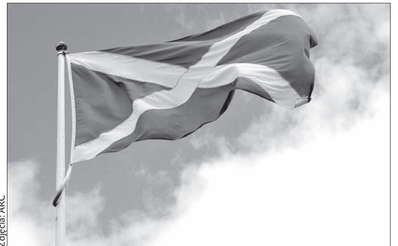
W Szkocji mieszka ok. 86 tys. Polaków.

nową i dostosowanie do potrzeb lokalnej społeczności w Glasgow.