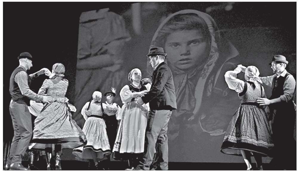
Program artystyczny był bardzo bogaty.