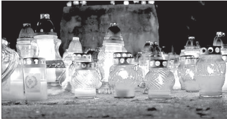
Pamięć o naszych przodkach jest żywa.