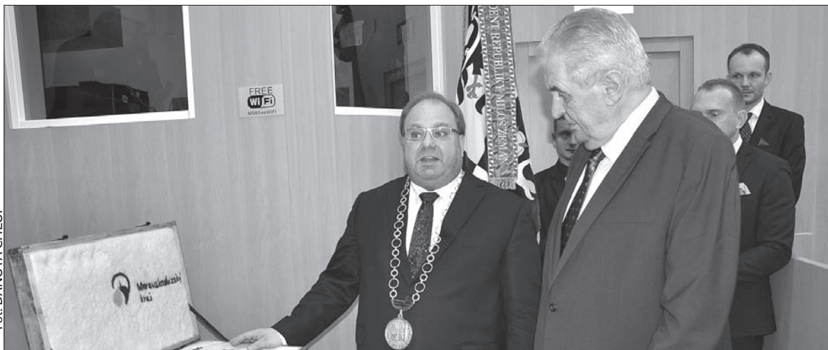
Prezydent Miloš Zeman otrzymał w darze od hetmana Miroslava Nováka regionalne wyroby rękodzielnicze. Zrewanżował się „prezydencką” śliwovicą i miodem.

Źródło: informacje uzyskane z organizacji zarządzających cmentarzami w poszczególnych miastach. Opr. (dc)