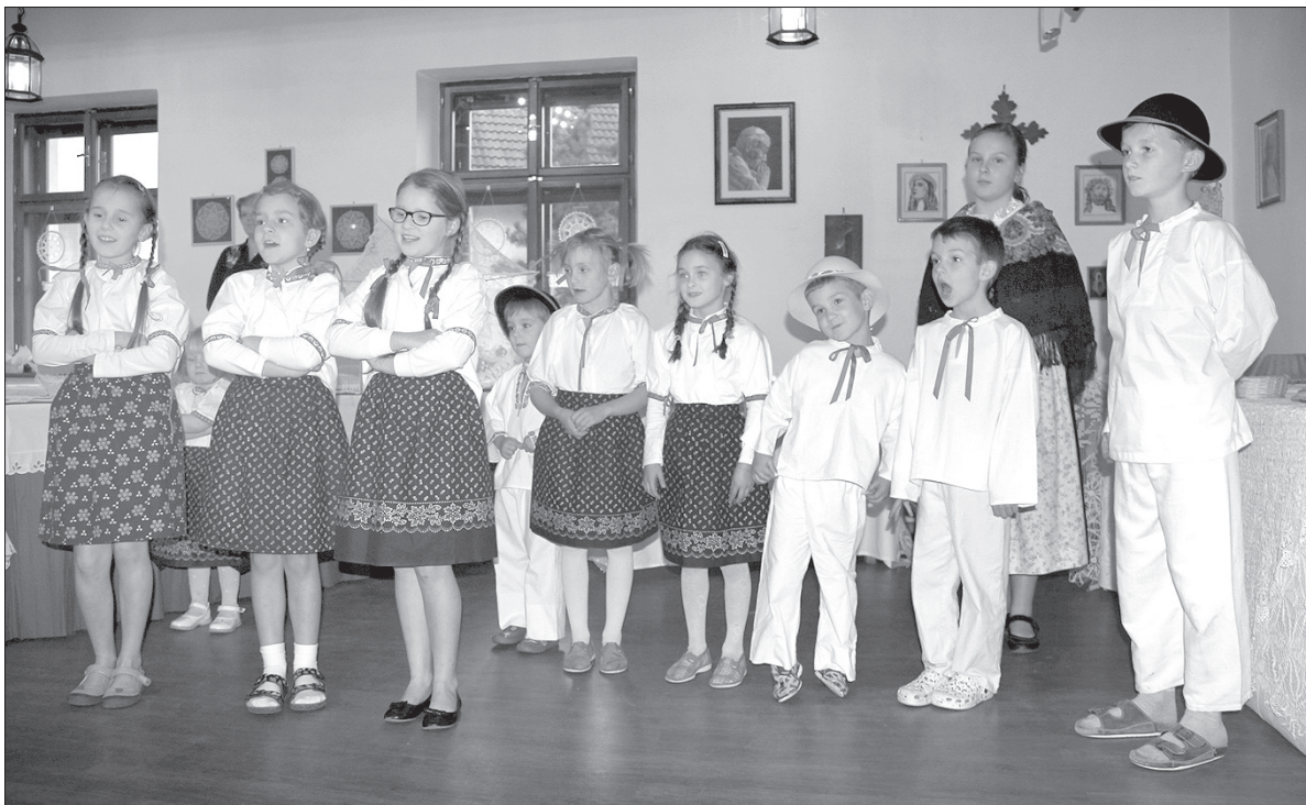
Na wernisażu wystąpiły dzieci z przedszkola i szkoły w Łomnej Dolnej.