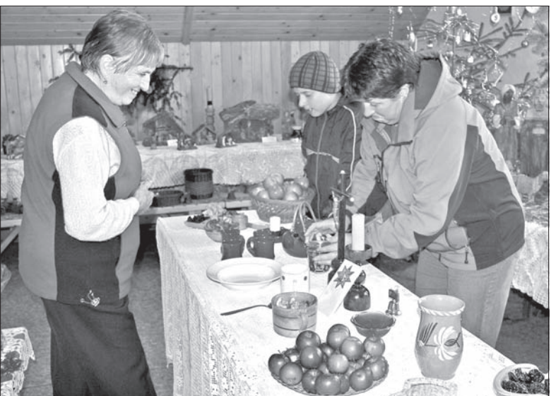
Wystawa w Bukowcu.