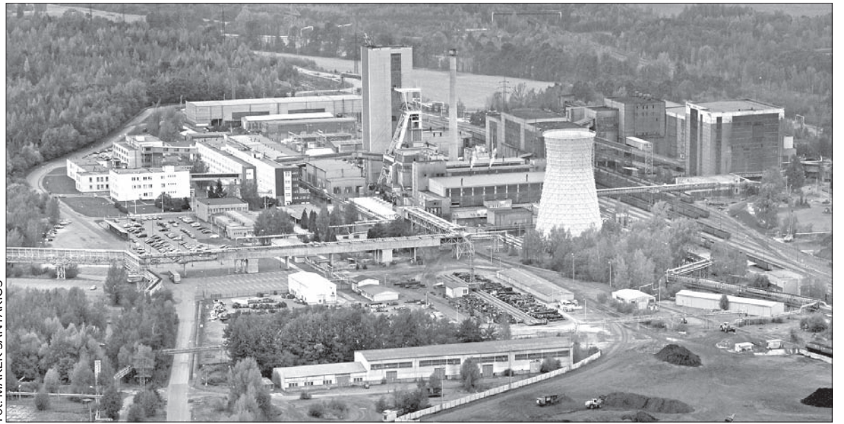
Kopalnia „ČSM” z lotu ptaka.

nicy nie przegłosują strajku, związki zawodowe podpiszą układ zbiorowy. – W tej chwili nie ma już innej drogi – powiedział Pytlík. (dc)