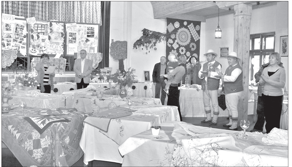
Wystawa jabłonkowskiego Klubu Kobiet odbyła się w miejscowym Domu PZKO.

Kto przyszedł na piątkowy wernisaż wystawy, miał okazję dowiedzieć się, że członkinie miejscowego Klubu Kobiet są również utalentowane kulinarnie. Do skosztowania były pyszne ciastka i pierniczki oraz tradycyjne śląskie potrawy. – Mamy barszcz, sznyce, sałatkę, knedle, pyszne sosy, pieczone mięso, gałuszki ze szpyrkami, domowe masło czy twaróg. Napiekliśmy też dużo pier-