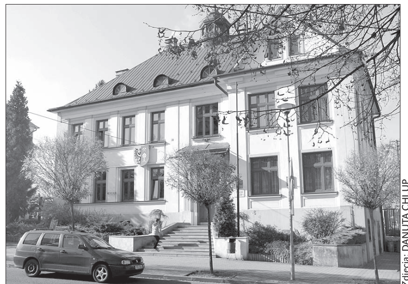
Urząd w Dąbrowie.