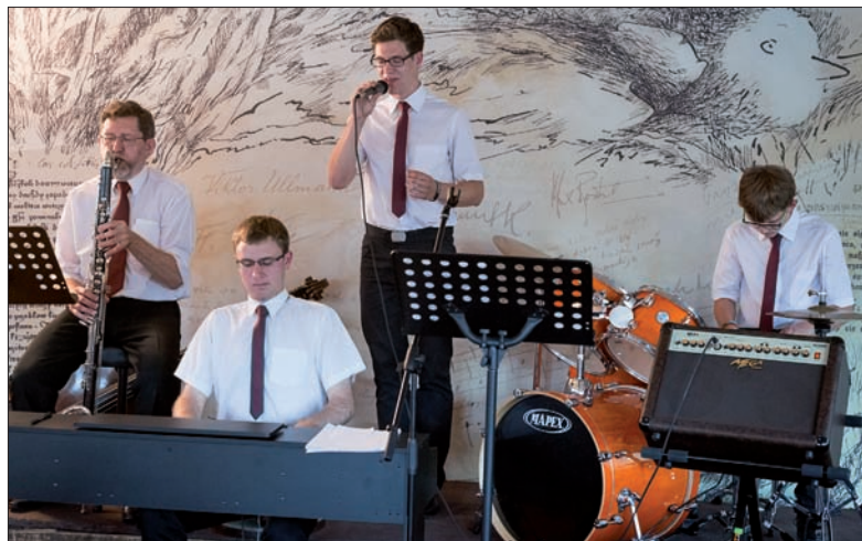
„MolinoGranie” w kawiarni „Avion” w Czeskim Cieszynie