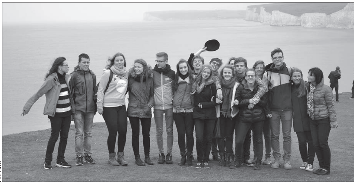
„Gimplocy” w Anglii.

W Hastings mieszkaliśmy w domach angielskich rodzin, gdzie mo-