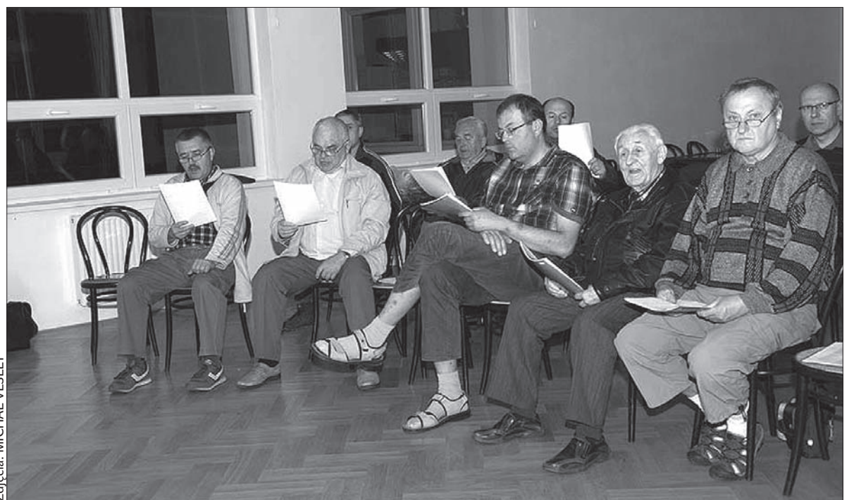
Chórzyści na próbie w sali Domu PZKO w Karwinie-Frysztacie.