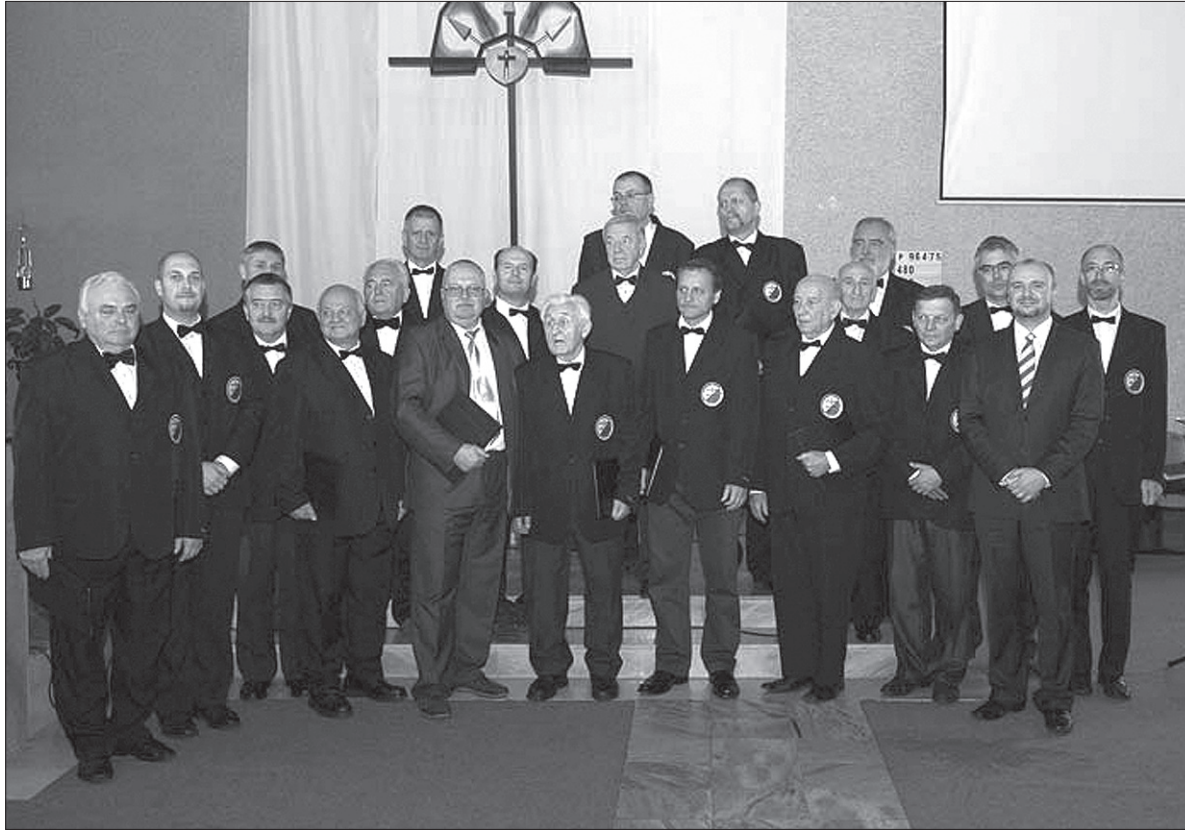
„Hejnał-Echo” na jednym z ostatnich przed koncertem jubileuszowym występów.