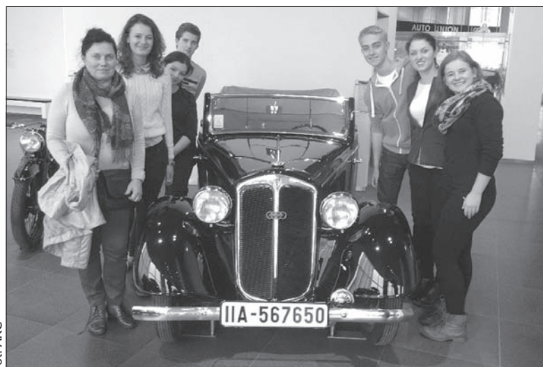
Wspólne zdjęcie z historycznym audi.

Tak czy owak gimnazjaliści wrócili do domu pełni wrażeń, nowych doświadczeń i z lepszymi umiejętnościami językowymi. Zresztą nawet nie mogło być inaczej, skoro podróżę kształca. (sch)