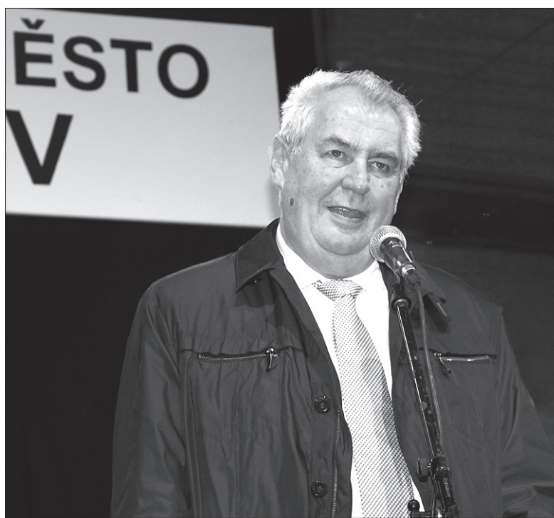
W poniedziałek prezydent RC Miloš Zeman odwiedził Hawierzów.

Reżyserami dalszej części spotkania byli mieszkańcy. I chociaż nie wszystkim udało się przedrzeć do mikrofonu, pytania, które zostały zadane, poruszały cały szereg nurtujących społeczeństwo zagadnień. Pierwsze z nich dotyczyło poglądu prezydenta na karę śmierci. Zeman jednak ku niezadowoleniu wielu opowiedział się przeciwko jej wprowadzeniu. – Jestem za dożywotnim więzieniem bez możliwości warunkowego zwolnienia, jestem za dożywotnim wykonywaniem robót