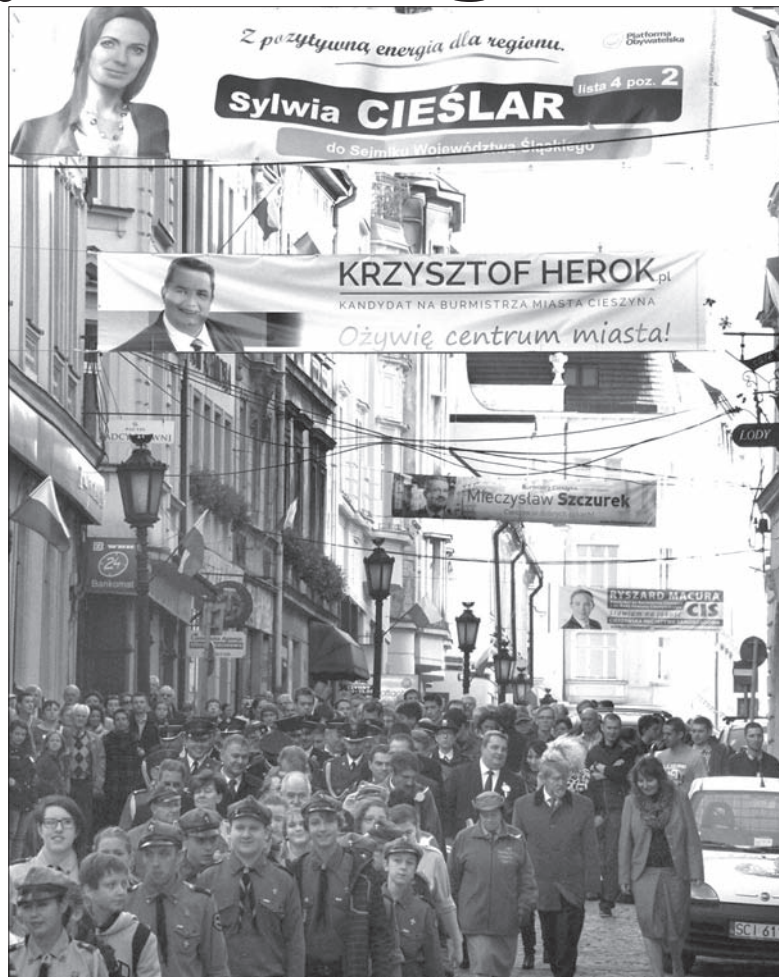
W Polsce kampania przed listopadowymi wyborami samorządowymi jest właśnie na ostatniej prostej.

W Polsce, by zostać burmistrzem lub wójtem, trzeba w wyborach zdobyć ponad 50 procent głosów. Jeśli żadnemu z kandydatów sztuka ta się