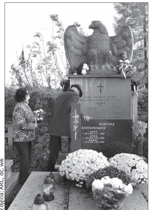
Pod pomnikiem polskich legionistów, którzy leżali i zmarli w Jabłonkowie.