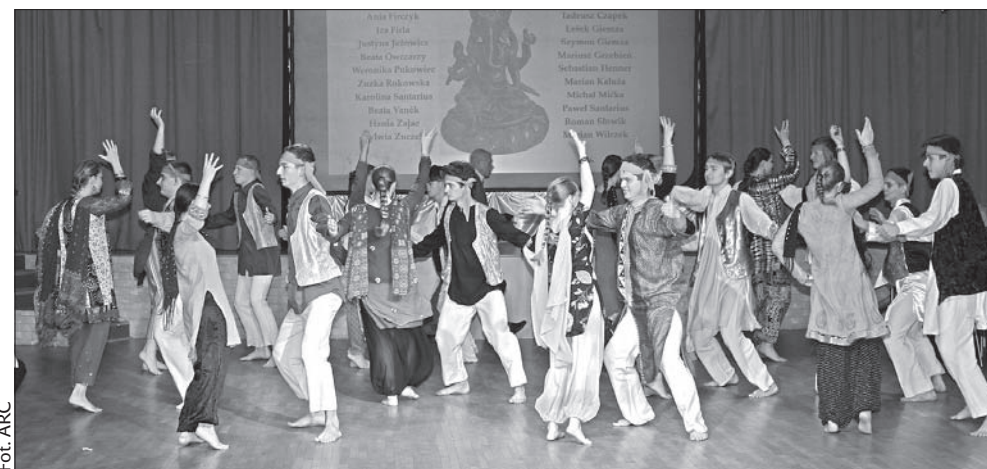
Taniec hinduski bhangra.