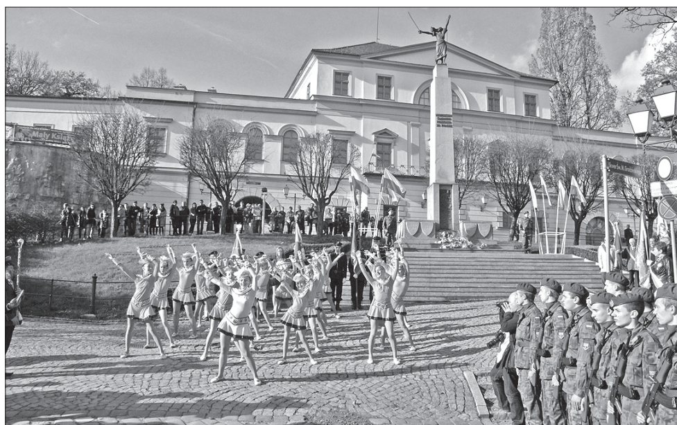
Patriotyczną manifestację pod Pomnikiem Legionistów zakończył występ cieszyńskich mażorettek.