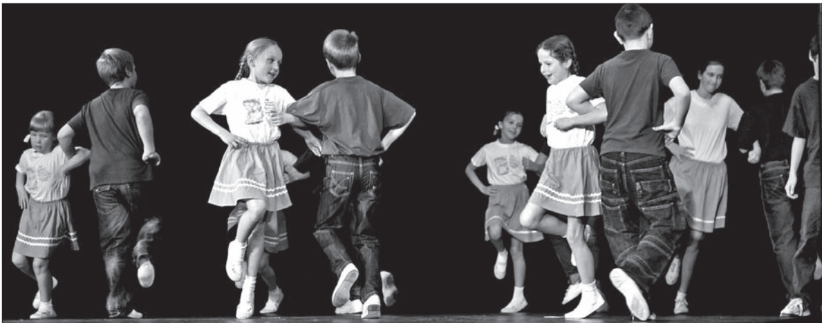
Na scenie uczniowie PSP w Błędowicach.