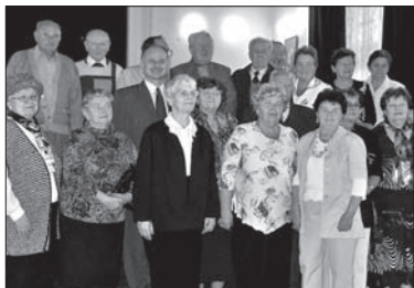
Dwudziestka jabłonkowskich seniorów.

JABŁONKÓW (kor) – Uroczyste przyjęcie dla wszystkich seniorów, którzy w tym roku ukończyli 75. rok życia, przygotowały władze stolicy zaolziańskiej góralszczyzny. Z 38 tegorocznych 75-latków przybyła do sali kinowej ratusza dwudziestka seniorów. Każdy z nich otrzymał książkę i dyplom pamiątkowy. O program zatroszczyli się uczniowie polskiej i czeskiej podstawówki.