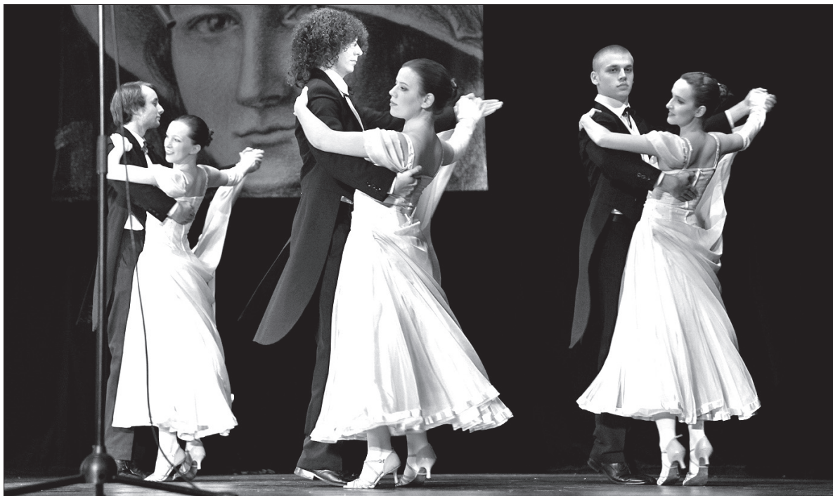
Zespół Regionalny „Błędowice” rozpoczął program polonezem i walcem.