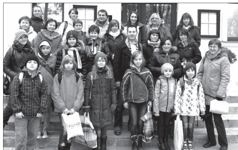
Wędryńska ekipa w Poniatowej.