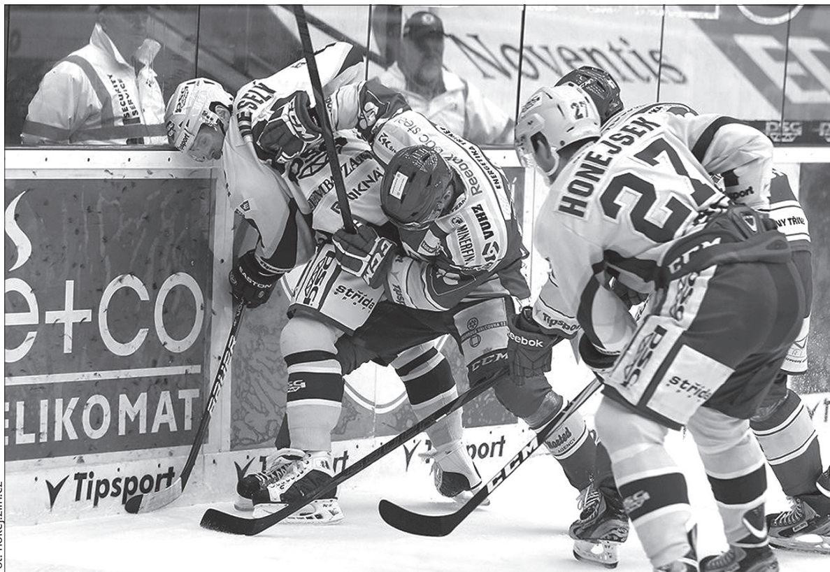
Trzyniec przegrał drugi mecz z rzędu. Tym razem na wyjeździe ze Zlinem.

Gospodarze po strzale Čajánka w przewadze liczebnej wyszli na prowadzenie. Trzyniec rozpoczął spotkanie od wysiadania na ławce kar, ale w 11. minucie sami w prze-