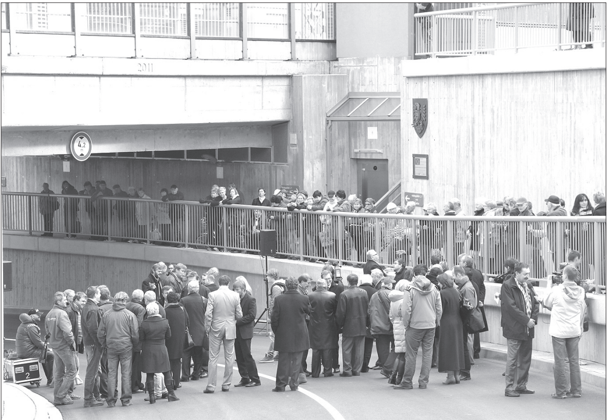
W otwarciu Via Łyżbice brali udział nie tylko oficjalni goście, ale też tłum mieszkańców.