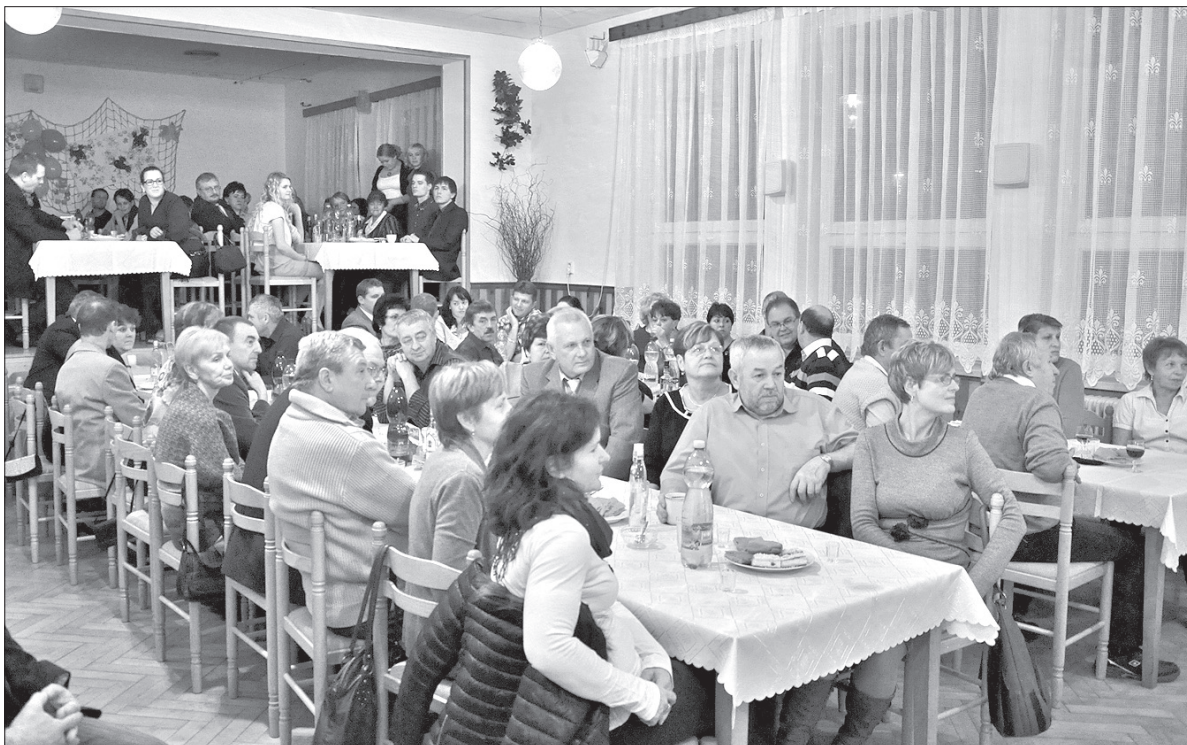
W sobotę w Gródku bawili się około 70 osób.