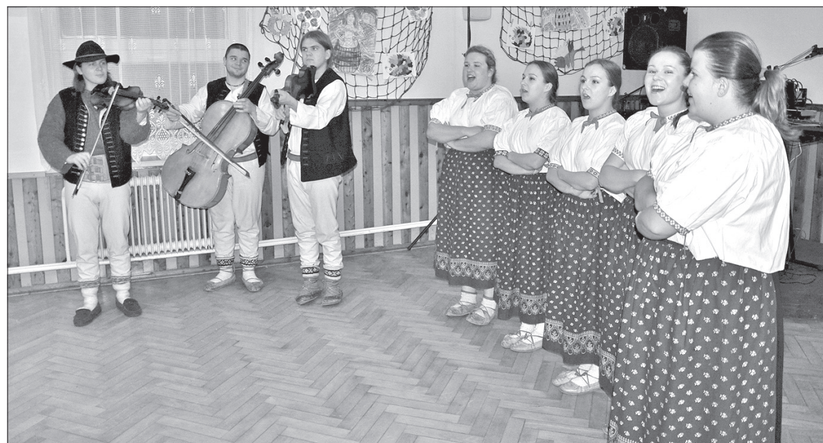
W sali Domu PZKO wystąpił m.in. zespół folklorystyczny „Lipka”.