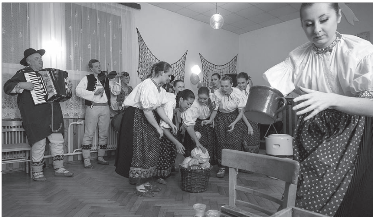
W sobotę w Domu PZKO w Gródku dużo się działo.