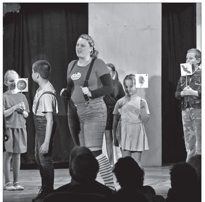
Najpierw scena Domu Kultury należała do dzieci.