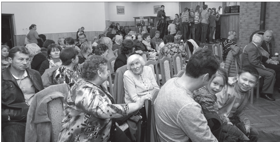
Widownia jak zawsze dopisała.