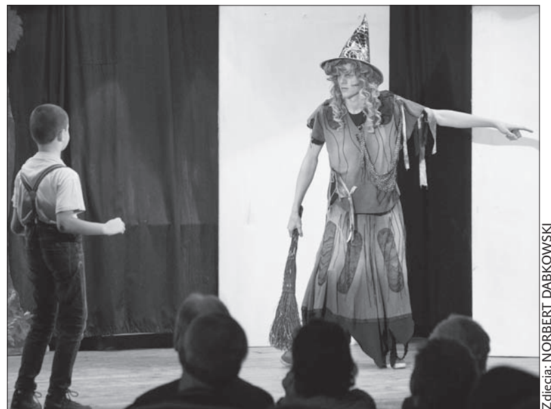
Zabawa w Jasioniu była przednia...