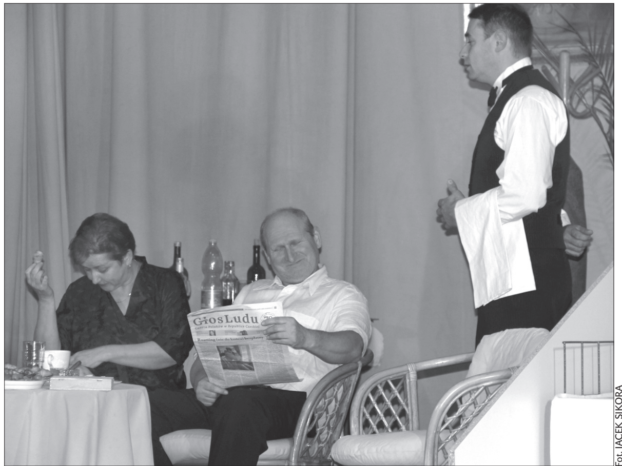
„Głos Ludu” to ulubiony rekwizyt w amatorskich teatrach.