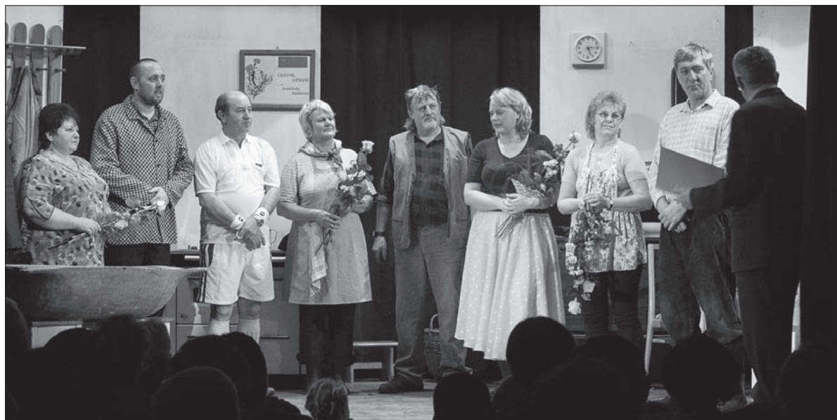
Aktorzy dali z siebie wszystko, więc podziękowania były jak najbardziej zasłużone.