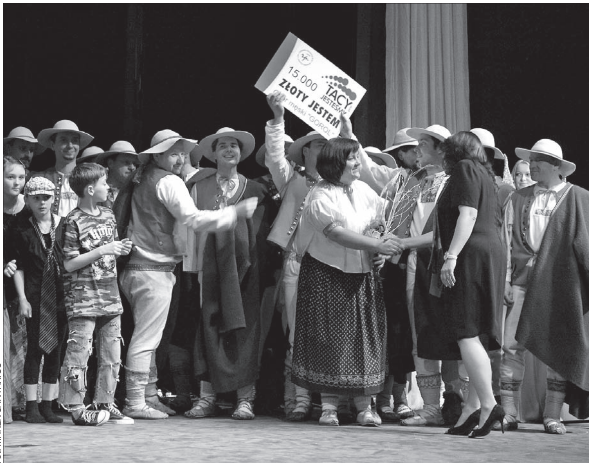
Zdjęcie z gali finałowej Tacy Jesteśmy 2010.