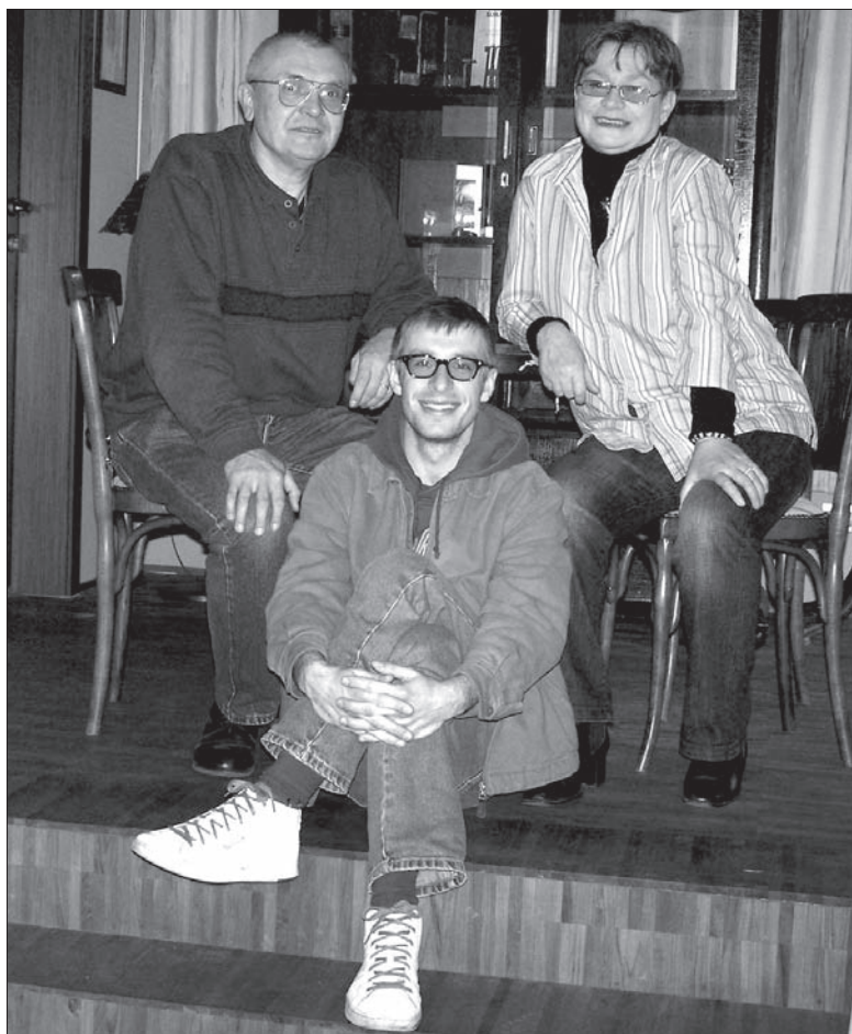
Humory dopisują, jak na kabareciarzy przystało...

TH: Tak, grywaliśmy sztuki: „Długi, Szeroki i Krótkowzroczny”, „Ogniu” (w oryginale „Posel z Liptákova”), „Bobek Niemowa” („Němý Bobeš”), „Akt”, „Dziennik lekcyjny” („Vyšetřování ztráty třídní knihy”) oraz „Zdobycie Biłoguna Północnego”. Oczywiście, że z seminariami, które tak bawią publiczność. A wystawialiśmy je