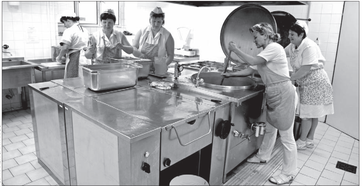
Pracownice stołówki szkolnej przy ul. Havlička w Czeskim Cieszynie brały udział już we wrześniowej akcji protestacyjnej. Jutro również będą strajkowały.

Do strajku włączą się m.in. nauczyciele i pozostali pracownicy PSP im. Henryka Sienkiewicza w Jabłonkowie. Szkoła będzie przez cały dzień zamknięta, tak samo jak szkoła czeska i Urząd Miasta. W Karwinie strajkować będą pracownicy większości szkół i przedszkoli, a także Biblioteki Regionalnej, natomiast magistrat będzie pracował bez zmian – udział w strajku zgłosili tylko dwaj