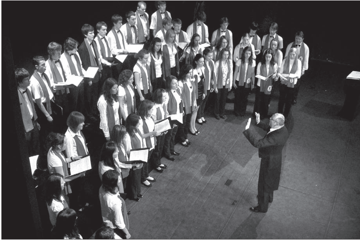
Chór Studencki „Collegium Iuvenum” w trakcie swojego występu jubileuszowego.

W białych koszulach i ciemnych spodniach, z bordowym szaleem przewieszonym tak, by logo zespołu znajdowało się po lewej stronie (!), na scenach występowało wielu dzi-