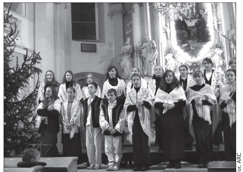
Chór „Crescendo” przed ołtarzem.