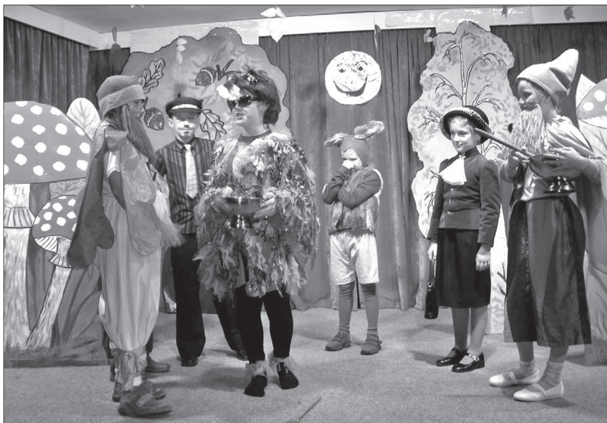
Wspólnie przygotowana leśna uczta uratowała przyjaźń dwóch krasnali.