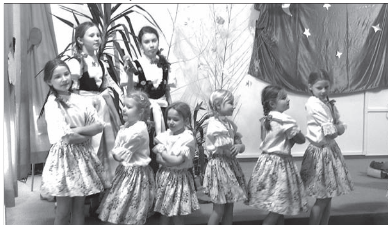
Młodzi uczniowie wystawili miejscową legendę o utopcu ze Szczyrkuli.

Przez program, w który włączyli się wszyscy uczniowie oraz przedszkolaki, przewijał się motyw tradycji ludo-