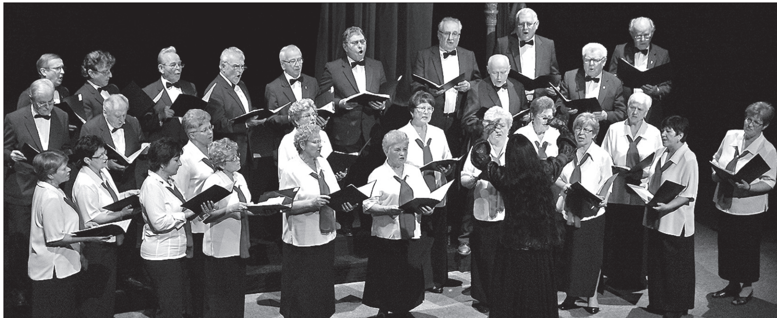
Koncert finałowy otworzył chór mieszany „Lira”.