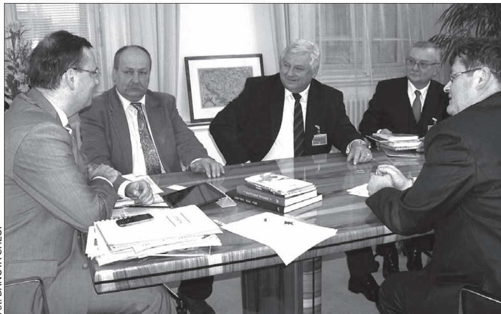
Rozmowa z premierem Petrem Nečasem w Kancelarii Rządu.