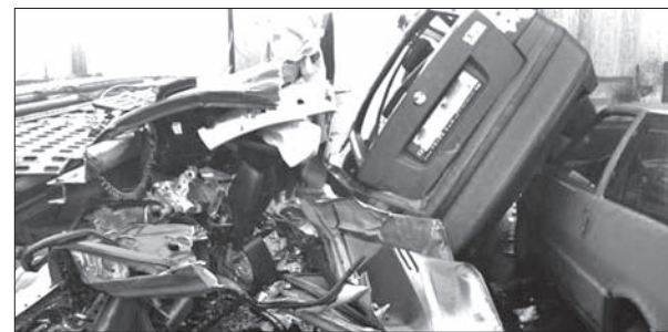
Tyle zostało z samochodów po karambolu.

Wypadek miał miejsce na zężeniu trasy. Najpierw zderzyło się siedem pojazdów, a na nie zaczęły wpadać kolejne auta. Na miejscu panowała mgła, było bardzo ślisko. (dc)