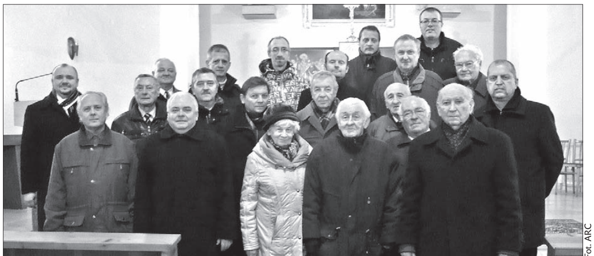
Z górniczym pozdrowieniem „Szczęść Boże”.