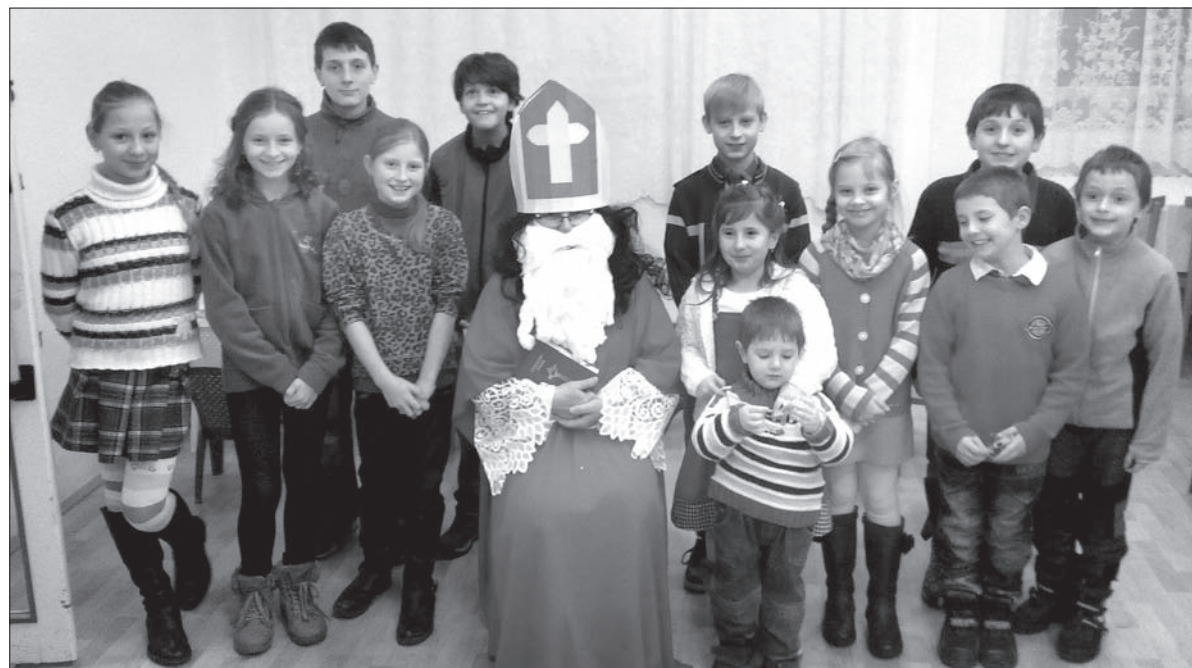
Piotrowice k. Karwiny. Bez pamiątkowego zdjęcia z Mikołajem nie mogło się obyć.