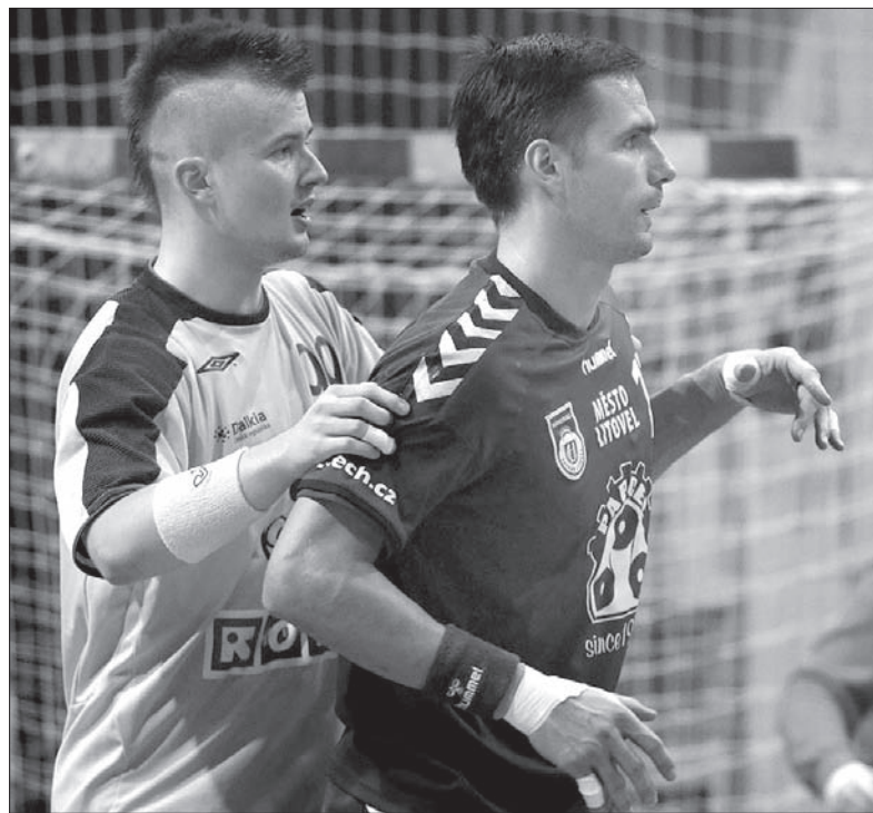
Szczypiornicy Banika przelamali złą passę.