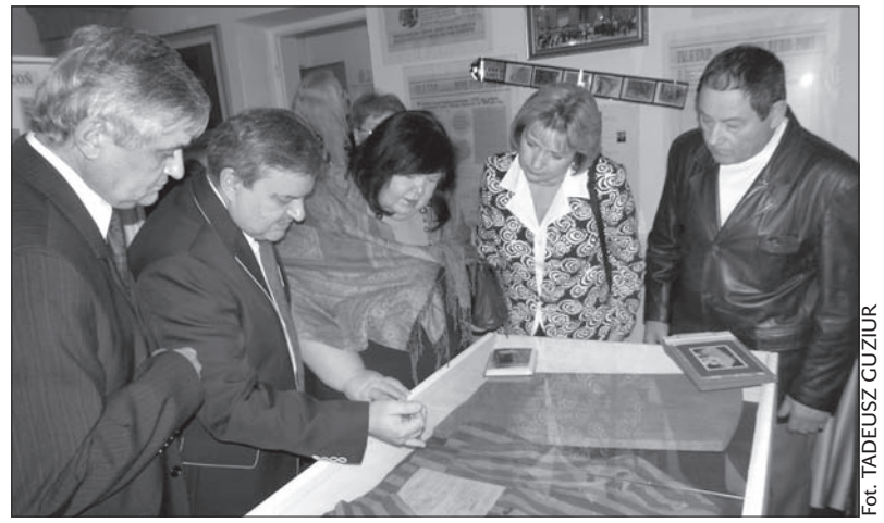
W zmodernizowanej Izbie Tradycji w Skrzezoniu.