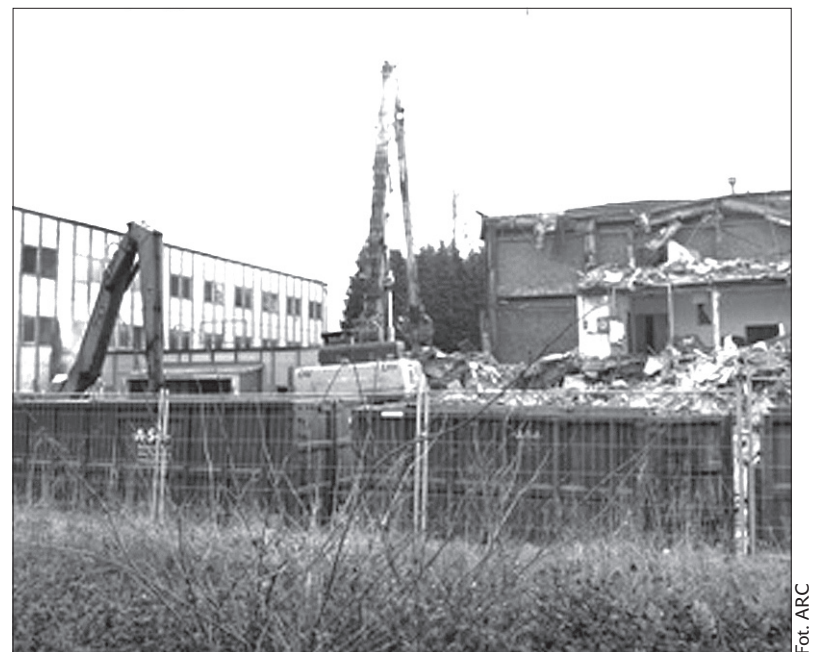
Budynek byłej noclegowni „Průkopník” w Karwinie-Granicach zostanie zrównany z ziemią. W tym tygodniu, tydzień po tym, jak noclegownię opuścili ostatni lokatorzy, rozpoczęła się rozbiórka obiektu. Dom noclegowy zamknięto przed rokiem. Przez długi czas nie wiadomo było, jaki los czeka budynek po zlikwidowaniu noclegowni. Miasto obawiało się, że do budynku wrócą problemowi mieszkańcy. Decyzję o rozbiórce podjął w końcu sam właściciel. (ep)