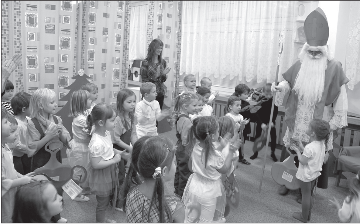
W piątek do przedszkola w Sibicy zawitał św. Mikołaj.

Na pewno w niejednym przedszkolu i niejednej szkole gościł w ostatnich dniach wyjątkowy gość. W piątek do placówki w Czeskim Cieszynie-Sibicy zajął św. Mikołaj. Wcześniej odwiedził też uczniów mieszczącej się w tym samym budynku szkoły podstawowej. – Drogie dzieci! I tak upłynął już jeden rok, a ja przyszedłem popatrzeć na was i skontrolować, czy dotrzyмалиście obietnic, które złożyliście mi przed rokiem – powitał dzieci Mikołaj.