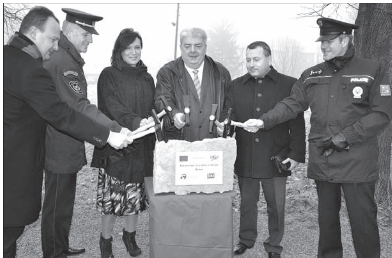
Budowę zainaugurowali przedstawiciele władz wojewódzkich i miejskich oraz służb ratowniczych.

Wczoraj rozpoczęła się oficjalnie budowa Zintegrowanego Centrum Ratownictwa w Trzyńcu przy ul. Frydeckiej. Zawodowa straż pożarna, policja oraz Straż Miejska już w przyszłym roku wprowadzą się do nowoczesnych pomieszczeń. Budynek o trzech kondygnacjach, wyposażony w garaże, wieżę do ćwiczeń strażackich oraz salę gimnastyczną rozwiąże nieodpowiednie warunki, w jakich obecnie pracują służby ratownicze w regionie trzynieckim. Częścią kompleksu będzie również boisko wielofunkcyjne oraz bieżnia. – Wszystkie służby wchodzące w skład Zintegrowanego Systemu Ratownictwa mają obecnie swe siedziby w centrum Trzyńca. Nowe Centrum