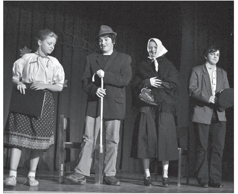
Na scenie grupa z polskiej podstawówki w Jabłonkowie.