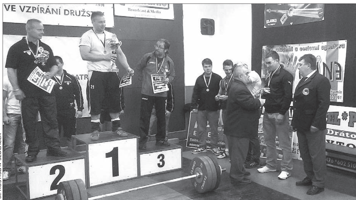
Dekoracja najlepszych w finale rozegranym w Boguminie.