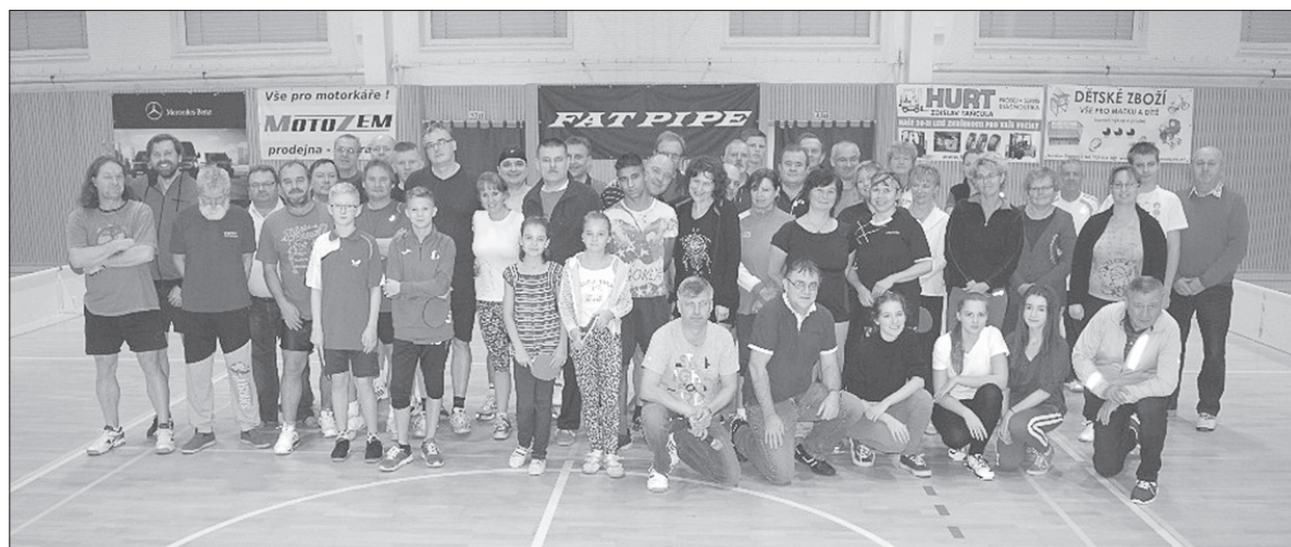
Wspólne zdjęcie uczestników turnieju.