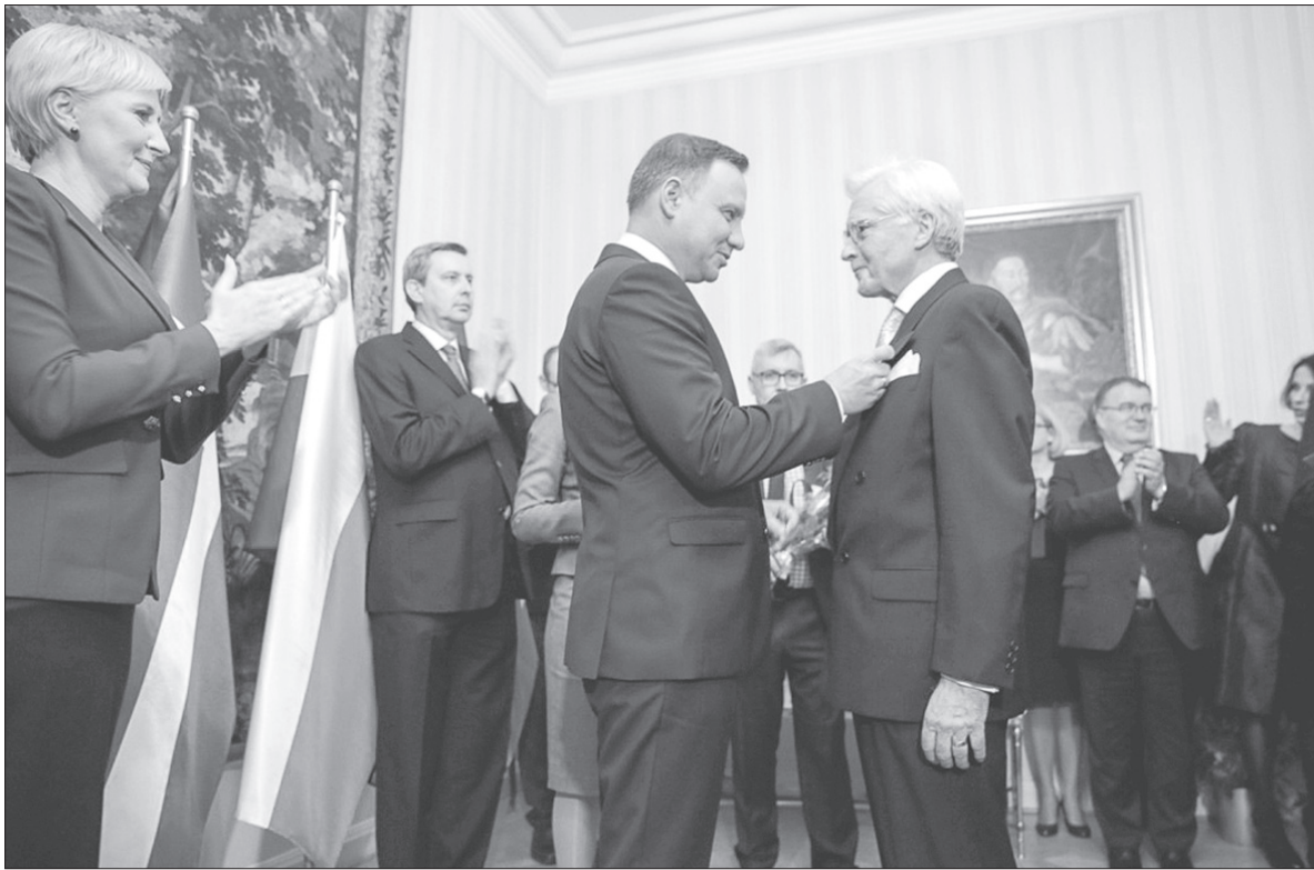
Andrzej Duda wręczył w ambasadzie wysokie polskie odznaczenia.

Prezydent podziękował działaczom polonijnym „za pamięć o rodakach w kraju w trudnych czasach, kiedy ze Szwecji do Polski szła pomoc, którą państwo organizowaliście, także pomoc medyczną. Za dbanie o polską rację stanu, za dbanie o to, by