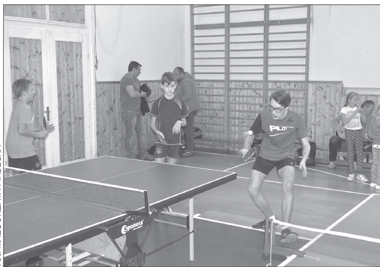
Turniej odbył się w sali gimnastycznej PSP w Czeskim Cieszynie.

Do sztandarowych imprez należy tradycyjny turniej uczniów polskich szkół podstawowych w tenisie stołowym. Sekcja sportowa PTTS „Beskid Śląski” tegoroczny turniej zorganizowała w minioną sobotę w sali gimnastycznej PSP w Czeskim Cieszynie, dokąd zjechało się niespełna trzydziestu zawodników reprezentujących szkoły w Bystrzycy, Gnojniku, Karwinie i Czeskim Cieszynie. – Niestety w ostatniej chwili z przyjazdu zrezygnowali zawodnicy z PSP w Lutyni Dolnej. A szkoda, bo wiem, że w tamtejszej szkole tenis stołowy cieszy się dużą popularnością, a podopieczni nauczyciela Zbyszka Letochy regularnie walczyli na naszym turnieju o najwyższe laury – powiedział „GL” Henryk Cieślak, wiceprezes PTTS „Beskid Śląski”, szef sekcji sportowej. – Marzy