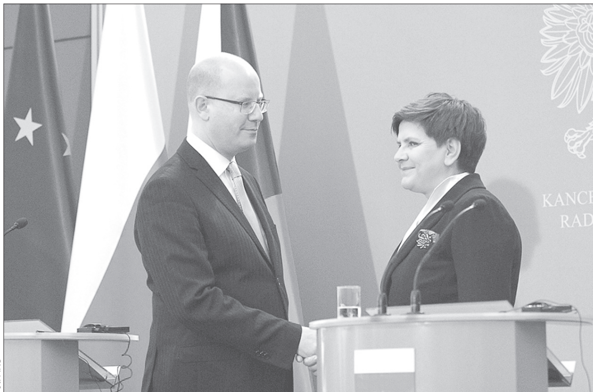
Premierzy RC i Polski, Bohuslav Sobotka i Beata Szydło, spotkają się w Wiśle i Czeskim Cieszynie.

W październiku 2008 r. prezydent Václav Klaus spotkał się z prezydentem Lechem Kaczyńskim także w Czeskim Cieszynie. – Doskonale pamiętam to wydarzenie. Prezydenci rozmawiali wówczas w ratuszu,