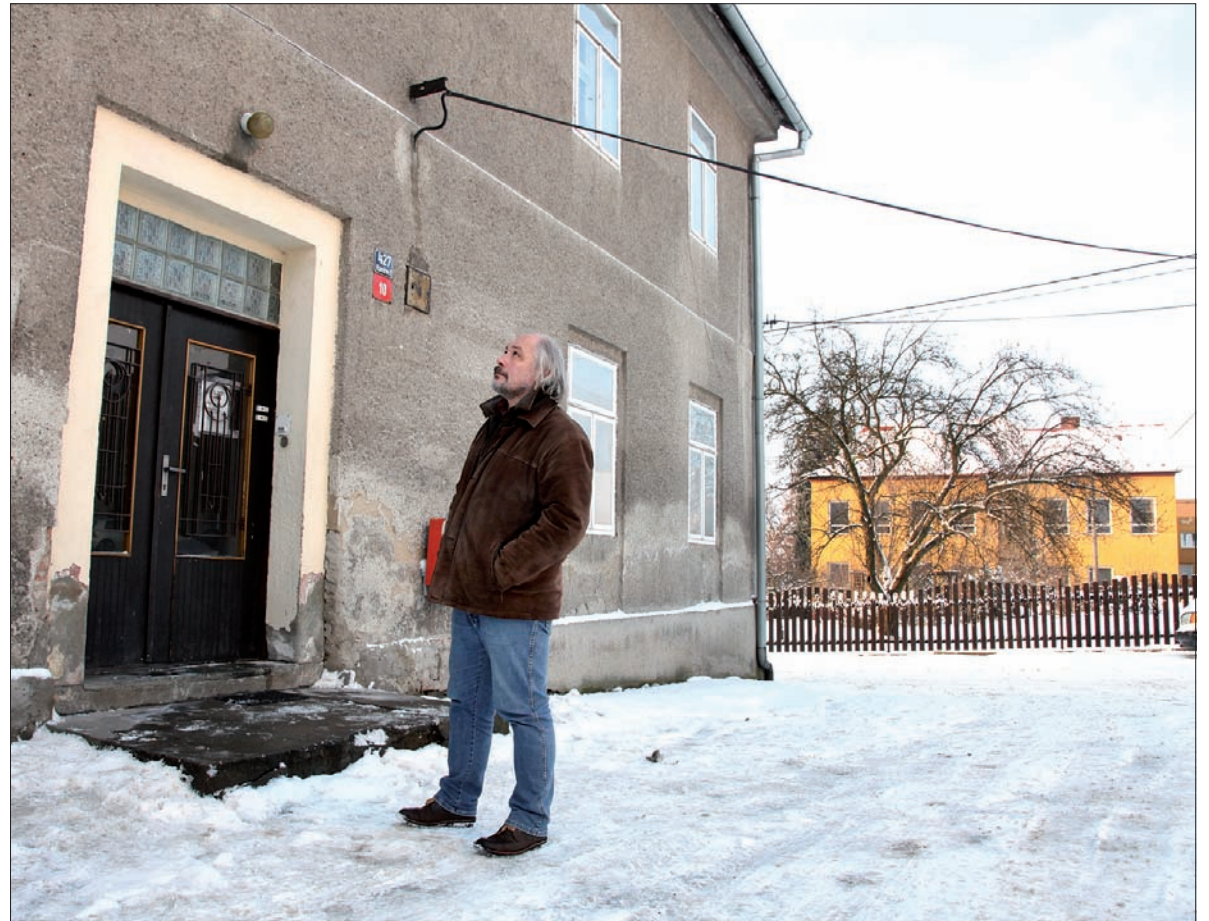
Przed budynkiem byłej biblioteki gminnej w Błędowicach. Na drugim planie budynek błędowickiej podstawówki.

Zatrzymujemy się samochodem w Datyniach Dolnych na pagórku zwanym Hekerszczok. To od rodzi-