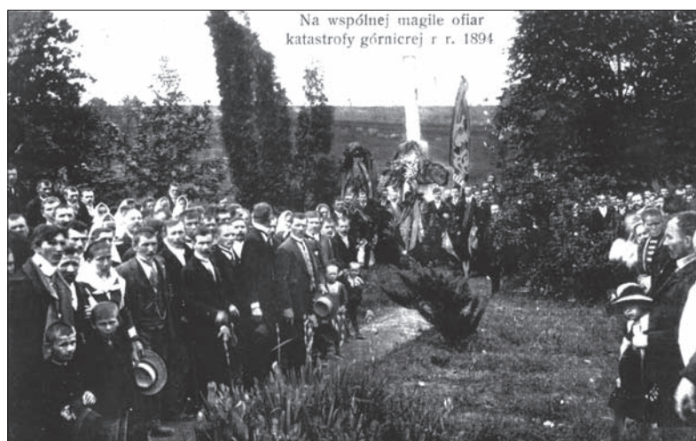
Okolicznościowa pocztówka z uroczystości przy zbiorowej mogile.