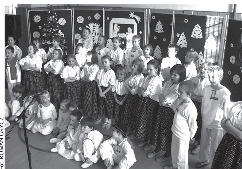
Występ „Ondraszków” zachwyił wszystkich.