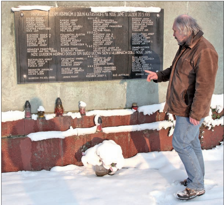
Na pamiątkę górnikom, którzy zginęli w katastrofie w 1919 roku.