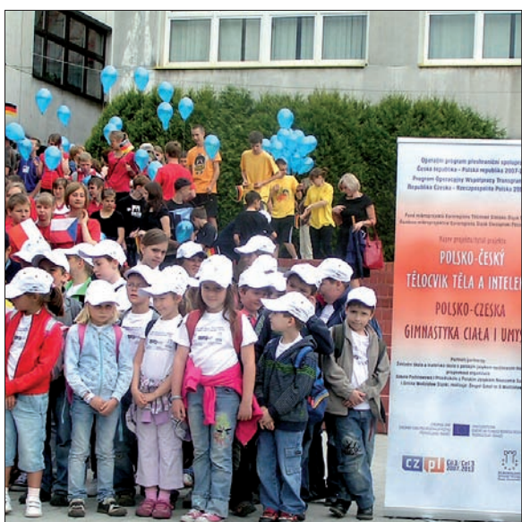
Uczestnicy spotkania w Wodzisławiu Śląskim.

Projekt realizowano za pośrednictwem stowarzyszenia Regionální sdružení územní spolupráce Těšínského Slezska (RSTS).