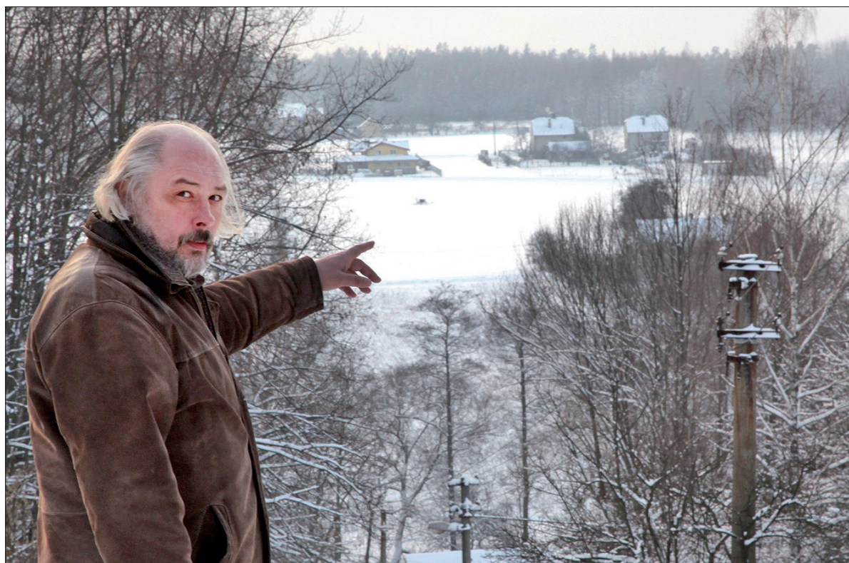
W tym miejscu podczas II wojny światowej prowadziła granica między III Rzeszą a Protektoratem Czech i Moraw.

dziadka, które zakupił w latach 30. ubiegłego wieku. Kiedyś Datynie były wsią, w której mieszkało wielu garncarzy. Tutejsza glina ma specyficzne walory ceramiczne.