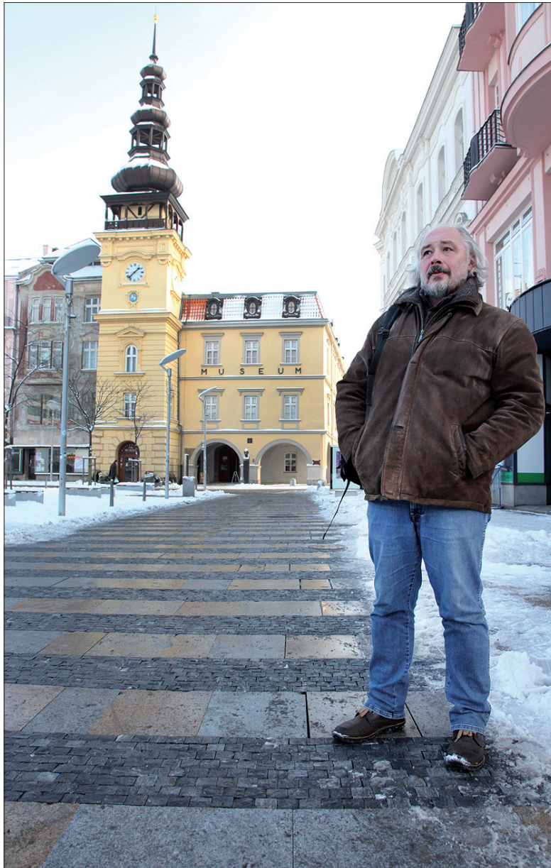
Zabytkowy ratusz z napisem Muzeum.

– To stary ratusz, który był siedzibą władz Ostrawy do lat 20. ubiegłego wieku – wyjaśnia Klimsza. – To tu kiedyś, jeszcze za czasów Monarchii Austro-Węgierskiej, były tzw. Lau-