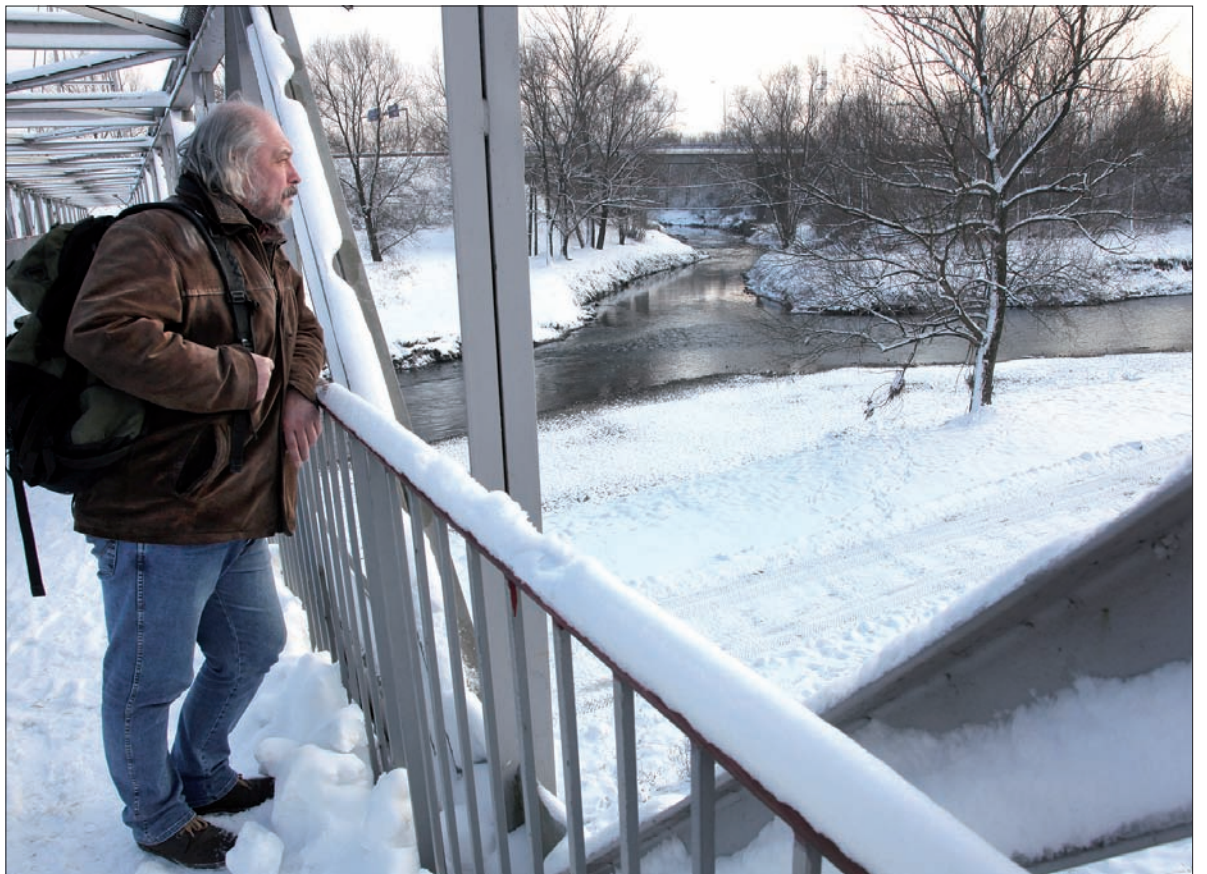
W miejscu, gdzie Łucyna wpada do Ostrawicy.