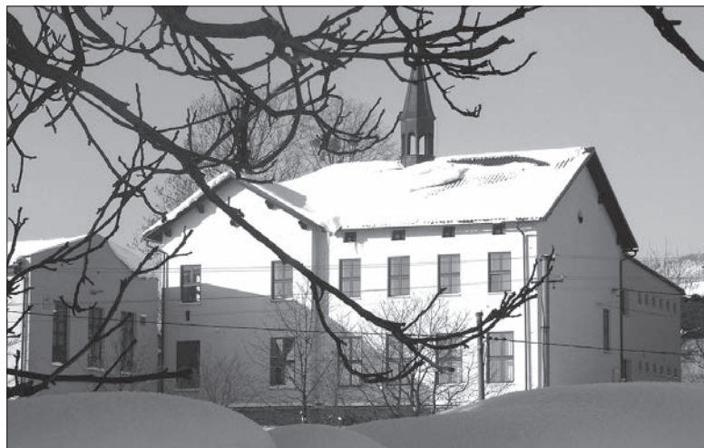
Znakiem rozpoznawczym szkoły jest wieżyczka z krzyżem.