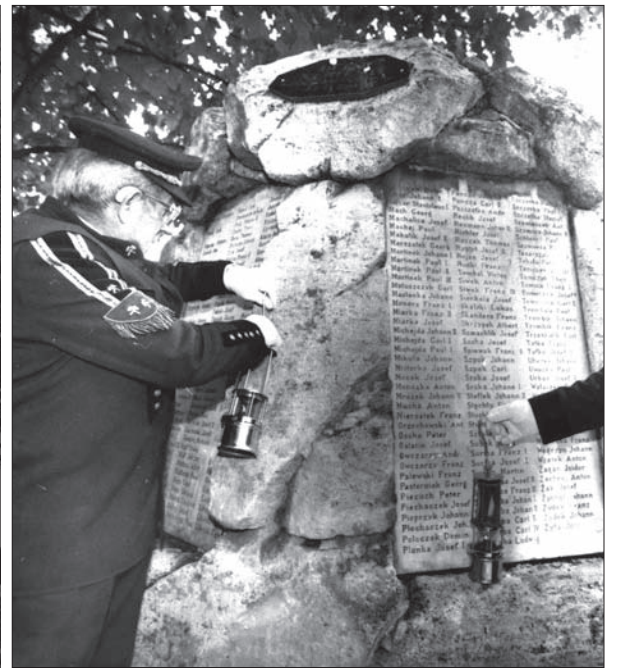
W stulecie tragedii w kościele pw. św. Piotra w Alkantary odbyła się uroczysta msza, a następnie orszak wyruszył pod pomnik na karwiński cmentarz.

Położenie w Karwinie dotąd niezmiennione. Szyby dotąd jeszcze są zapchane i zamurowane, tak że powietrze nie ma żadnego przystępu. Obecnie badają gazy w kopalni najnowszymi przyrządami, czy i kiedy będzie można otworzyć kopalnię. Właściwe rozmiary nieszczęsnej katastrofy okażą się później dopiero, gdy po zupełnym stłumieniu ognia w szybach będzie można przystąpić do wydobycia olbrzymiej cyfry ofiar, z pewnością już zupełnie zgłonych.