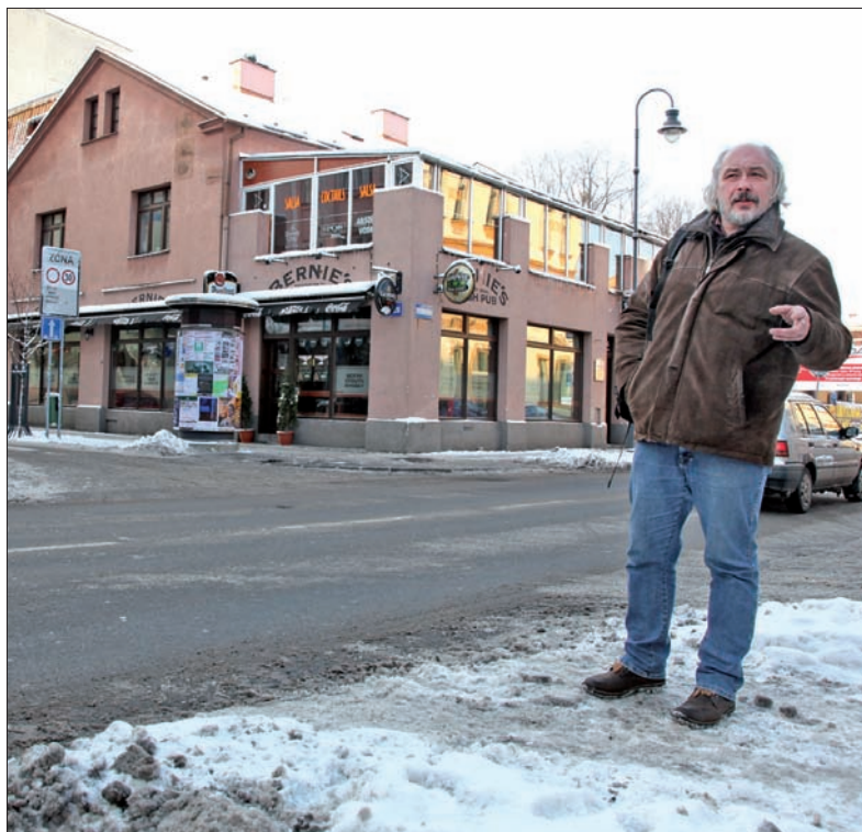
Tu mieścił się kiedyś antykwariat „Černý pavouk”.

Pierwszym przystankiem na naszym spacerze jest sławna w całej Republice Czeskiej, a także w Polsce, ulica Stodolní. Nazwano ją tak, bo kiedyś właśnie w tym miejscu stały stodoły, spichlerze miejskie. Przed kilku laty ulicę odnowiono i powstało tu kilkadziesiąt klubów, barów... Stoimy przy jednym z pubów w stylu irlandzkim.