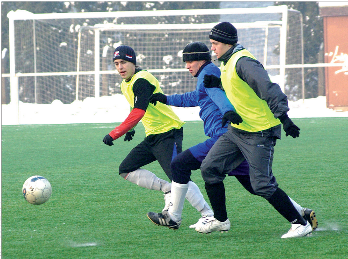
Zimowe sparingi piłkarskie w naszej szerokości geograficznej przypominają raczej sporty ekstremalne.