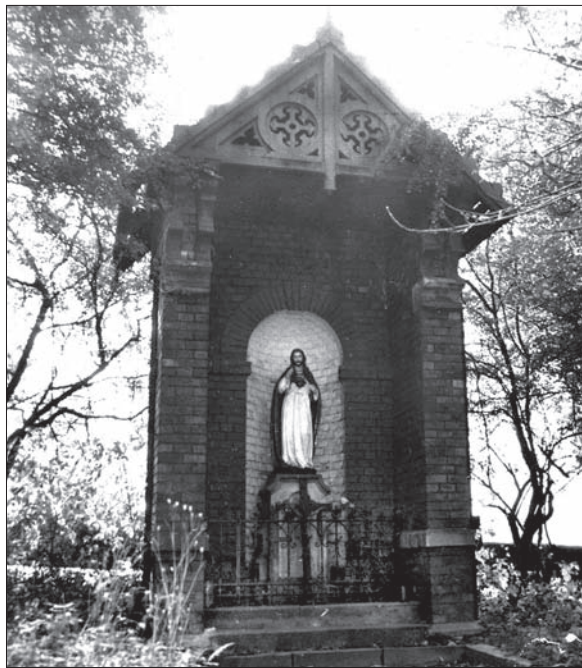
Kapliczka wybudowana nad miejscem podziemnego wybuchu. Stan przed dewastacją, kiedy to rozbito figurę Chrystusa i zniszczono część drewnianej obudowy.

Częste te eksplozje spowodowały pożar kopalni. Gęste kłęby czarnego dymu wychodzące z szybów dowodziły, że ogień objął kopalnię. Zarząd kopalni zamurował i zapchał więc dostęp do kopalni, aby pożar uduścis, co się prawdopodobnie już udało, bo takie wiadomości nadchodzą z Karwinie. 16 ofiar katastrofy pochowano na cmentarzu kat. w Karwinie, a 4 na ewangelickim w Orłowej, dwóch pochowano też na kat. cmentarzu w Cieszynie, ponieważ zmarli w szpitalu w Cieszynie. Nie trzeba dodawać, że biedne wdowy i sieroty, rodzice