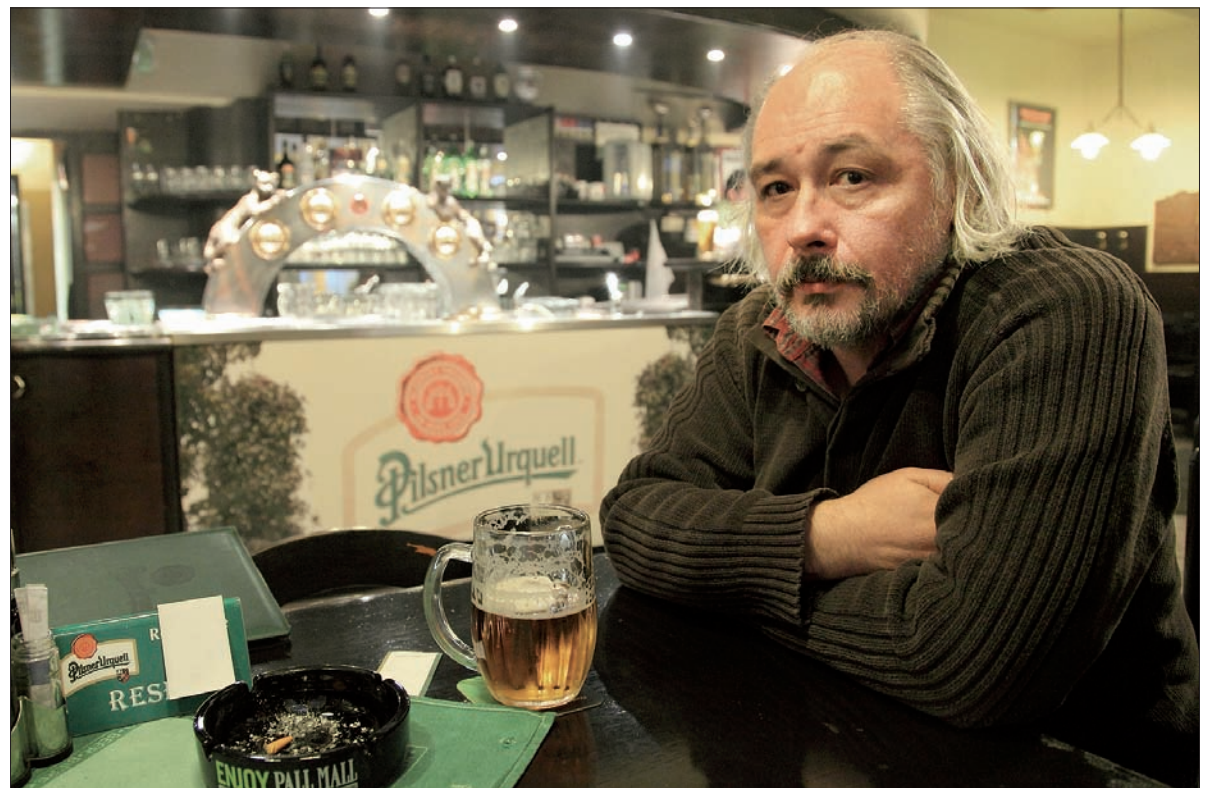
Ostatni akt spaceru – kufel piłzeńskiego piwa „U Rady”.

Ostrawy. Wyłączam dyktafon. Później wyciągnę go w ostrawskiej restauracji „U Rady”, gdzie mamy zakończyć nasz spacer.