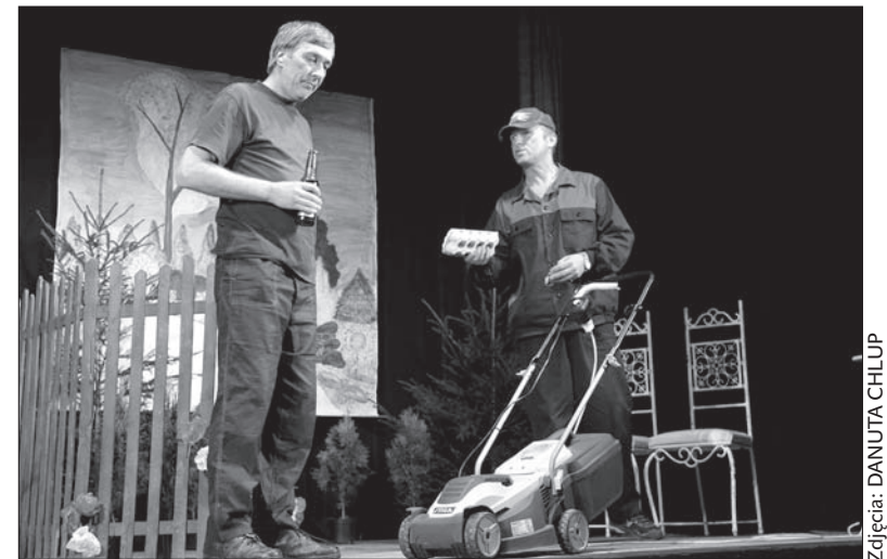
Lepiej hodować króliki i kury czy mieć ogródek z tujami?

tu, na zaolziańskiej ziemi, już dużo wcześniej i jestem absolutnym wielbicielem tego rodzaju formy artystycznej uprawianej tutaj. Teatry są bardzo różne, prezentują różnorodny repertuar, często w znakomity, satyryczno-krytyczno-zabawny sposób pokazują rzeczywiste sytuacje rodzinne czy zawodowe – powiedziała konsul w rozmowie z „Głosem Ludu”.