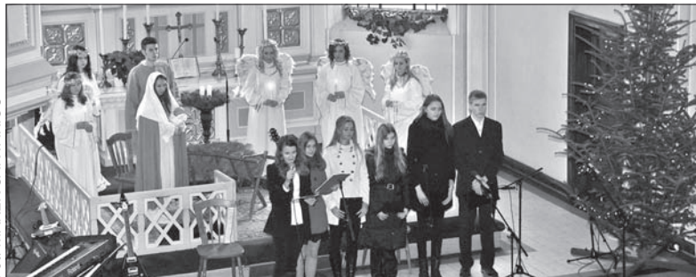
Zeszlazoroczny Koncert Świąteczny w kościele Na Niwach.

Koncertowi będzie towarzyszyć mini-jarmark świąteczny, na którym „Olza” zaoferuje m.in. swoje tradycyjne pierniczki. Udział zapowiedziały też pozostałe zespoły. (sch)