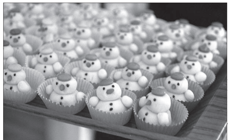
Kto jeszcze nie rozpoczął pieczenia ciasteczek, najwyższa pora... Do świąt Bożego Narodzenia zostało coraz mniej czasu.