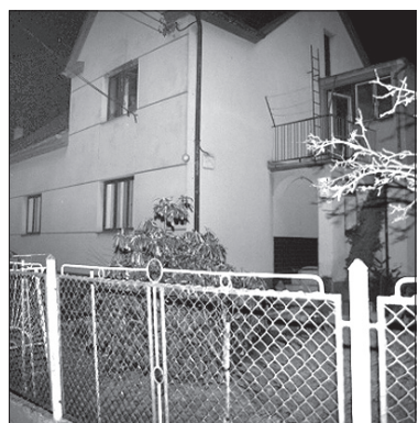
W tym domu w Starým Mieście zginął mężczyzna.

Tragicznie zakończył się niedzielny pożar domu jednorodzinnego w Karwinie-Starym Mieście przy ul. Lešetinskiej. Strażacy, gasząc ogień, znaleźli martwą osobę. Straż Pożarna została zaalarmowana ok. godz. 18.30. Do pożaru wyjechali strażacy