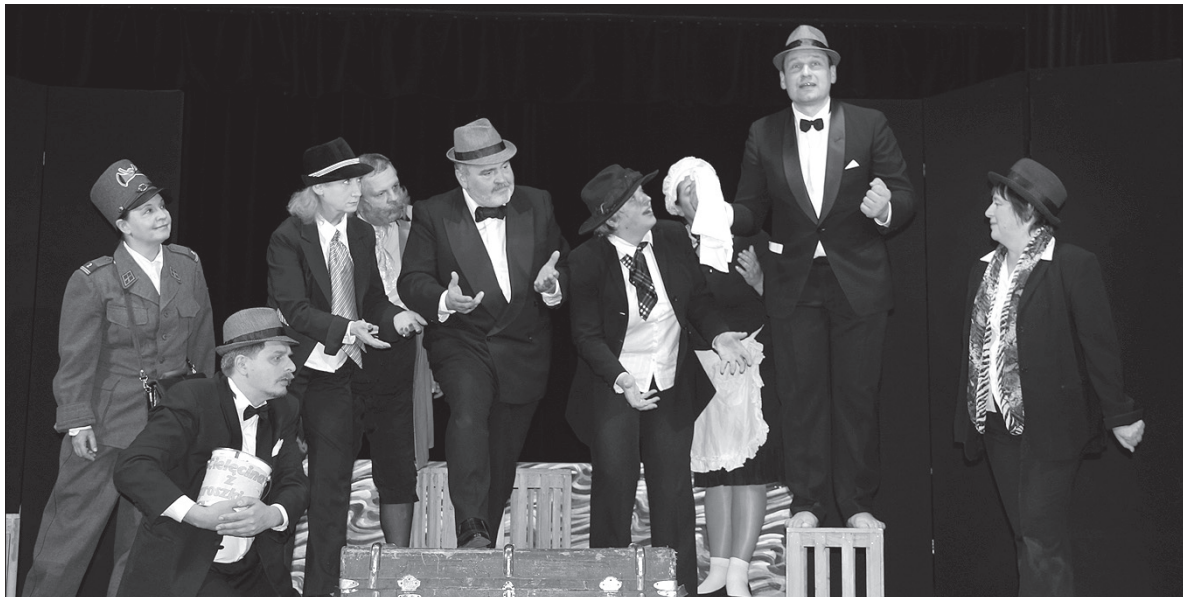
Aktorzy ze Lwowa pokazali swe umiejętności w sztuce „Na pełnym morzu” Sławomira Mrożka.