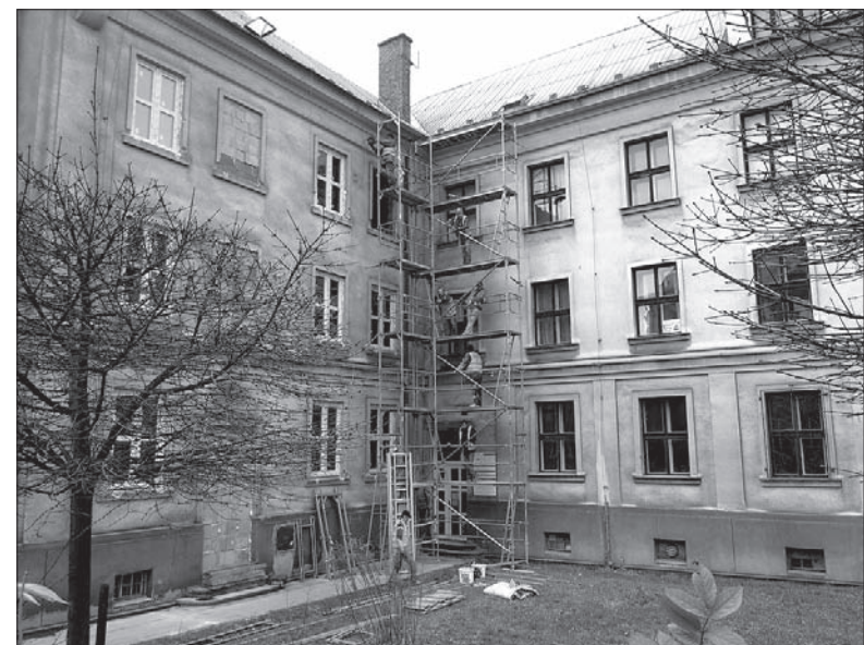
Przed dwiema wejściowymi wyrosło rusztowanie.

Wczoraj uczestnicząca w śledztwie Policja RC miała już dokładniejsze informacje. – Po ugaszeniu pożaru znaleziono bez oznak życia 53-letniego mężczyznę. Prawdopodobną przyczyną pożaru był niedopałek papierosa – powiedział inspektor Miroslav Koláček z karwińskiej policji. (dc)