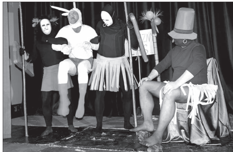
„Wspaniali mężczyźni” z Kościełca wcielił się w bohaterów „Koziołka Matołka”.