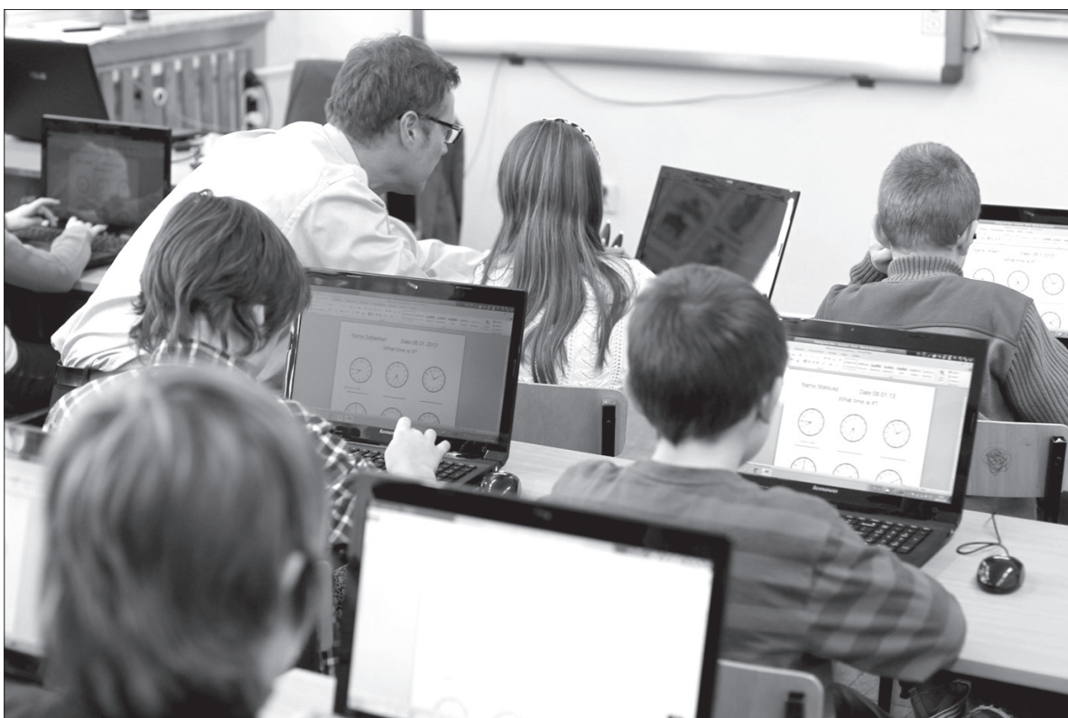
Nauka języków obcych, w tym przypadku angielskiego, to standard w wielu krajach świata.

Co tak naprawdę oznacza wielojęzyczność? – To zależy od szerokości geograficznej. Można to pokazać na przykładzie Europy, gdzie im bardziej na zachód, tym bardziej liberalnie podchodzi się do dwu- i wielojęzyczności. Na przykład Hiszpan, który potrafi się porozumieć po angielsku na poziomie podstawowym, uważa się za osobę dwujęzyczną, natomiast moi studenci w Polsce, którzy mówią biegle po