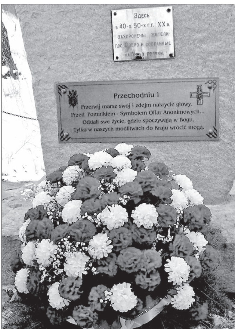
Pomnik-mogila Polskich Zesłańców.