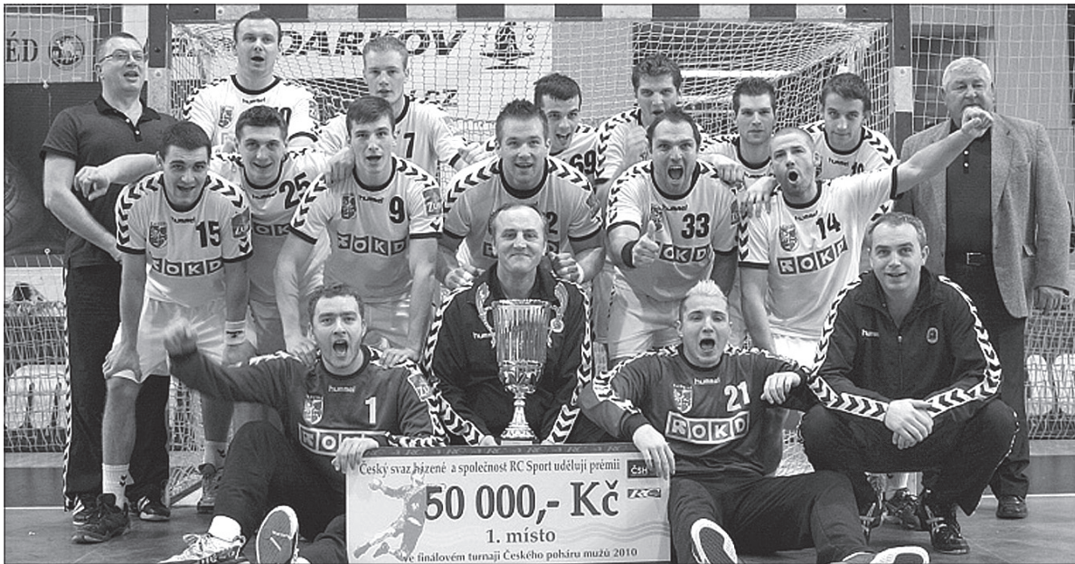
Puchar RC dla Banika Karwina.

Banik wygrał zasłużenie – stwierdził trener Zubrzy, Jiří Míka. – Karwiniacy dysponują szerszą ławką. Nam z powodu kontuzji zabrakło kilku etatowych zawodników – dodał Míka. JANUSZ BITTMAR