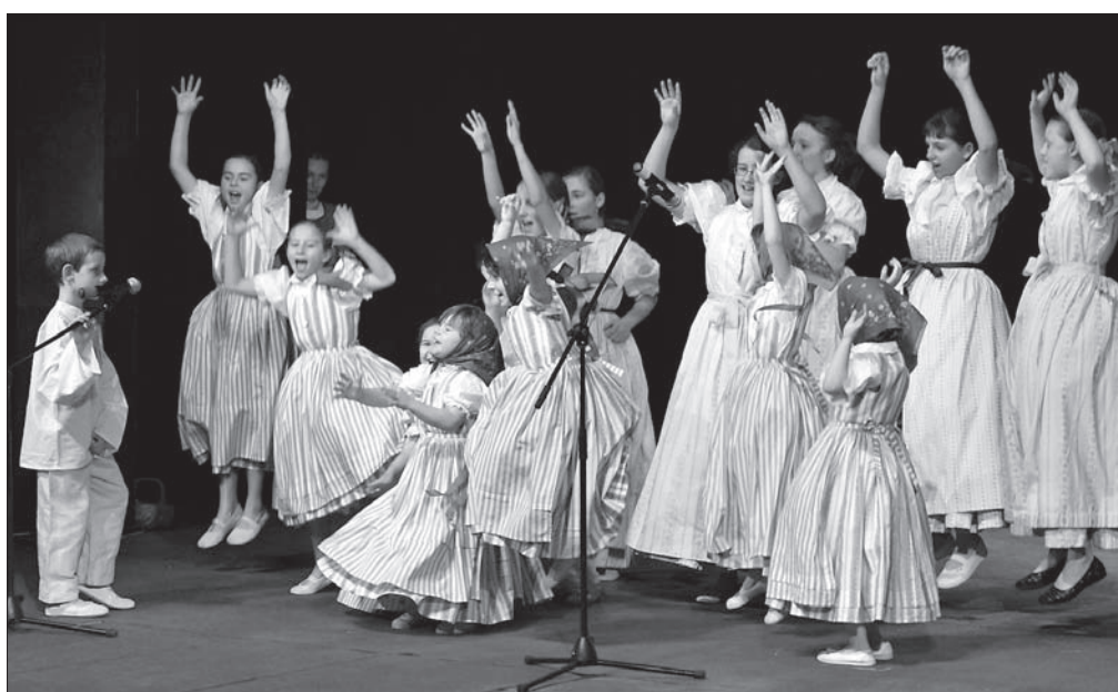
„Skotnica” i „Skotniczka” prezentowały folklor dolański.