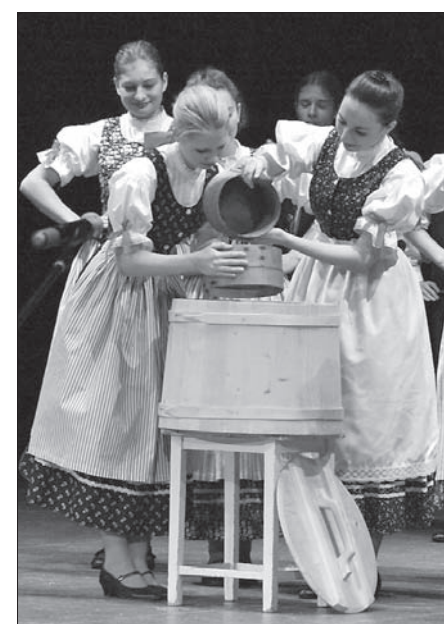
„Błędowice” piekły chleb...