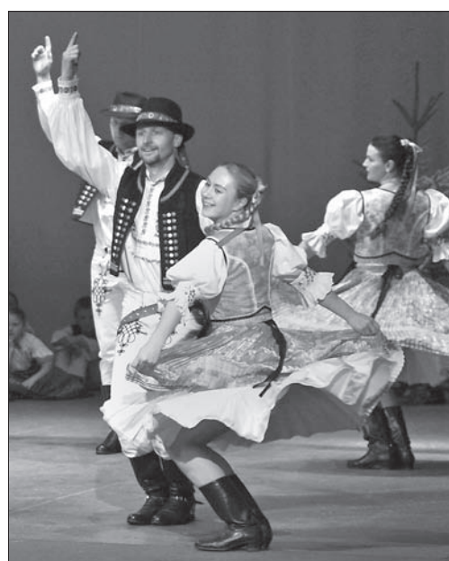
„Zaolzi” zatańczyło tym razem po słowacku.