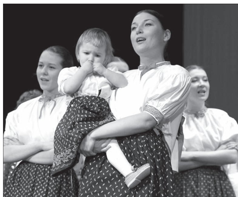
„Bystrzyca” kolędowała wspólnie z dziecięcą „Łączką”.