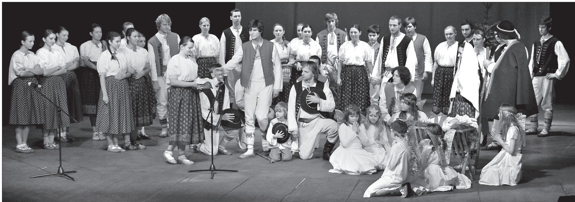
Zespół Regionalny „Oldrzychowice” przyjechał do Domu Kultury „Trisia” w Trzyńcu z widowiskiem „Jasełka”.