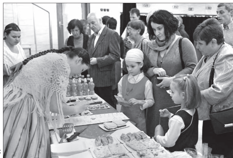
Koncertowi Świętecznemu towarzyszył tradycyjnie jarmark.