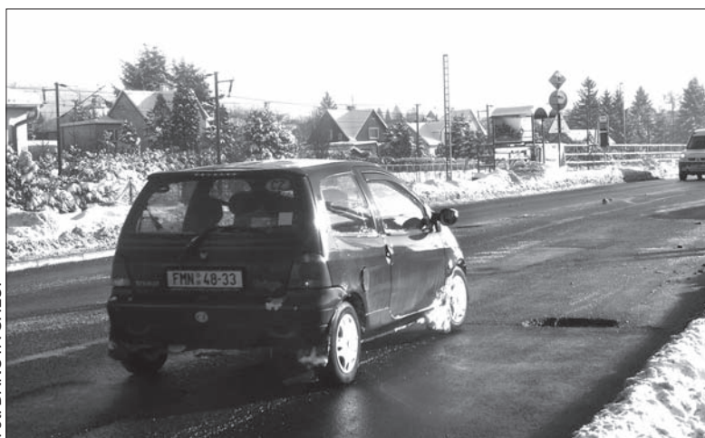
W Wędryni droga I/11 pełna jest dziur.

Ledwo spadł pierwszy śnieg i uderzyły pierwsze mrozy, a na drogach już pojawiły się dziury. Te na drodze wojewódzkiej I/11 między Czeskim Cieszynom a Jabłonkowem są w wielu miejscach pokaznych rozmiarów. Szczególnie w Wędryni, w centrum, tuż za przejściem dla pieszych, kierowców czeka „slalom” między dziurami. – Jeszcze w listopadzie, gdy była ładna pogoda, Zarząd Dróg Województwa Morawsko-Śląskiego położył nowy asfalt na odcinku drogi przed przejściem. Kawałek dalej jest dziura na dziurze, ledwo przyszły mrozy, już zaczęło ich przybywać – przyznaje