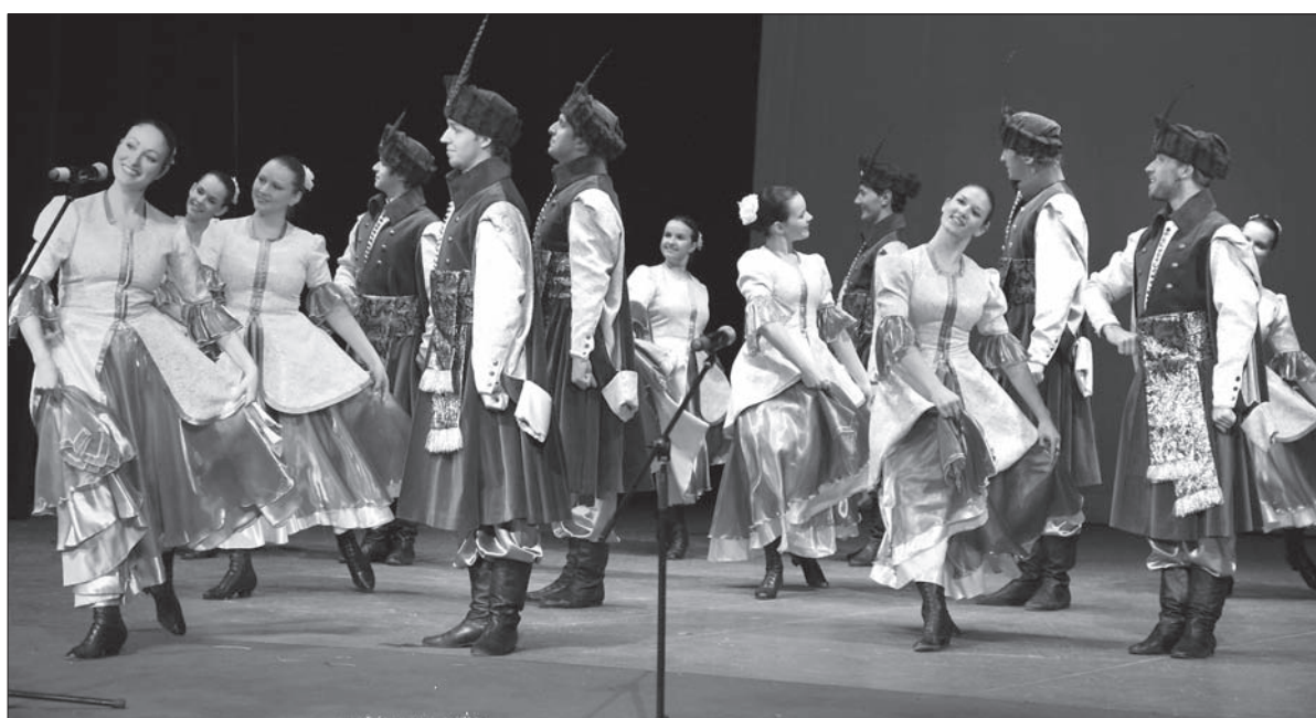
Kolędowanie po staropolsku, w kontuszach, czyli Zespół Reprezentacyjny ZG PZKO, „Olza”.