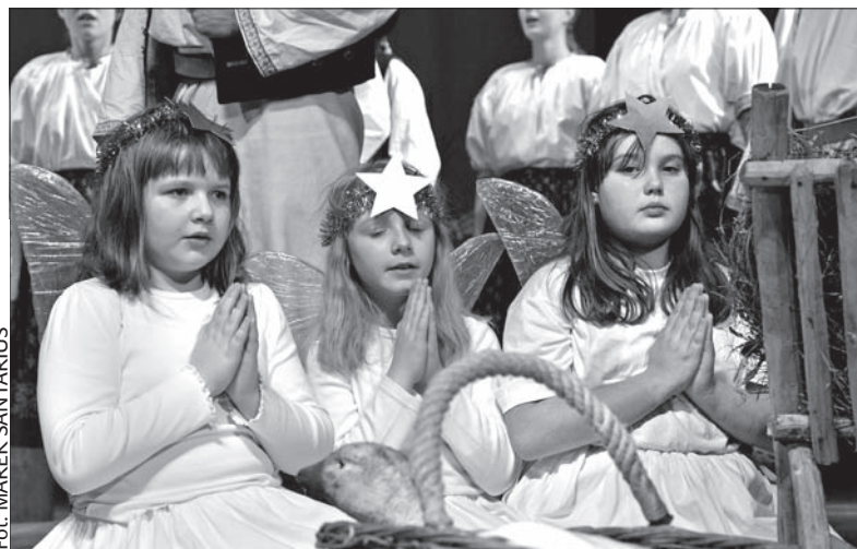
Zastęp aniołków w Domu Kultury „Trisia”.