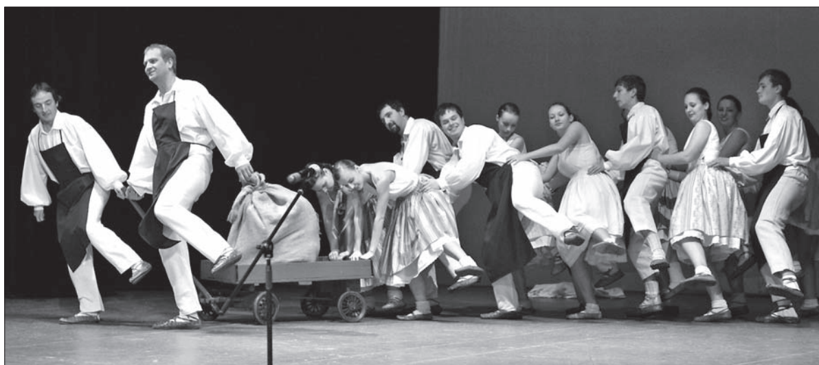
...„Suszenie” zaś melli mąkę.