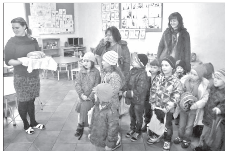
Przedszkolaki z Lesznej Dolnej z wizytą w Tychach w ramach projektu „Razem poznajemy euroregiony”.

kami zorganizowały warsztaty „Poznajemy Polskę, poznajemy Czechy”. Nasze dzieci dowiadywały się wielu ciekawych rzeczy o kraju nad Wisłą, natomiast przedszkolaki z Polski