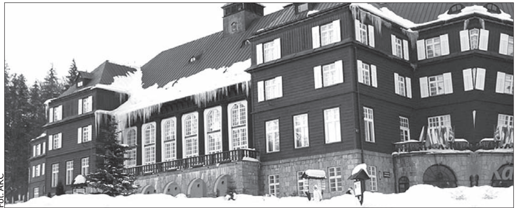
Zwrot majątków kościelnych może dotyczyć m.in. uzdrowiska Karlova Studánka.

Siwek zwrócił uwagę na fakt, że największą ilością majątków, których będą dotyczyły restytucje, zarządza przedsiębiorstwo państwowe Lasy RC oraz Fundusz Ziemi. – W obecnej fazie przygotowawczej analizujemy ustawę, ustalamy, jak należy rozumieć jej poszczególne części, dowiadujemy się, czego możemy oczekiwać od Kościoła. Chodzi o to, by uniknąć tych problemów, które da się wyeliminować już teraz, nim zacznie się realizacja ustawy – wyjaśnił dyrektor.