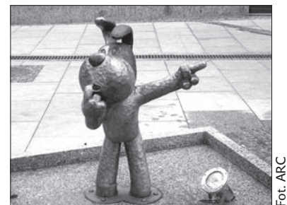
Pomnik Reksia w Bielsku-Białej.

Otokar Balczy był wielkim wielbicielem zabytkowych samochodów. Uczestniczył w rajdach tych pojazdów. Angażował się także w działalność społeczną. W latach 1998-2002 był bielskim radnym. (kor)