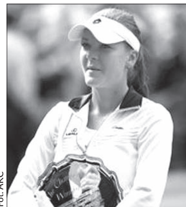
Agnieszka Radwańska ze srebrną tacą.

Polka wyrasta na jedną z faworytek olimpijskiego turnieju, tym bardziej, że tenis w igrzyskach odbędzie się na tych samych kortach w Wimbledonie. – Zawsze uważałam, że jeśli mam gdziekolwiek w Wielkim Szlemie osiągnąć finał, to właśnie tutaj, bo bardzo lubię trawę, choć z roku na rok jest coraz wolniejsza. Dlatego