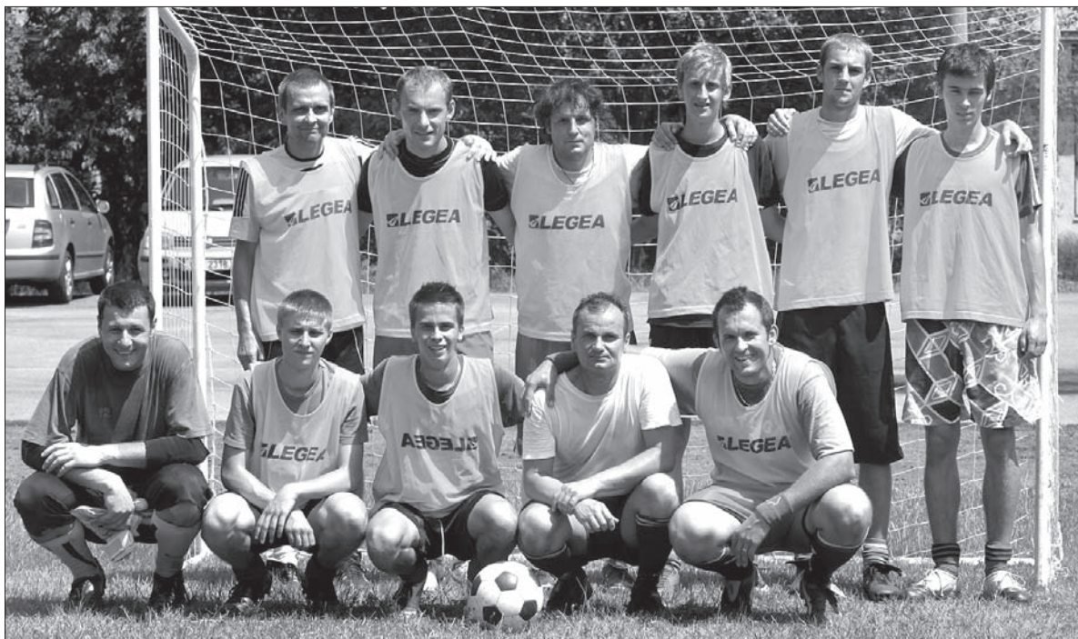
Zwycięska drużyna Pucharu Lata z Olbrachcic.

– My, dolanie, jesteśmy przyzwyczajeni do upałów. Niektórzy narzekali na mierny stan trawiastej murawy, ale nam grało się dobrze i jesteśmy zadowoleni z przebiegu turnieju. Wygraliśmy prawie wszystkie spotkania, ulegliśmy tylko Olbrachciom – podsumował najlepszy piłkarz tur-