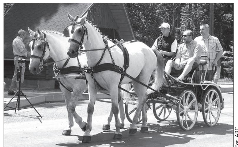
Furmani zmierzili siły w Łomnej Dolnej.

Podkreśla, że w imprezie biorą udział wszystkie stowarzyszenia obywatelskie. Dlatego Zawody Furmanów na pewno mają szansę na stałe wejść do kalendarium lokalnych imprez. Złazszcza że biorą w nich udział wszystkie działające we wsi organizacje społeczne, w tym Miejsce Koło Polskiego