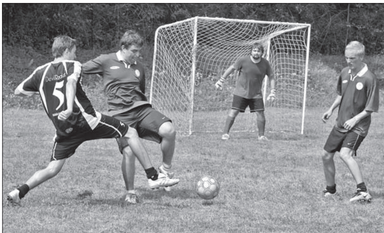
Spotkanie Karwiny z Leszną Dolną.