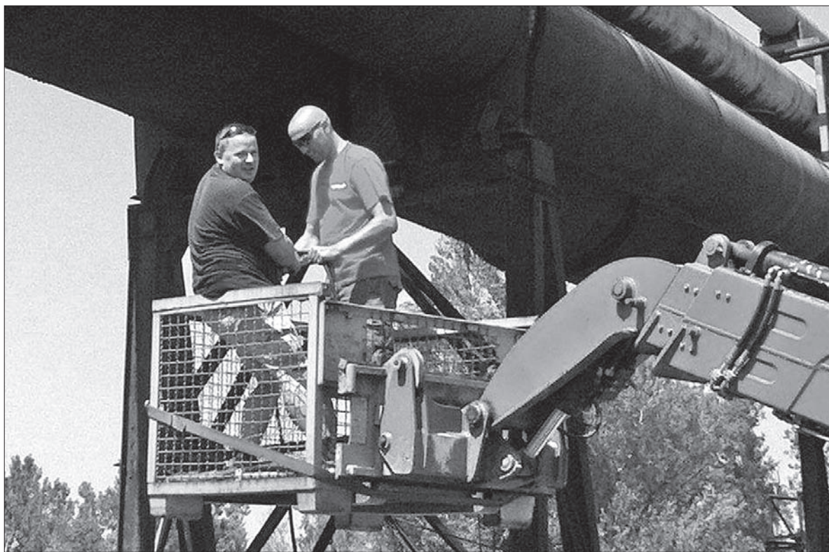
Ostatnie przygotowania do festiwalu.

Ciekawie zapowiadają się oczywiście też pozostałe koncerty w ramach Colours of Ostrava. Udział potwierdzili tacy artyści, jak Bobby McFerrin, Kronos Quartet, The Flaming Lips, Anthony and the Johnsons, polskich barw bronić będzie rockowo-punkowy projekt R.U.T.A. Koncerty potrwają do późnych godzin porannych, strefa festiwalowa usytuowana w Dolnych Witkowicach stwarza bowiem dodatkowe możliwości dla fanów i muzyków. Jeden z najciekawszych, naszym zdaniem, występów w tegorocznym festiwalu, koncert fenomenalnego libańskiego trębacza Ibrahima Maaloufa, rozpoczyna się dopiero o 1.00 (niedziela 15 lipca). W czwartek, w pierwszym dniu imprezy, zagra m.in. Rufus Wainwright (20.15),