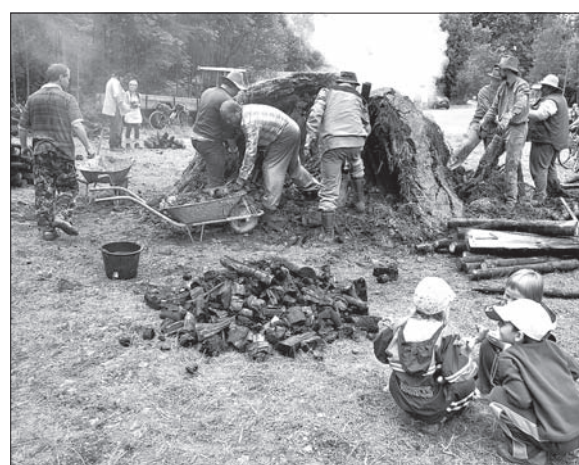
Mielerz płonął jak zawsze widowiskowo.

W „Dołku” w Koszarzyskach palił się od soboty 30 czerwca do niedzieli 8 lipca mielerz. W ramach imprezy, którą członkowie Ogniska Oddziału Górali Śląskich Związku Podhalan w Koszarzyskach organizują od lat, można było skorzystać z różnorodnych warsztatów związanych z kulturą ludową.