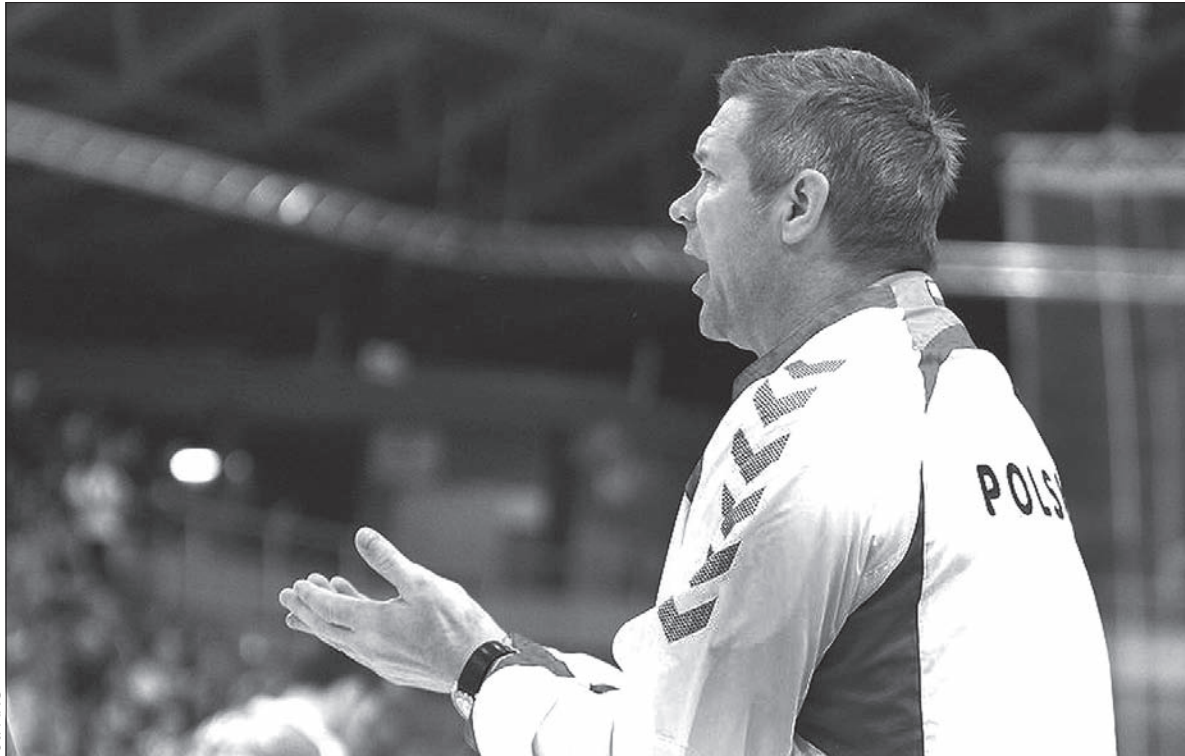
Bogdan Wenta – modlitwa o wiatr w żaglach.

Kto jest największym faworytem bukmacherów? Na pewno Francuzi, wysoko mierzą też gospodarze imprezy Szwedzi i Niemcy, ale w gronie pretendentów do złotego medalu znajdują się też Polacy. Przynajmniej tak twierdzi Niemiec Henning Fritz. – Polacy mają odpowiednich zawodników, by sięgnąć po złoto. To bardzo dojrzała drużyna, która w prawie niezmiennym gronie wiele przeżyła i dużo zdobyła. Nie przez przy-