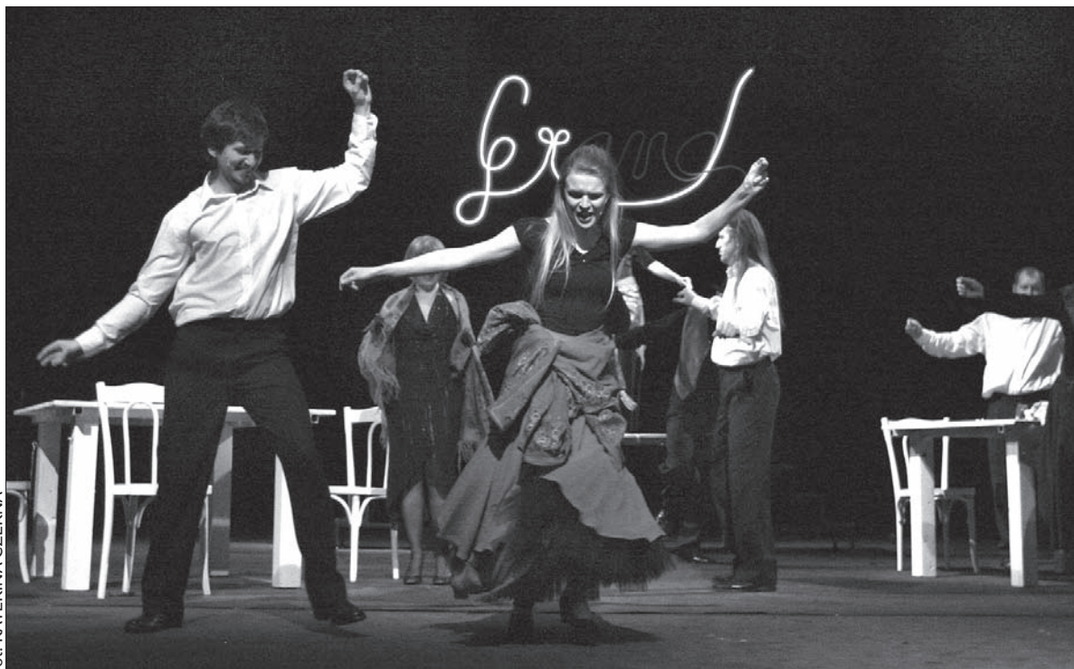
Spektakl muzyczny „Słodkie rodzyнки, gorzkie migdały” Scena Polska zagra po raz ostatni w niedzielę 23 stycznia.