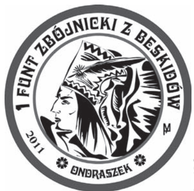
Na pewno warto mieć taką pamiątkę.

najstynniejszy beskidzki rozbójnik Ondraszek, natomiast rewers monety to mapa Beskidów oraz znane hasło: „Ondraszku, Ondraszku my som