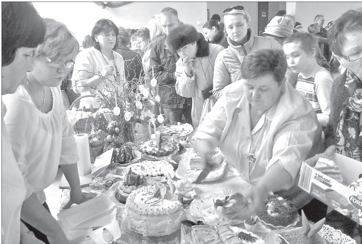
Stoły uginęły się pod ciężarem wielkanocnych potraw.

Kiedy w piątkowy wieczór w jednej z wiślańskich restauracji