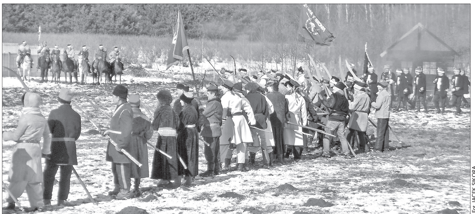
Z rekonstrukcji bitwy pod Grochowiskami sprzed 150 lat.

Bystrzycanie nie tylko oglądali rekonstrukcję bitwy sprzed 150 lat, ale spotkali się też z przedstawicielami władz miasta, na czele w burmistrzem Włodzimierzem