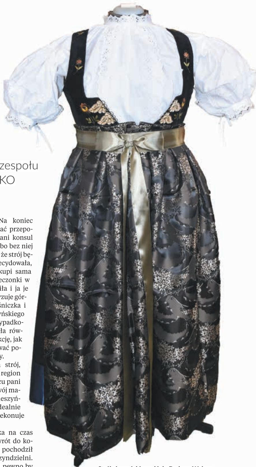
● Strój cieszyński spod igły Barbary Weiser.

– To będzie pamiątka na czas pracy tutaj, a także powrót do korzeni, bo mój dziadek pochodził niedaleko stąd, spod Szyndzielni. Widząc mnie w nim, na pewno by się ucieszył – mówi konsul. ▲