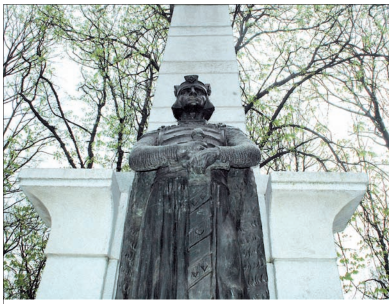
Jednym z głównych punktów trasy będzie pomnik Mieszka I w Łasku Miejskim. Cały przebieg trasy uczestnicy poznają dopiero w dniu rozpoczęcia gry.

W ramach imprezy odbędzie się również prezentacja dukata lokalnego. „7 Bolków” to pierwsza z serii trzech jubileuszowych monet z wizerunkami legendarnych założycieli Cieszyna. Następny dukat „7 Leszków” zaprezentowany zostanie 12 czerwca na Festiwalu Cieszyńskie Smaki, trzeci „7 Cieszków” ukaże się początkiem lipca na Festiwalu Kregi Sztuki. (gc)