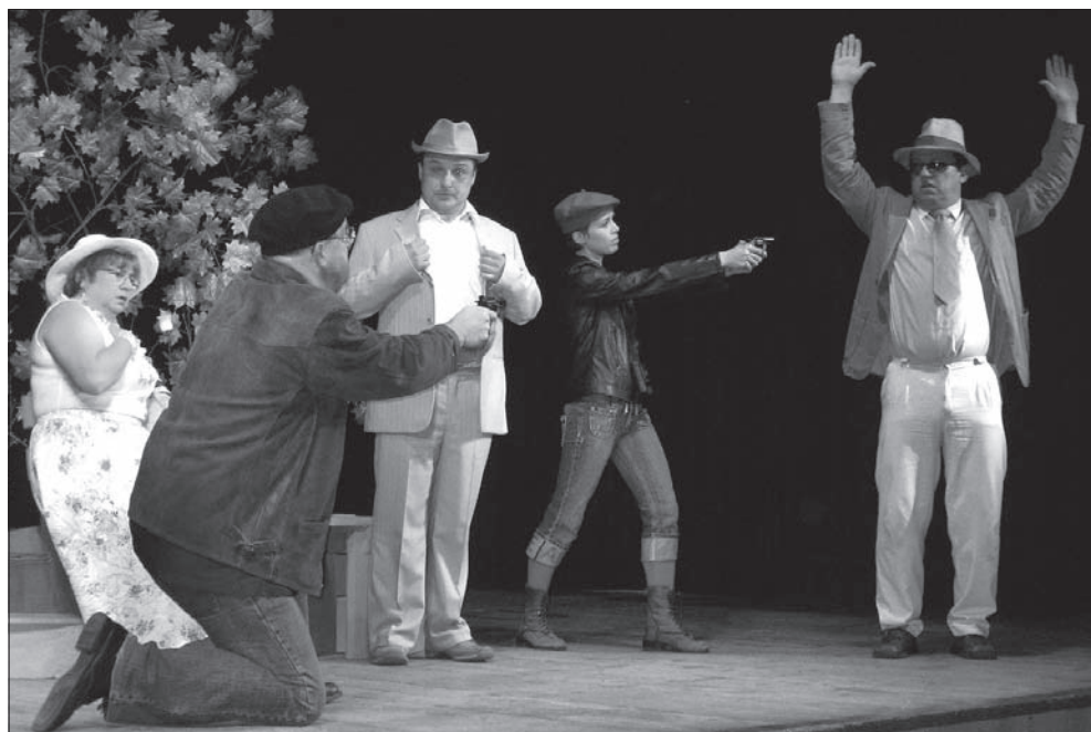
Scena zbiorowa z niedzielnego przedstawienia.