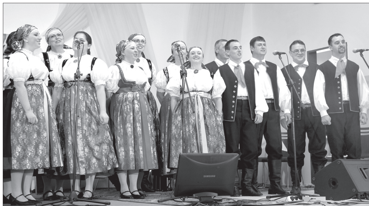
„Chórkowi” starczyło repertuaru na cały wieczór.