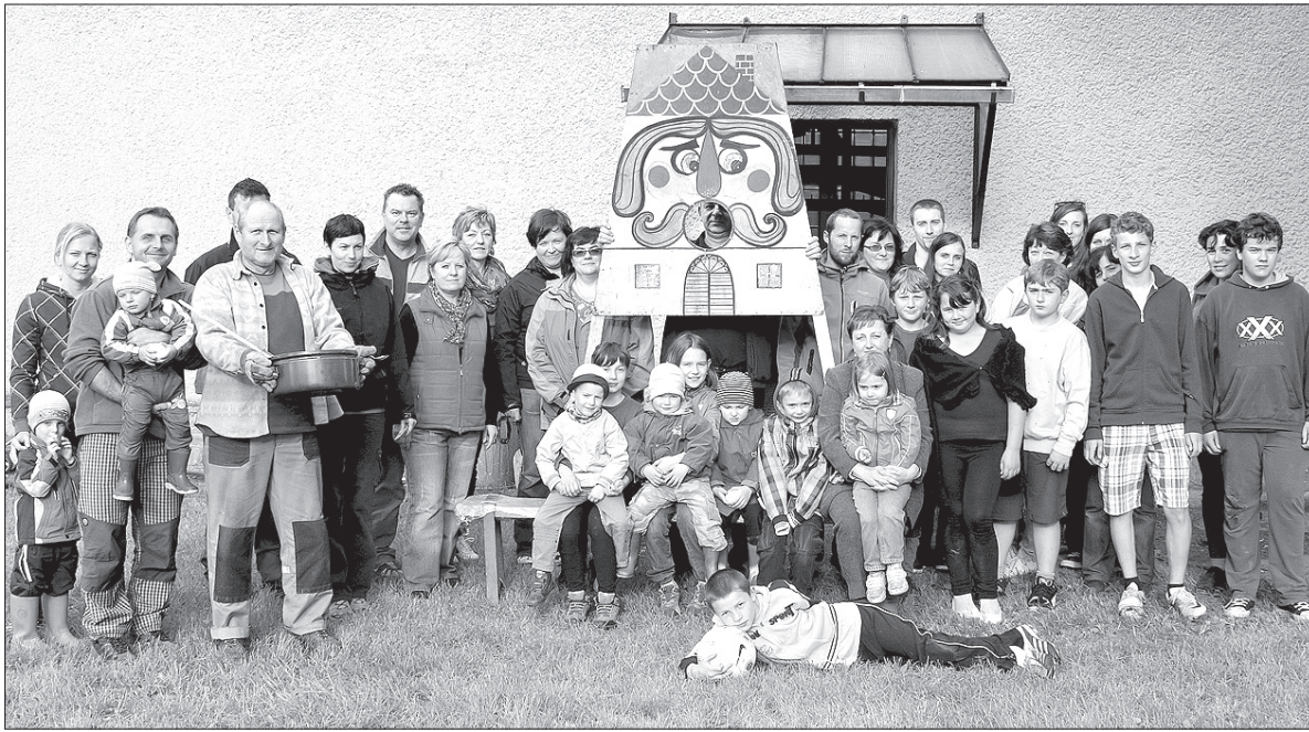
Na pamiątkę spotkania uczestnicy zrobili sobie wspólne zdjęcie.