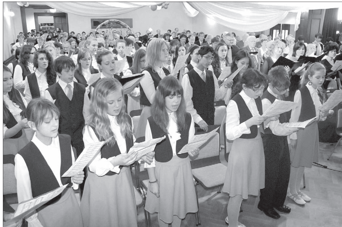
Wspólny śpiew wszystkich uczestniczących chórów.