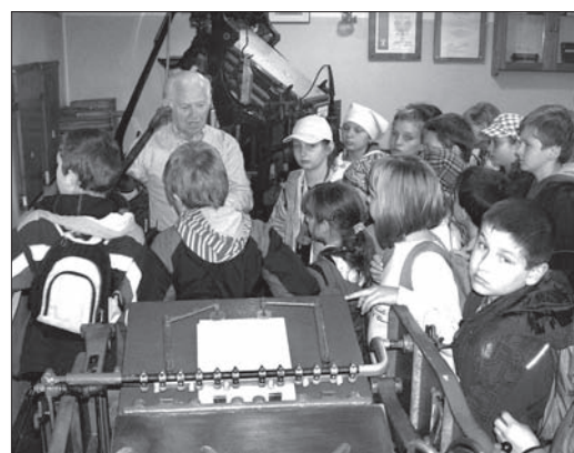
Zwiedzanie Muzeum Drukarstwa to duża frajda...

do 18.00. Będą to: Muzeum Drukarstwa (dzień otwarty), Archiwum Państwowe w Katowicach – oddział Cieszyn (wystawa najstarszych cieszyńskich dokumentów i ksiąg cechowych), Archiwum i Biblioteka Konwentu Zakonu Braci Miłosiernych (wystawa i pokaz technik introligatorskich), Biblioteka Miejska (wystawa i warsztaty dla dzieci),