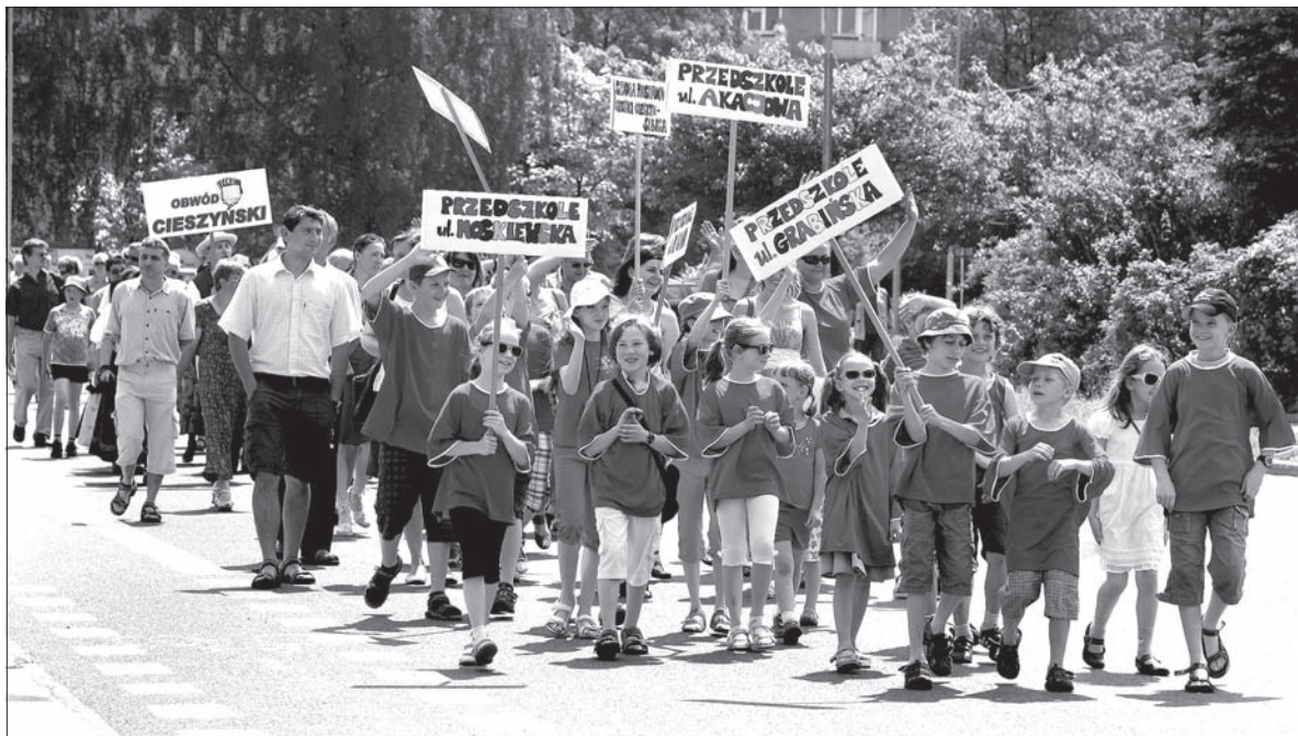
W festiwalowym korowodzie zaprezentowały się w sobotę w Trzyńcu w ramach swojego obwodu PZKO także wszystkie czeskokoczijskie polskie przedszkola.