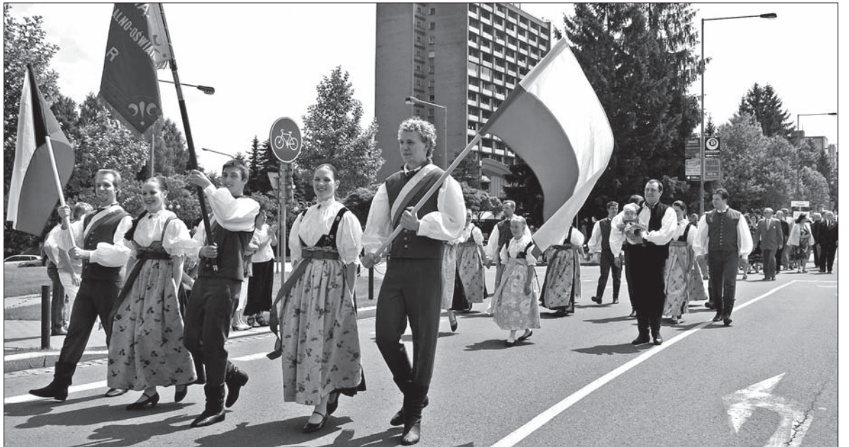
Poczet sztandarowy korowodu prezentował się pięknie i dostojnie.

Festiwal PZKO to sztandarowa impreza związkowa, prezentująca dorobek kulturalny tej największej w RC polskiej organizacji. Festiwal nawiązuje do centralnych imprez czolowych organizacji zaolziańskich odbywających się na Zaolziu w okresie międzywojennym w Parku Adama Sikory w Czeskim Cieszynie. Po utworzeniu w 1950 roku Zarządu Głównego PZKO władze Związku zaczęły urządzać w czeskokieszyńskim Parku Krajo-we Festyny PZKO. Po raz pierwszy festyn nazwano festiwalem w 1953