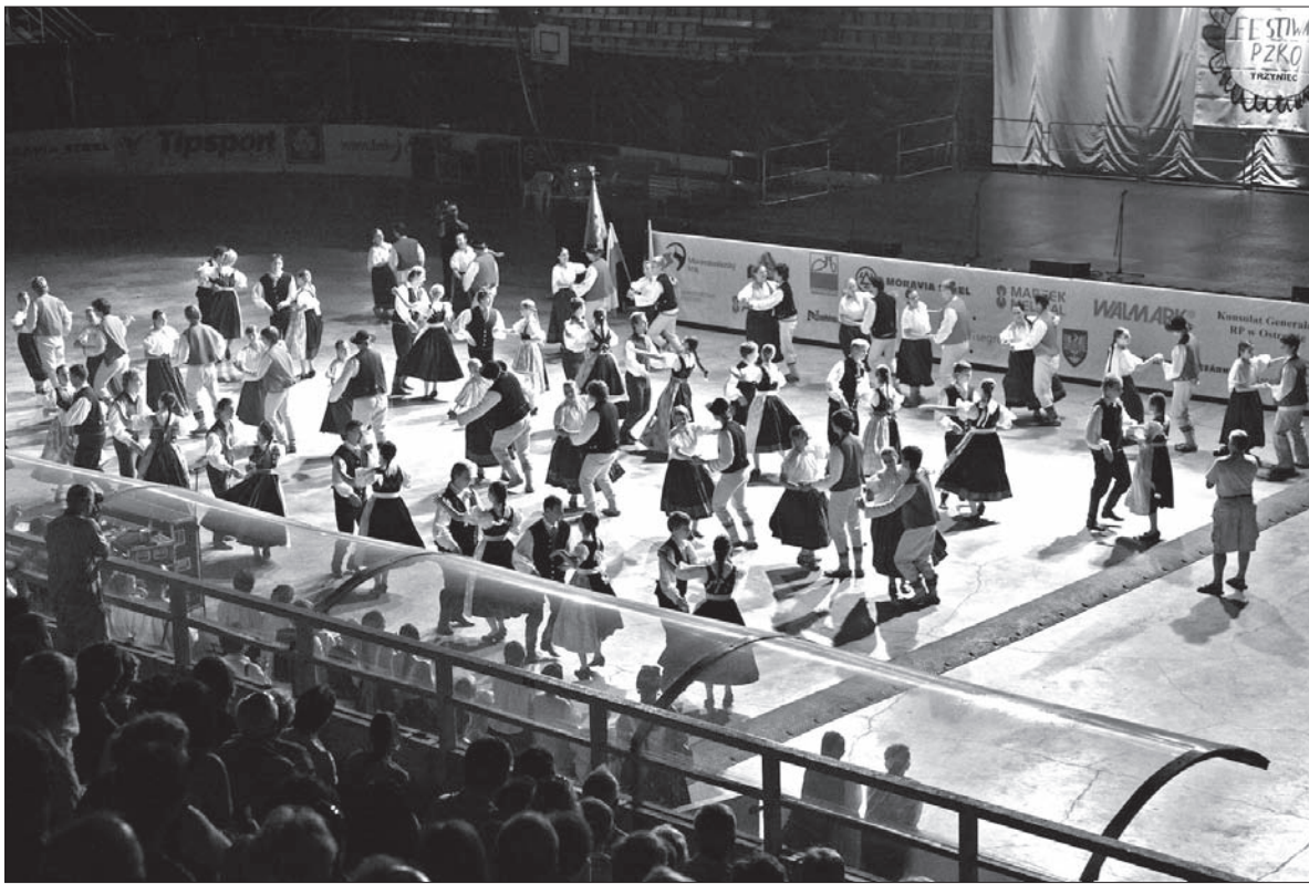
Zasiali górale... taniec.

ny Polski, RC i Unii Europejskiej, „Gaude Mater Polonia”, a także „Hymn III Tysiąclecia”, w którym solo zaśpiewał Klemens Słowiczek, a później inne pieśni, głównie ludowe.