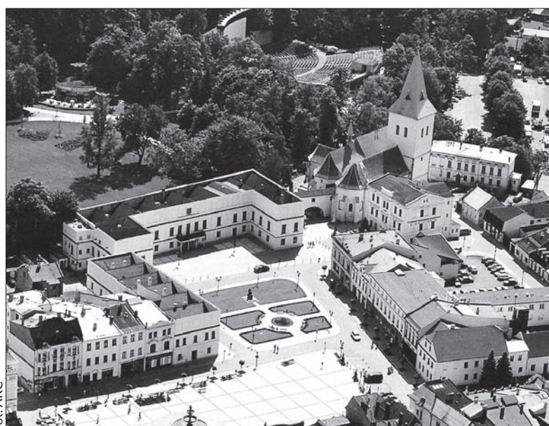
Centrum Frysztatu z zabytkowym kościołem parafialnym pw. Podwyższenia Krzyża Świętego