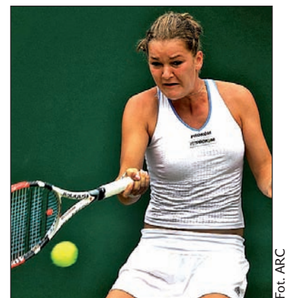
Starsza z sióstr Radwańskich, Agnieszka.

SIOSTRY RADWAŃSKIE W II RUNDZIE US OPEN. Agnieszka Radwańska i jej młodsza siostra Urszula pokonały swoje rywalki w wielkoszlemowym turnieju US Open, awansując do drugiej rundy turnieju. Rozstawiona z numerem dziewiątym Agnieszka Radwańska bez straty seta pokonała Hiszpankę Arantę Parę-Santonję 6:4, 6:3, zaś Urszula Radwańska uporała się z Rosjanką Anną Czakwetadze 6:3, 6:3. Agnieszka Radwańska w kolejnej fazie turnieju trafi na reprezentantkę Chin, Shuai