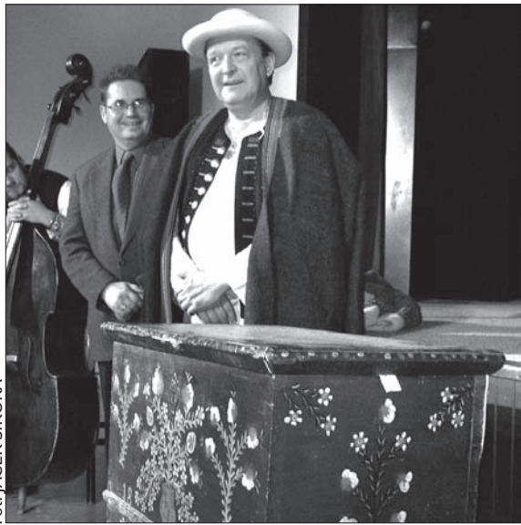
Cieszyńska Trówa zawsze kryje sporo skarbów.

O imprezie: 18. edycja festiwalu filmowego, zatytułowana „Dozwolone od lat 18”, podczas której zaprezentuje się kino polskie, czeskie i słowackie. Festiwal składa się z trzech zasadniczych elementów – są to Konkurs Debiu-