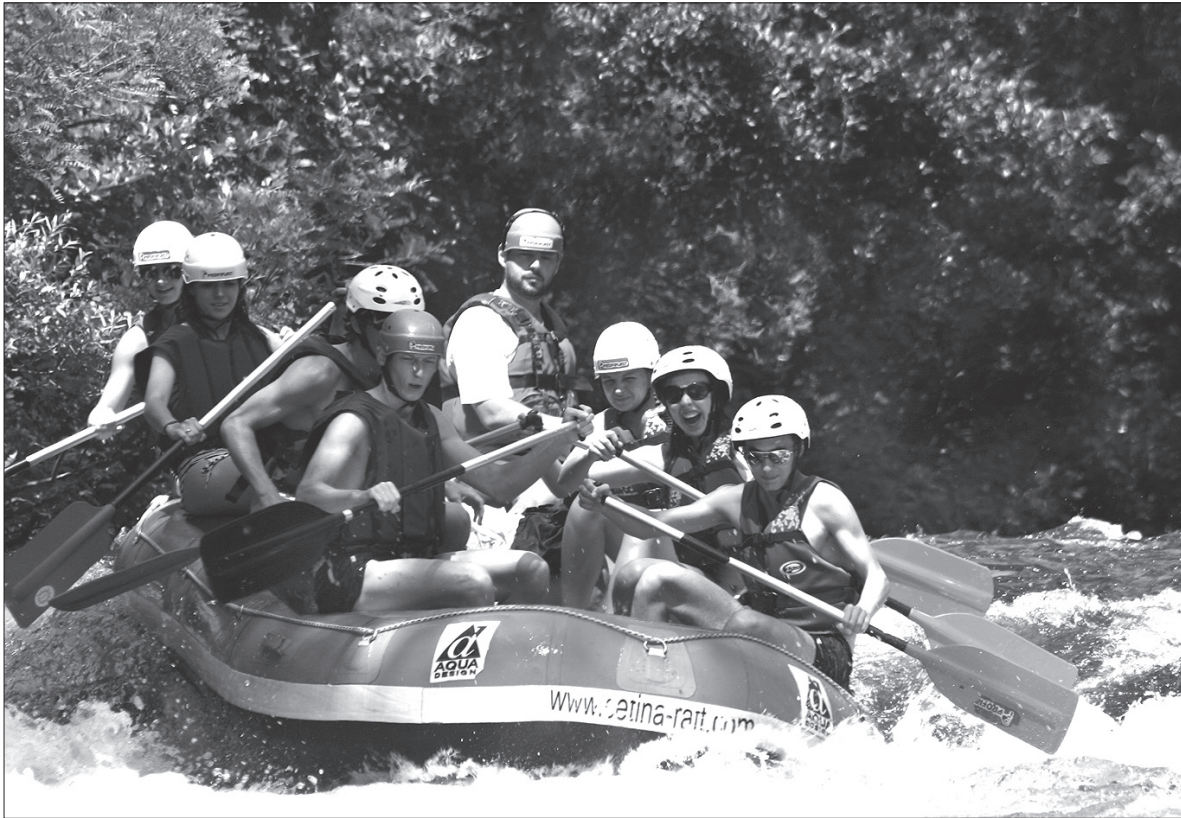
Spływ malowniczą rzeką Cetiną.