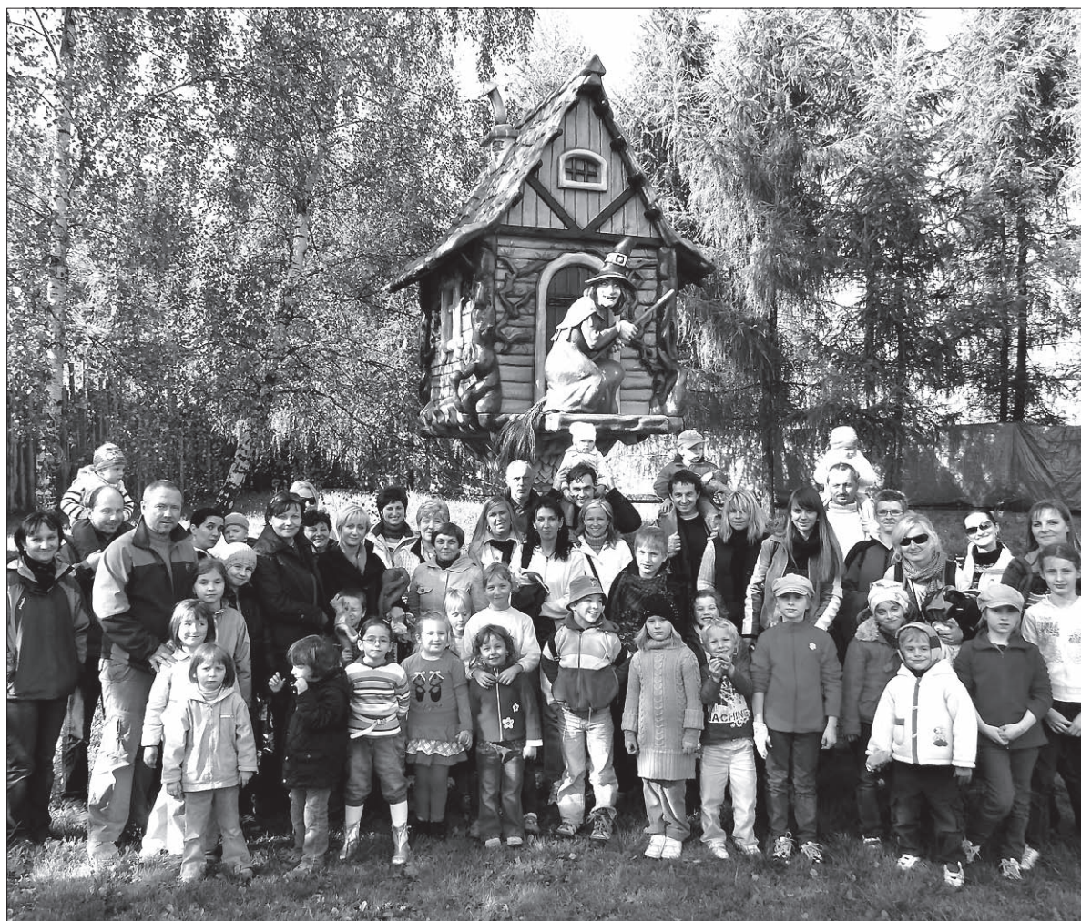
Dzieci i rodzice z Przedszkola Wesołych Przygód na równie wesołej wycieczce.