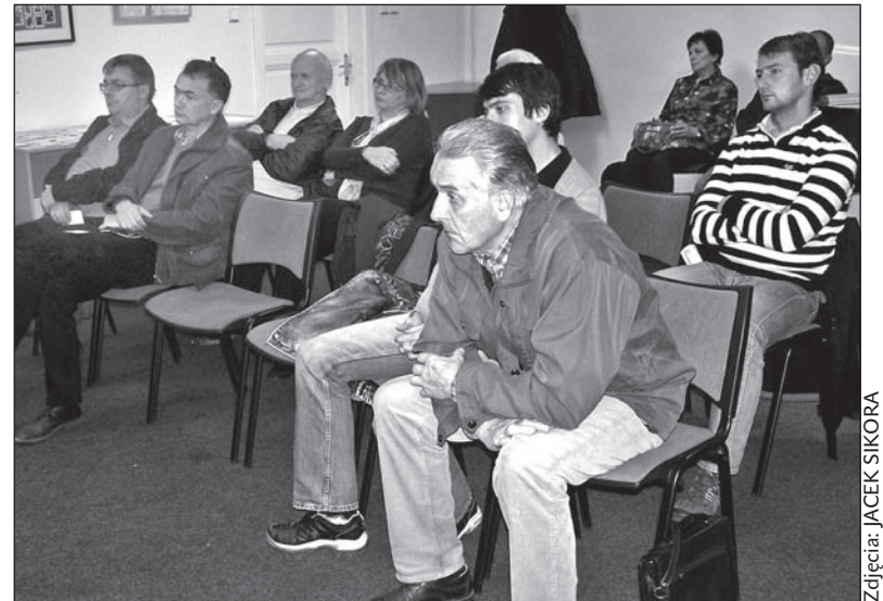
W spotkaniu tradycyjnie wzięli udział przedstawiciele organizacji członkowskich Kongresu Polaków oraz pełnomocnicy gminni.