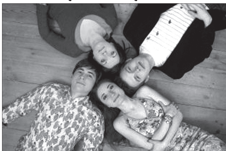
Kwadrofonik zamknie obchody Roku Chopina w Republice Czeskiej.

W najnowszym projekcie Kwadrofonika, „Byłem tu, Fryderyk”,