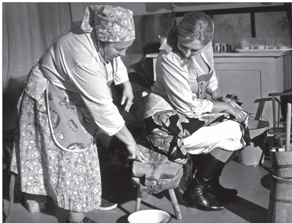
Do wyciskania sera służy specjalna ławka.