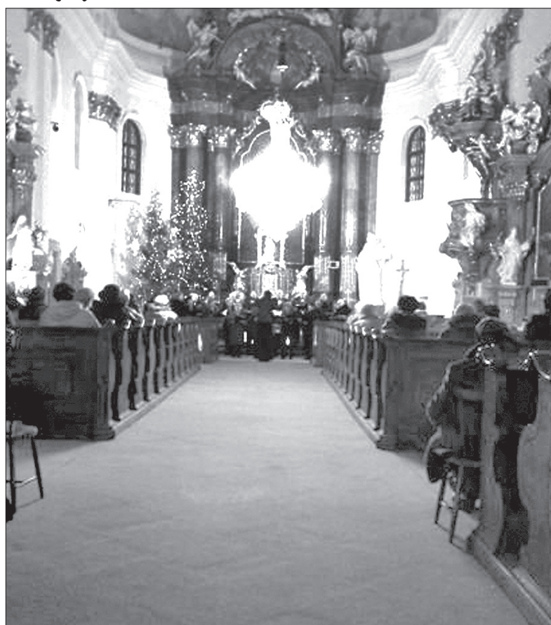
Wnętrze kościoła w Fulneku.

Nasz wybór barokowego kościoła Trójcy Przenajświętszej w Fulneku z XVIII wieku ze wspaniałą akustyką, z bogato zdobionym wnętrzem mistrzowskimi freskami i obrazami, a nade wszystko przyjaznymi słuchaczami, okazał się niezwykle trafny. Czasami wydawało się, że między nami – wykonawcami i słuchaczami – nie istniała bariera językowa. Zaskoczeni byliśmy bardzo ciepłym przyjęciem, wszak z 13 utworów tylko dwa były wykonane po czesku, dwa po