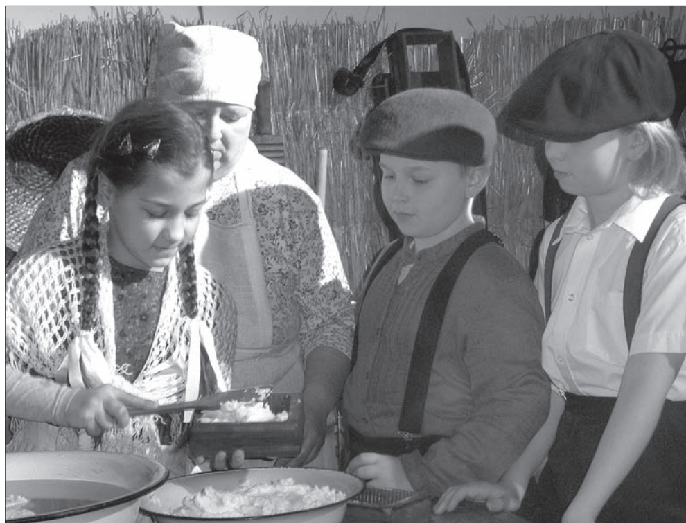
Dzieci próbują napełniać foremki masłem.