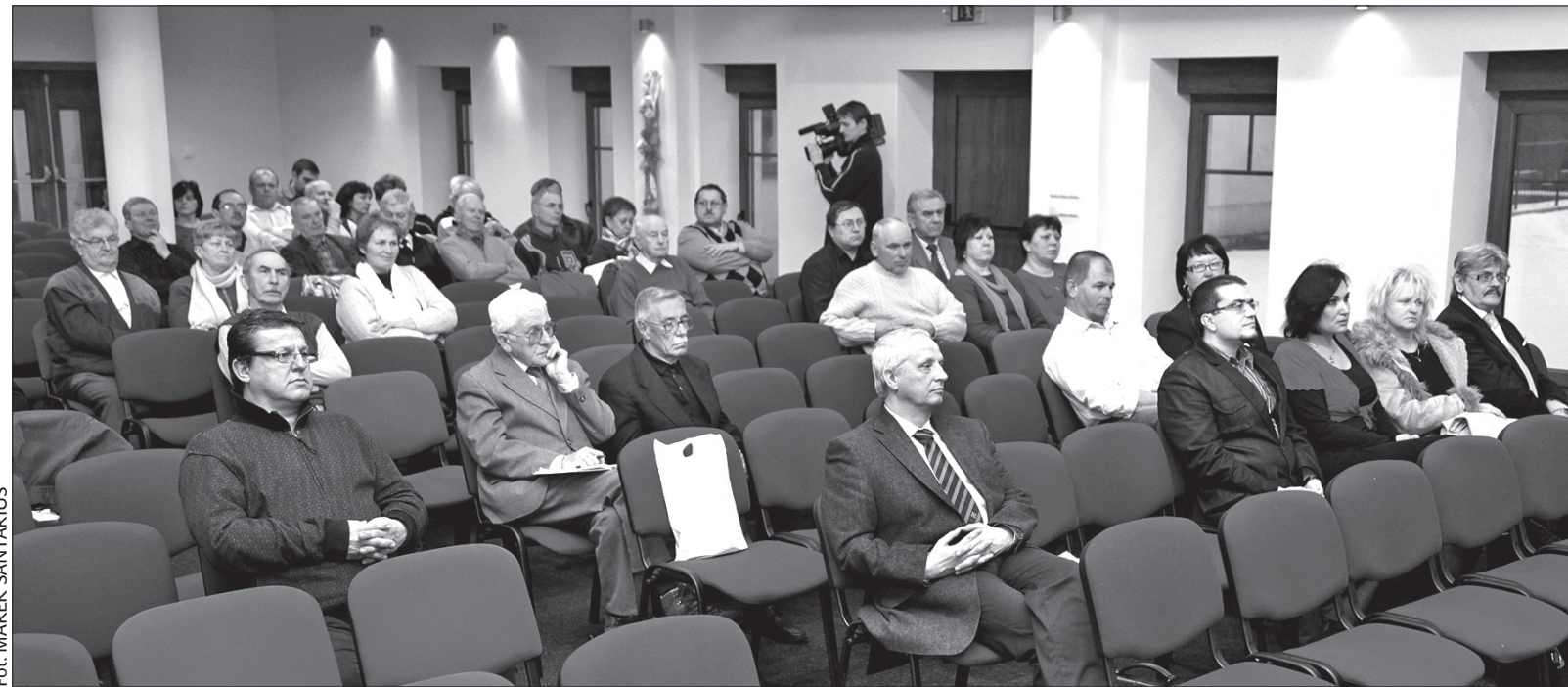
Po zesłotygodniowej konferencji w Trzciniecu pojawiły się nowe pytania i wątpliwości dotyczące Spisu Powszechnego.

REGION: Od kilku dni na stronie internetowej Kongresu Polaków w Republice Czeskiej, www.polonica.cz , dostępna jest elektroniczna wersja logo „Postaw na Polskość”. Może z niej skorzystać każdy, kto chciałby włączyć się w kampanię na rzecz deklarowania polskiej narodowości podczas zbliżającego się Spisu Powszechnego 2011. Na potrzeby kampanii Kongres przygotował też inną „elektroniczną” propozycję.