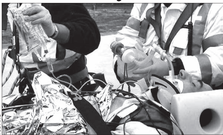
Robert Kubica bezpośrednio po wypadku w Ligurii.