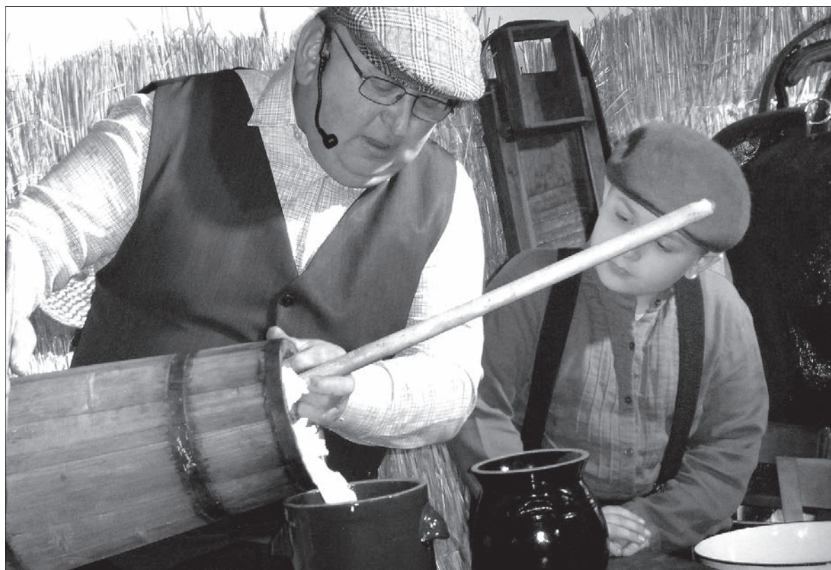
Najpierw trzeba zlać masłankę, a potem wyciągnąć masło z masielnicy.

I już na stole gotowa kolacja. Mlekiem, masłem i serem goszczono również widzów w sali. W przyszłym roku mieszkańcy Ochab przygotują inny pokaz – bo Dzień Tradycji odbył się tu po raz szósty. W poprzednich edycjach było m.in. ochabskie wesele, „szkubaczki” czy świniobicie. Ja bardziej od tłustego mięsa lubię