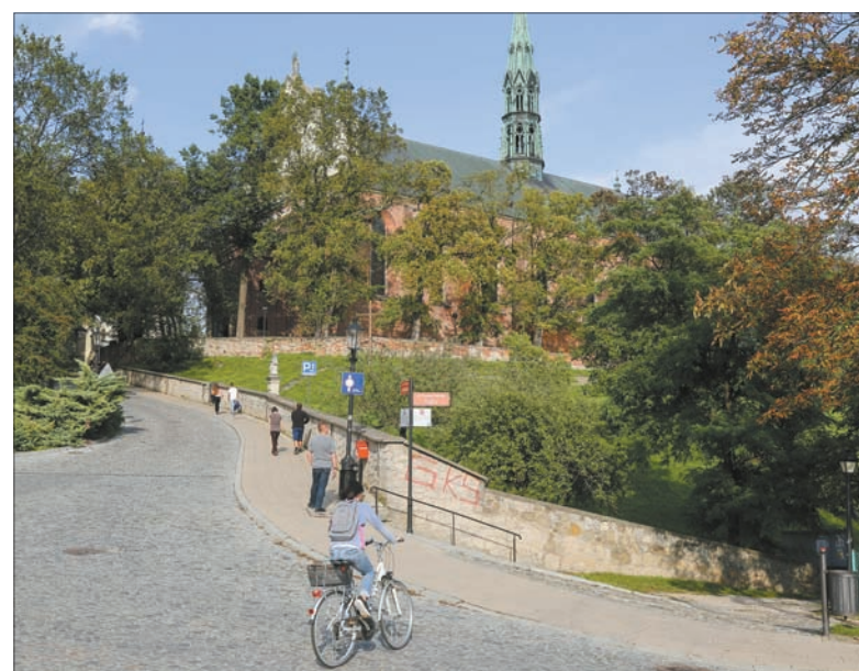
Na rowerze po mieście jeździ nie tylko ojciec Mateusz.

Wisła wiele daje, ale czasami też zabiera. Dobytek, złudzenia, a nawet życie. W maju 2010 roku najdłuższa polska rzeka osiągnęła rekordowy poziom, na całym odcinku został przekroczony stan alarmowy. Tysiącletnia woda, jak do dziś można usłyszeć od miejscowych, przelała się przez wały, prawobrzeżna część miasta została zalana – 830 budynków, 2500 osób straciło dach nad głową, a pięć osób straciło życie. W artykule „Powódź 2010. Powtórzył się dramatyczny scenariusz sprzed dwóch tygodni”, który ukazał się w „Gazecie Współczesnej” 6 czerwca 2010 roku, można było przeczytać między innymi: „Wczoraj późnym wieczorem Wisła przerwała