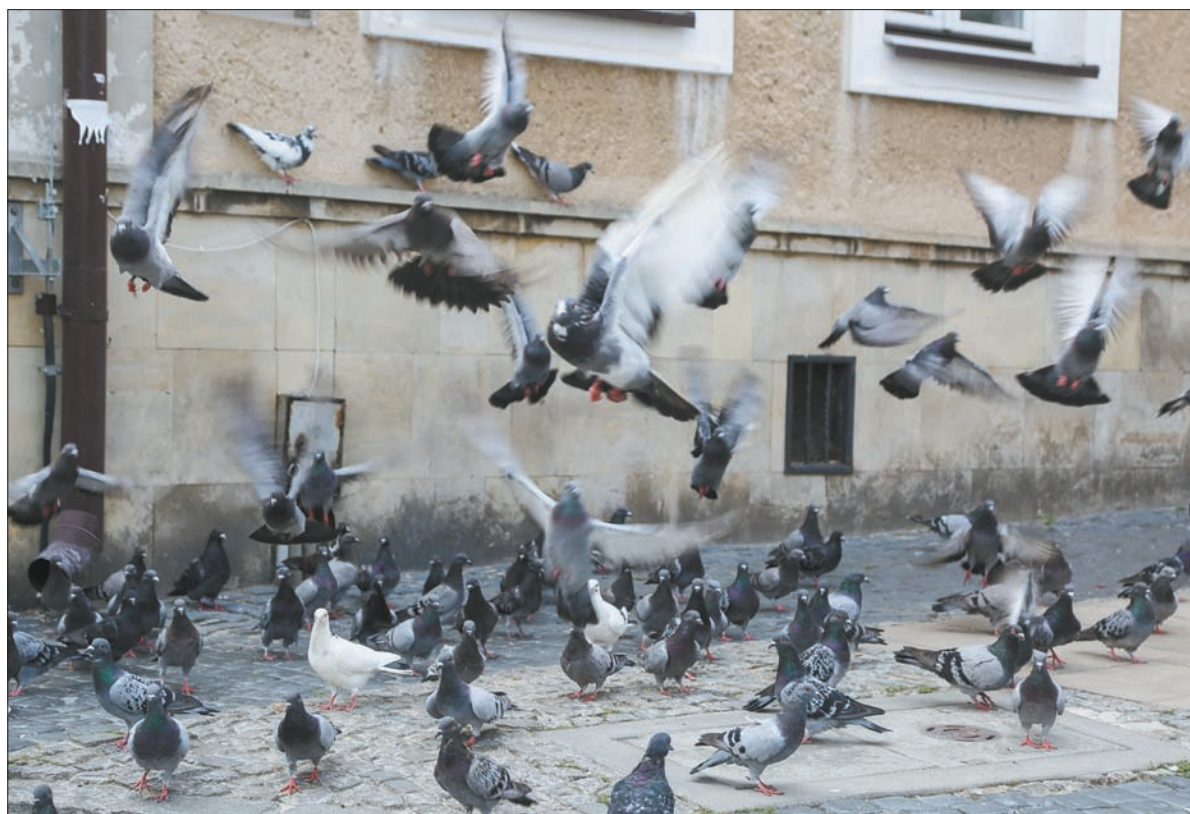
W stare miasto, co nie powinno nikogo dziwić, wpisane są gołębie.

Za dwa tygodnie wrócimy jeszcze do Sandomierza, by napisać o produkowanych tam winach.