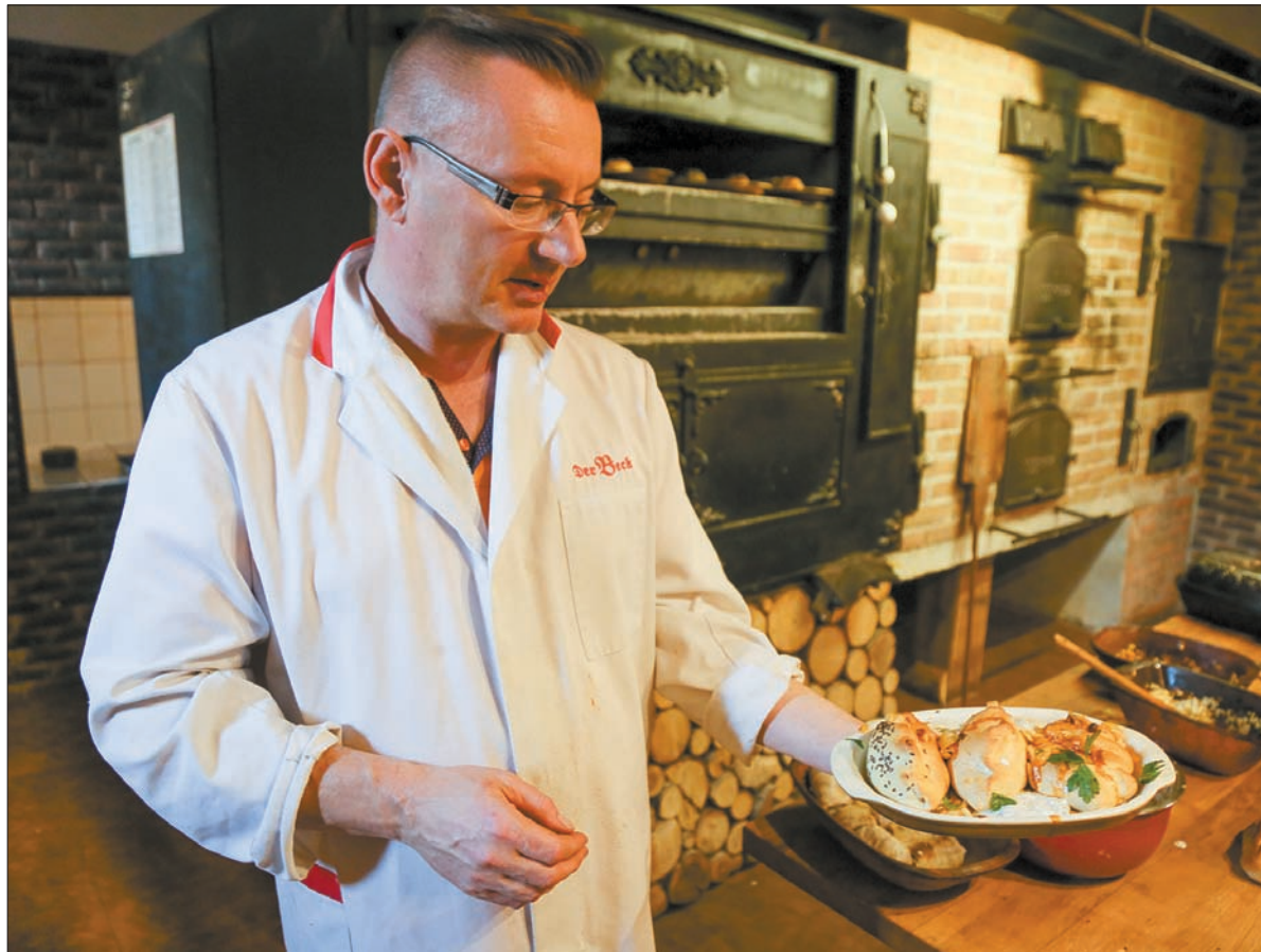
Smak tradycji. „W Starej Piekarni” można skosztować m.in. wybornych lasowiackich zlepieńców.