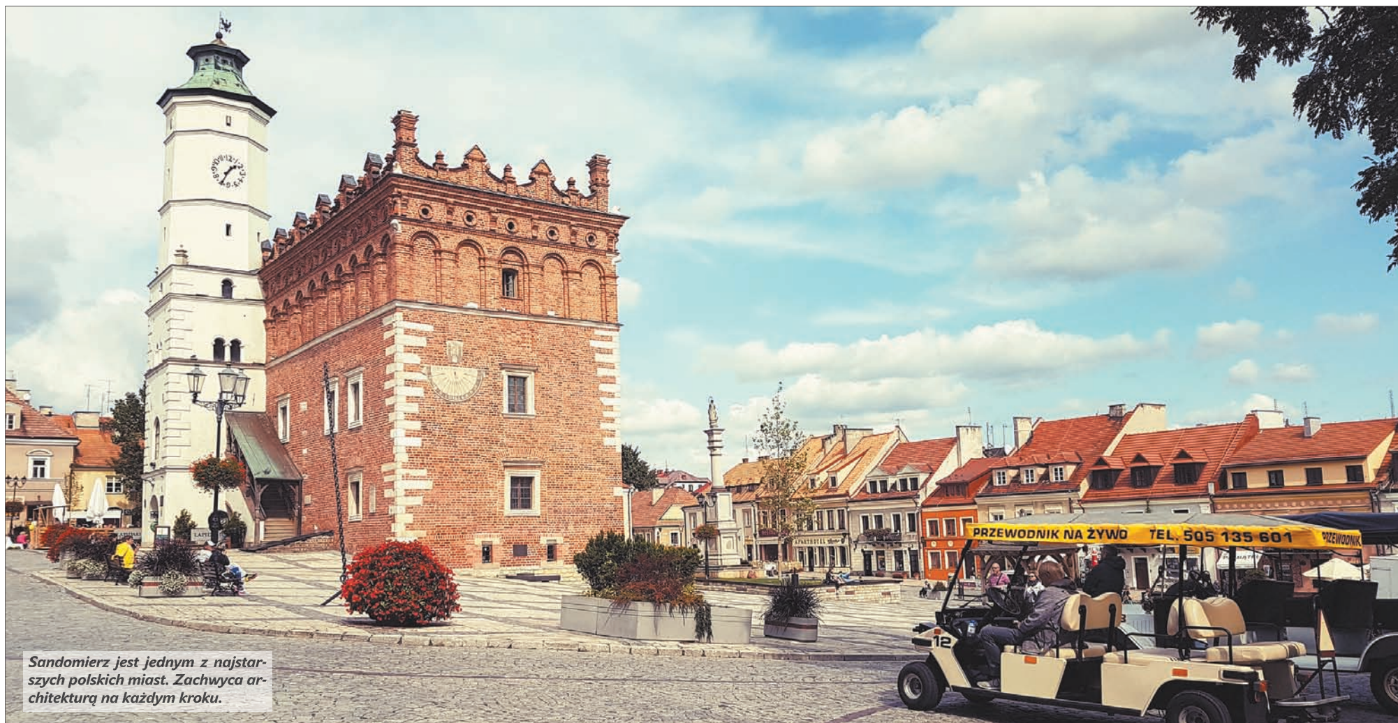
Sandomierz jest jednym z najstarszych polskich miast. Zachwyca architekturą na każdym kroku.