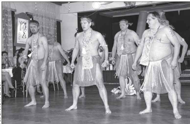
Babski Bal w Błędowicach to impreza jedyna w swoim rodzaju. Jednym z głównych punktów programu jest „Taniec chłopów”.

Bilety: Do nabycia na stronie www.balslaski.cz.