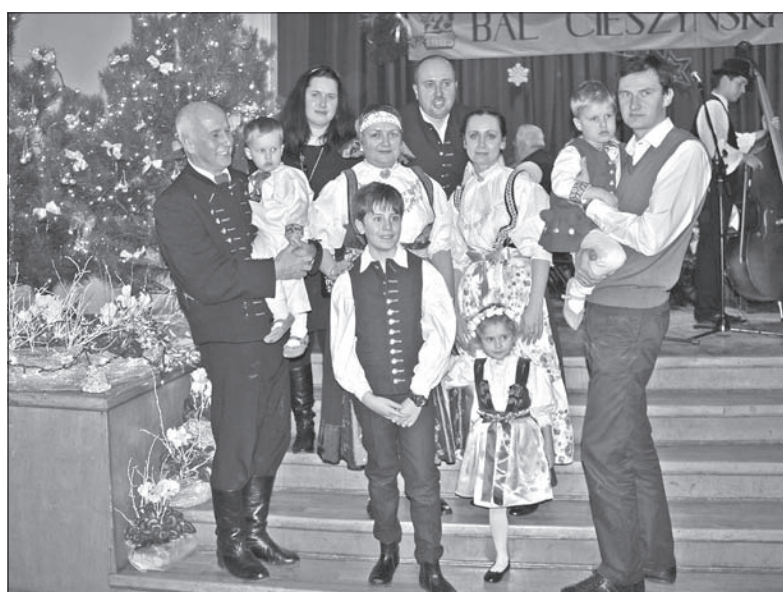
Na Bal Cieszyński większość gości przychodzi w strojach ludowych.