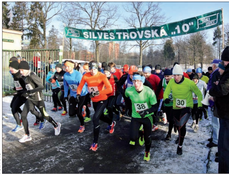
Start głównej kategorii.