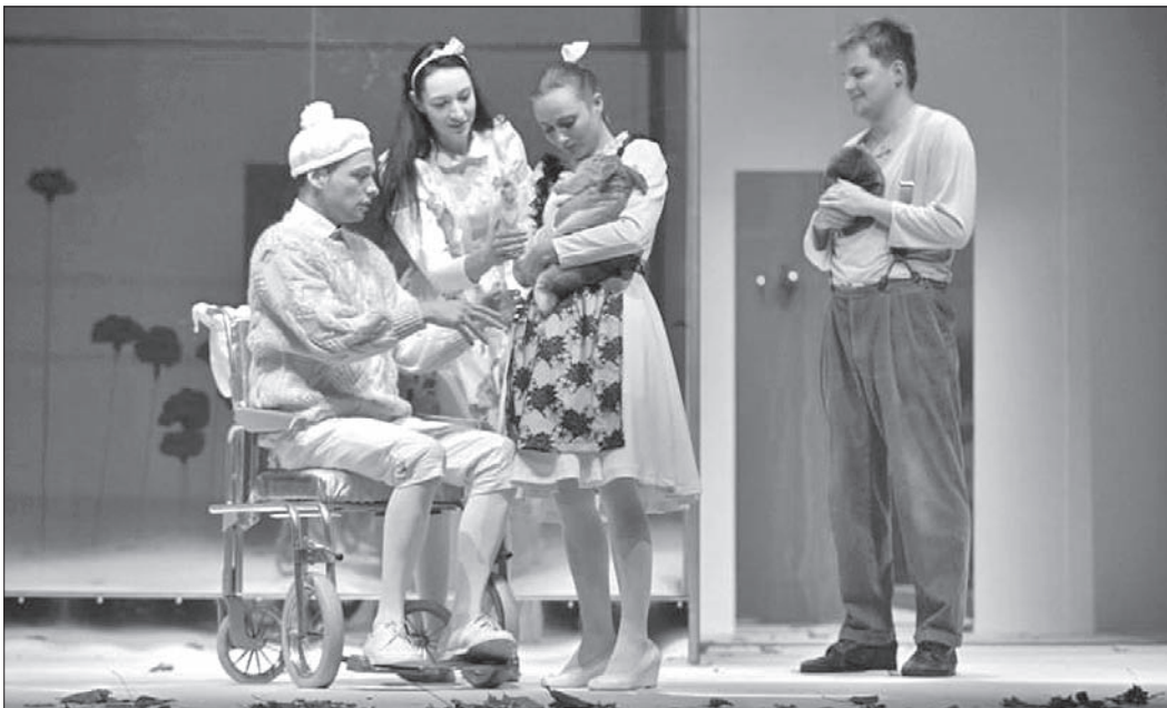
Niedzielnny spektakl zadowoli widzów w każdym wieku.