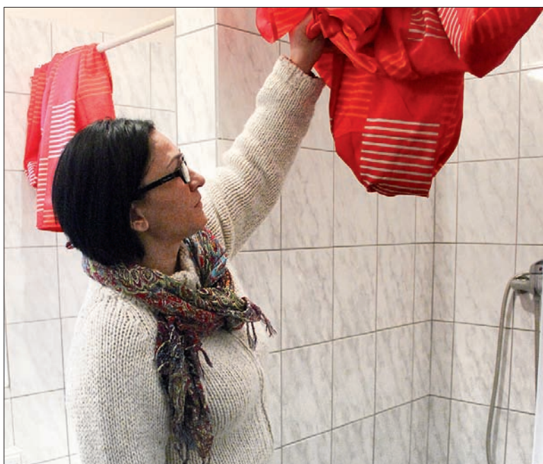
Łazienka w ośrodku dziennym dla bezdomnych w Boguminie służy tym, którzy nie mają się gdzie umyć.