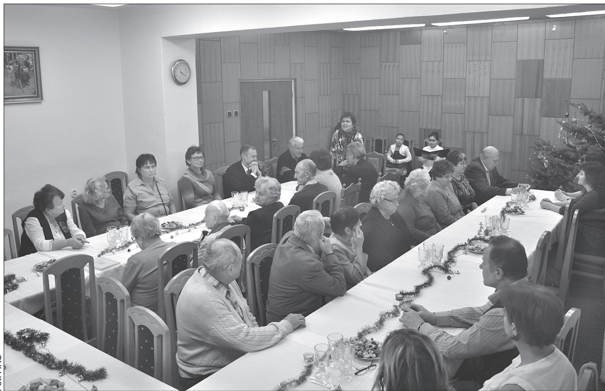
Wigilia upłynęła w rodzinnej atmosferze.

Z referatu sprawozdawczego wyni- ka, że koło liczy 75 członków, a ak- tywnie działają chór mieszany oraz zespół kobiet. Do udanych imprez w roku ubiegłym należały Bal Retro, wycieczka do Chlebowic, Sztram- berka i Bolacic, świetlica wiosenna z pre- lekcją i zabawami dla dzieci. Dolno- lutyńskie MK PZKO współpracuje z sąsiednimi Kołami w Rychwałdzie, Wierzniowicach i Orłowej-Porębie, członkowie biorą udział w imprezach zaprzyjaźnionych kół. Chórzyści za- liczili 16 występów, m.in. w koście- le w Lutyni Dolnej, Rychwałdzie,