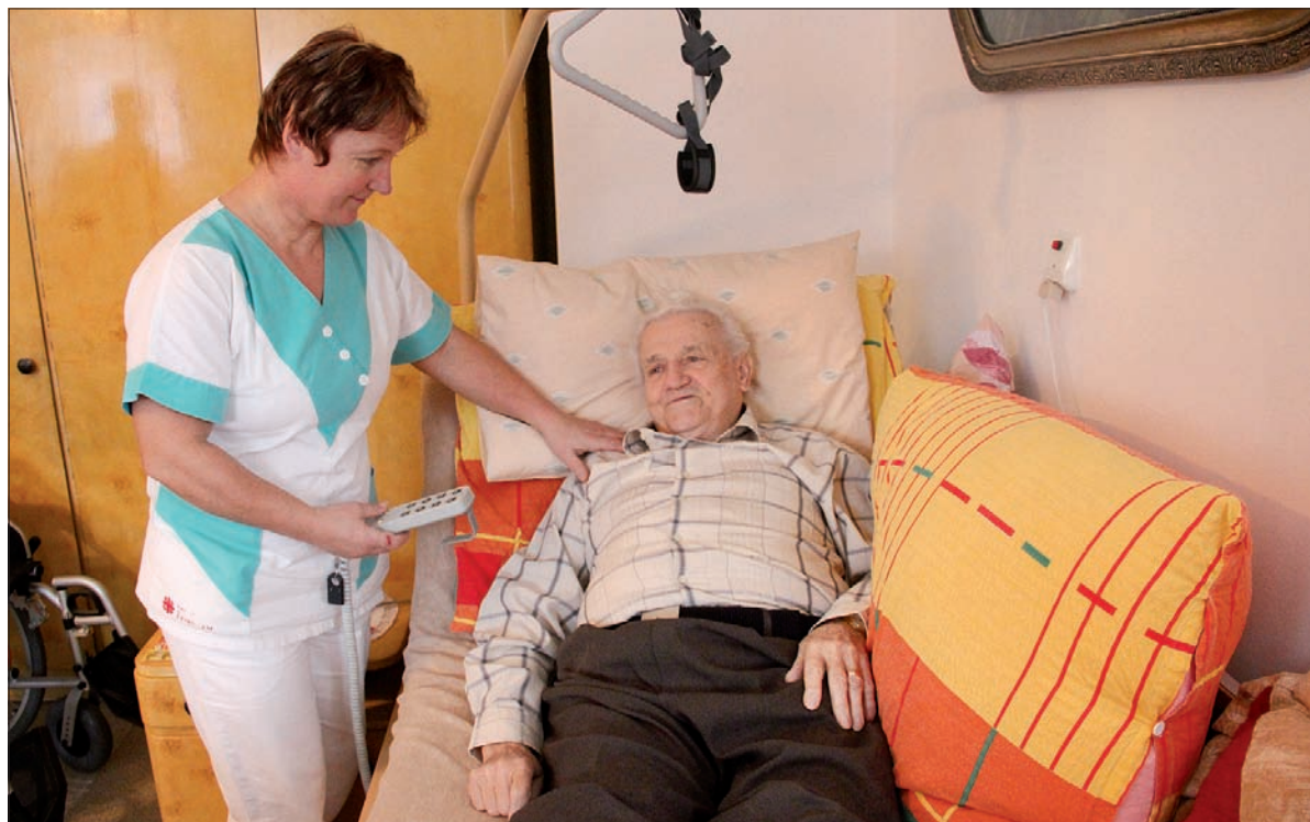
Elektronicznie sterowane łóżka to duża pomoc dla personelu i pensjonariuszy Domu Seniora w Gnojniku.