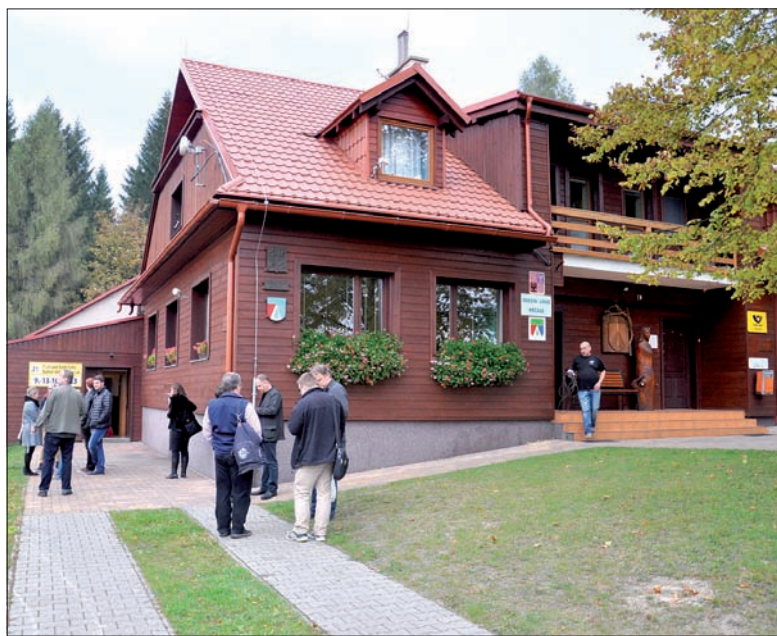
Większość tegorocznych festiwalowych projekcji odbywa się w kinie w Herczawie.