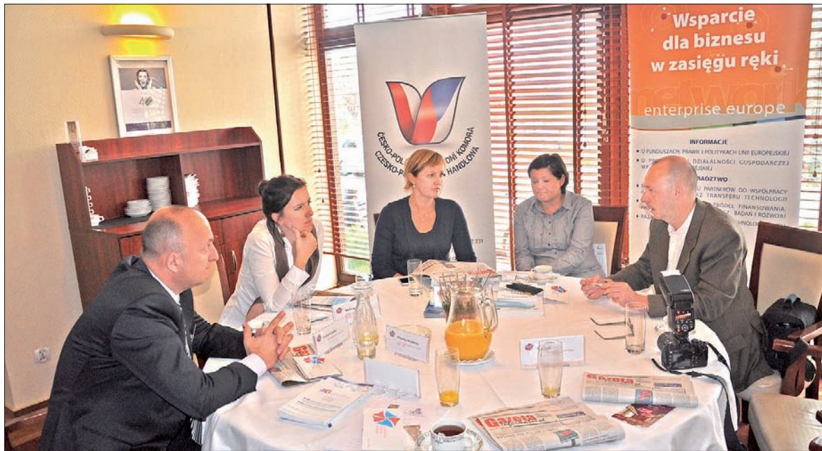
W cieszyńskim hotelu Mercure zastanawiano się, jak pomagać przedsiębiorcom chcącym rozpocząć działalność po drugiej stronie granicznej Olzy.