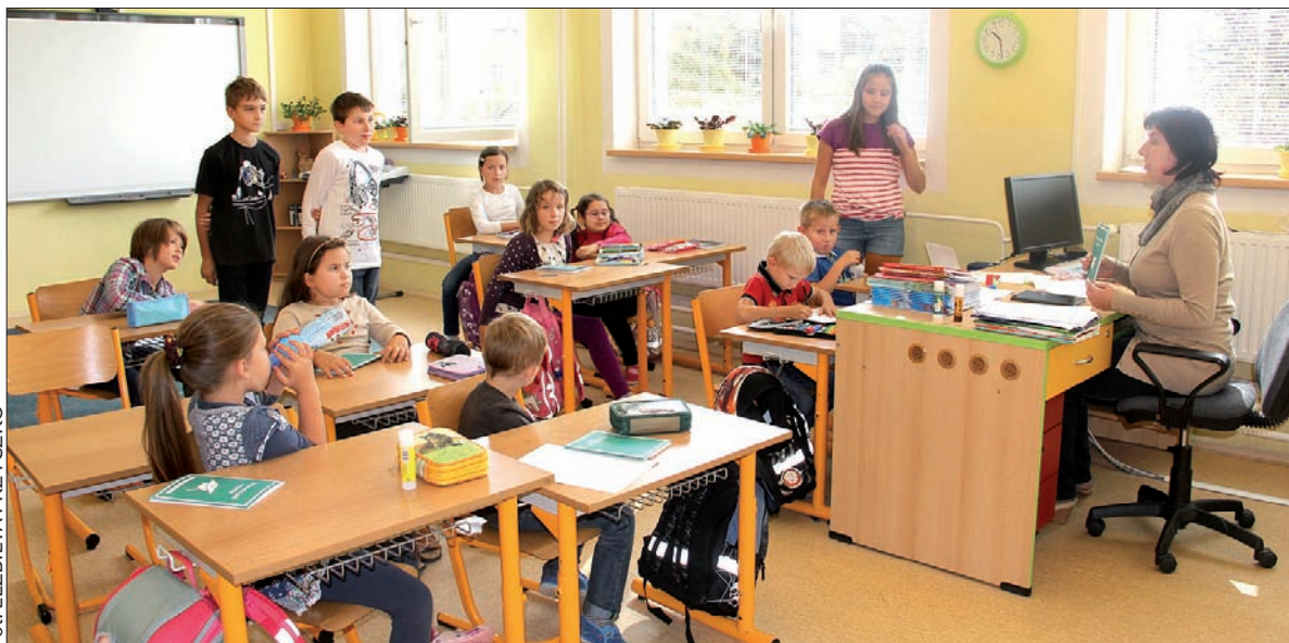
W Orłowej-Lutyni w tym roku szkolnym uczy się 13 dzieci.

W tej chwili polskie szkoły podstawowe mogą z optymizmem patrzeć w przyszłość. Z jednej strony w polskich przedszkolach nie brakuje starszaków, które zasilą przyszłoroczne pierwsze klasy, z drugiej zaś liczba tegorocznych dziewiątaków jest wyjątkowo niska – najniższa w historii powojennego polskiego szkolnictwa podstawowego. 152 uczniów, którzy opuszczą w czerwcu mury podstawówek, można jednak rozumieć jako swoisty sygnał ostrzegawczy dla polskich klas szkół średnich. Czy znajdzie się wśród nich dosyć chętnych, a równocześnie zdolnych zdać egzaminy, by zapełnić trzy trzydziestoosobowe klasy Gimnazjum Polskiego i chociaż połowiczną klasę „handłówek”? (sch)