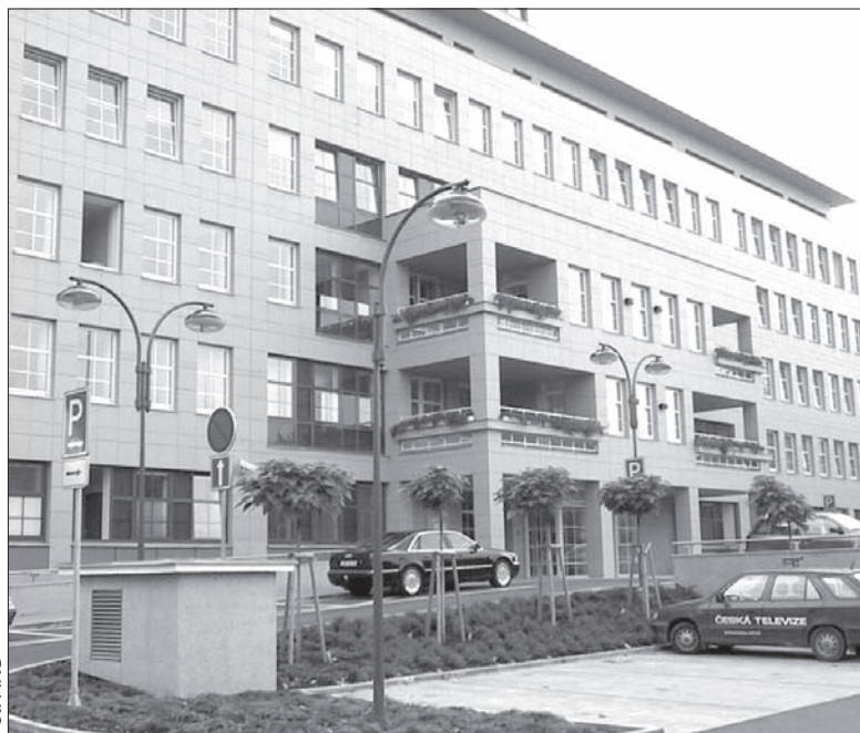
Siedziba Urzędu Wojewódzkiego w Ostrawie.

Wkrótce zapadną decyzje, na co konkretnie przeznaczone będzie te