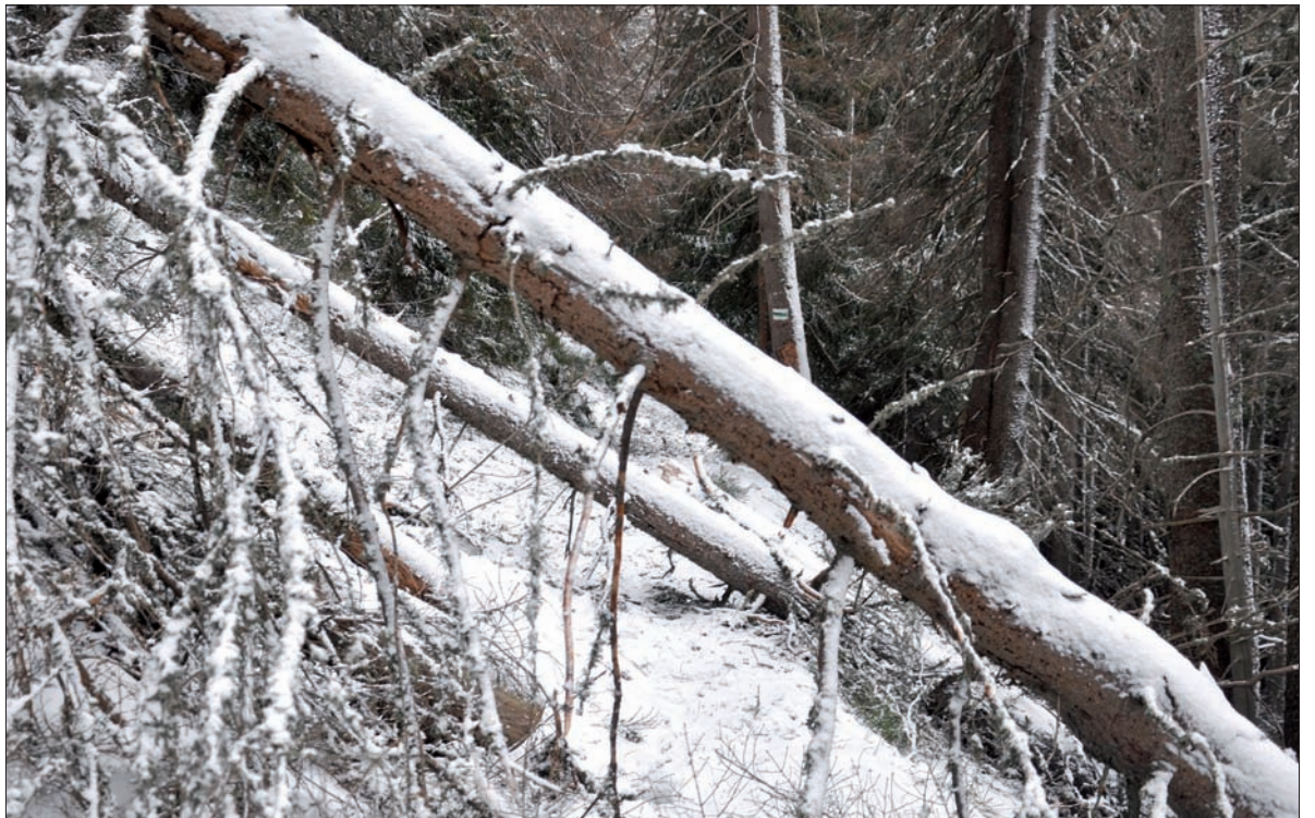
Takie obrazy można spotkać na każdym kroku.

znaleźć na parkowej stronie: www.tpn.com.pl .