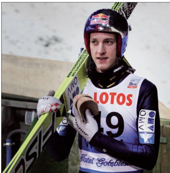
Poniżej oczekiwani spisał się Austriak Gregor Schlierenzauer.