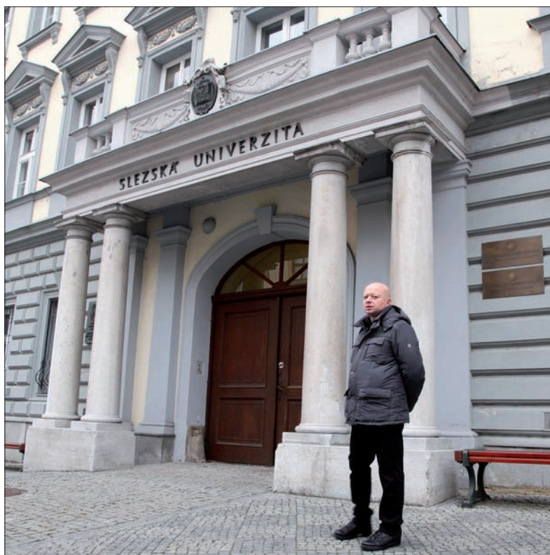
Dziś siedziba Uniwersytetu Śląskiego. Dawniej mieściły się tu Sąd Powiatowy i internat Średniej Szkoły Medycznej.

Udajemy się na Rynek Górny, krocząc zabytkowymi ulicami, m.in. Ostrożną (Ostrožná, a więc od znanego także w polskim nazewnictwie