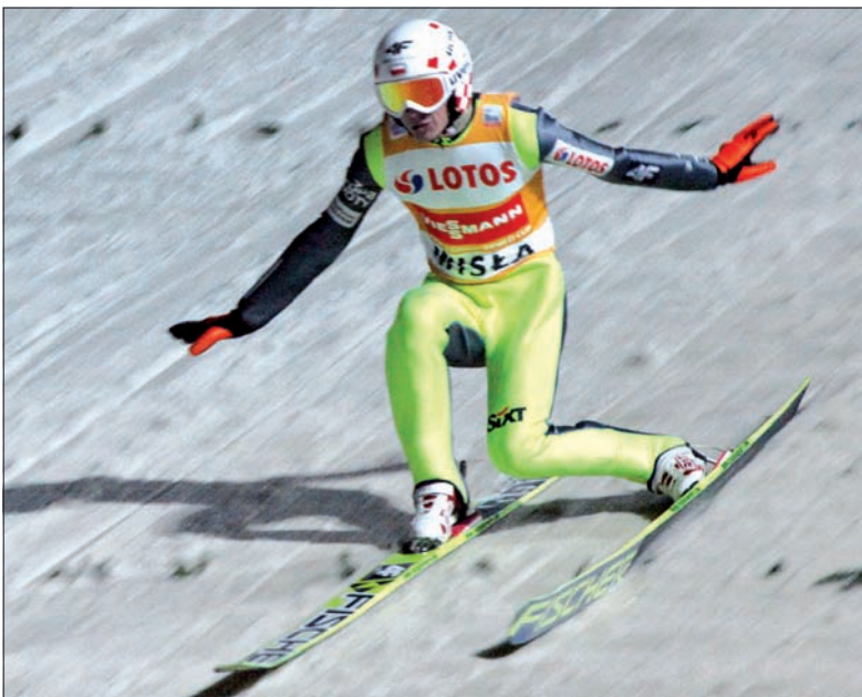
Kamil Stoch nie zawiódł. Zajął w Wiśle drugie miejsce.