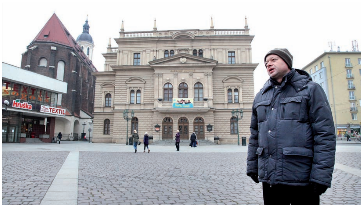
Budynek Teatru Śląskiego powstał w pierwszej połowie XIX wieku. Kościół pw. Wniebowzięcia Najświętszej Marii Panny dużo, dużo wcześniej.

Mówi, że życie kulturalne w Opawie jest bardzo bogate. Skupia się ono głównie wokół Domu Narodowego („Obecní dům”), którego duszą