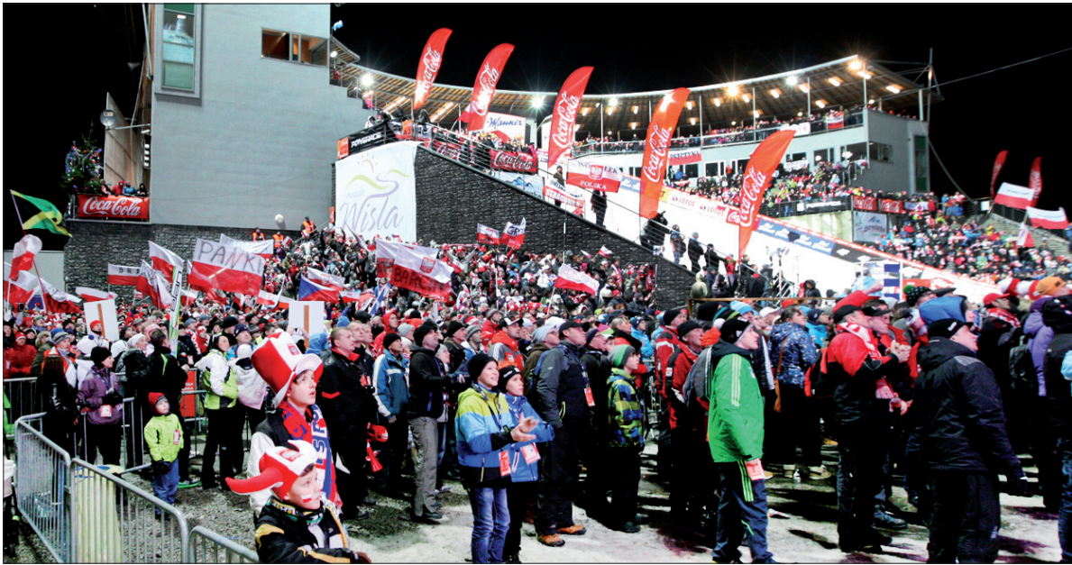
Rywalizacji przyglądało się ponad 8 tysięcy widzów.