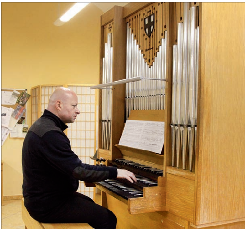
W Konserwatorium Kościelnym przyszli organiści mają na czym ćwiczyć.

Tekst: JACEK SIKORA