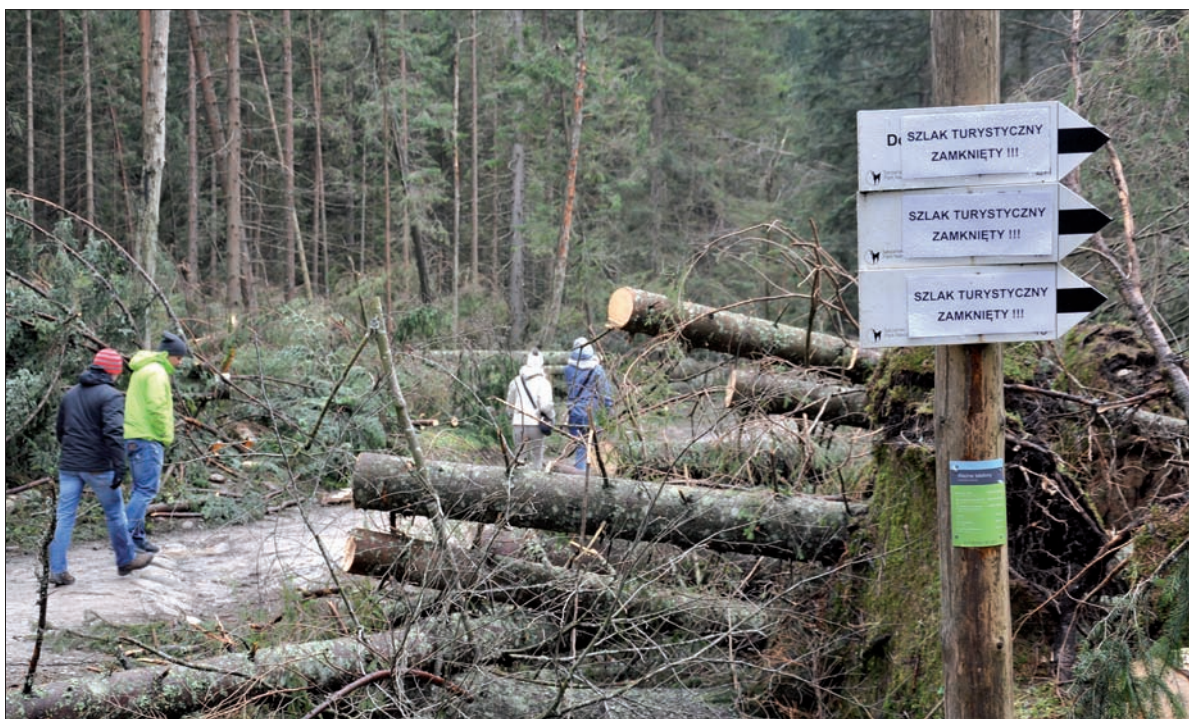
Turyści nierzadko muszą wędrować między zwalonymi drzewami. Część szlaków jest zamknięta.

Kiedy nasz spacer po Dolinie Kościeliskiej dobiega końca, dyrektor Tatrzańskiego Parku Narodowego, wyraża jeszcze nadzieję: – Tutaj bałagan będzie trwał jeszcze wiele lat. Trzeba by nauczyć ludzi, że bałagan w przyrodzie tak naprawdę nie jest bałaganem. Organizacja przyrody polega na pewnym chaosie, ale ukierunkowanym. Powalone drzewa w dolinie będą tak długo widoczne, dopóki nie pojawią się jarzębina czy świerk, które zakryją to i zmiękną krajobraz, który dziś jawi się jako nieco surowy. TOMASZ WOLFF