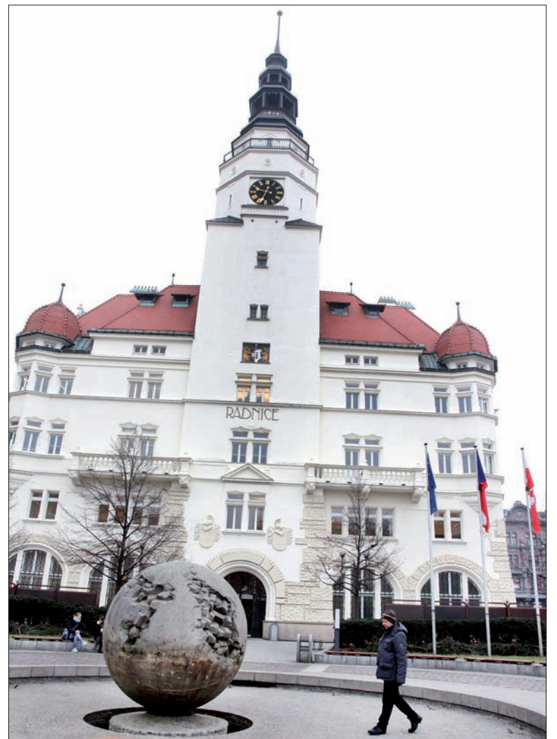
Ratusz został wybudowany w stylu neorenesansowym na początku XX wieku. Wieża pochodzi z 1618 roku, za to fontanna jest jak najbardziej współczesna.

Opowiada, że nie jest rodowitym opawianinem. Urodził się przed 49 laty w Karniowie (Krnov), kolejnym historycznym grodzie tej części Śląska. Na Uniwersytecie Śląskim