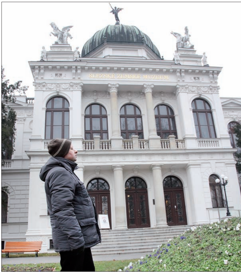
Gmach Muzeum Ziemi Śląskiej to istne architektoniczne cacko.