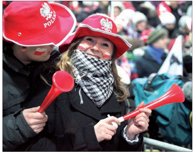
Który ze skoczków, kochanie, jest najprzystojniejszy?