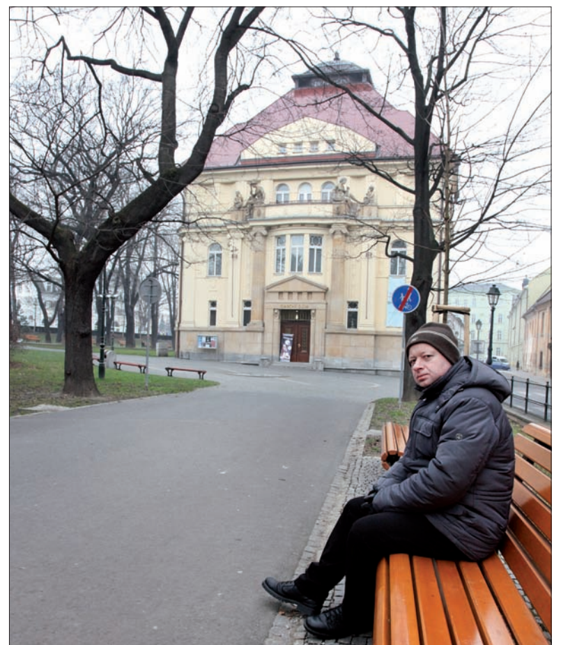
Życie kulturalne Opawy kręci się wokół Domu Narodowego. A park przed nim jest też piękny.