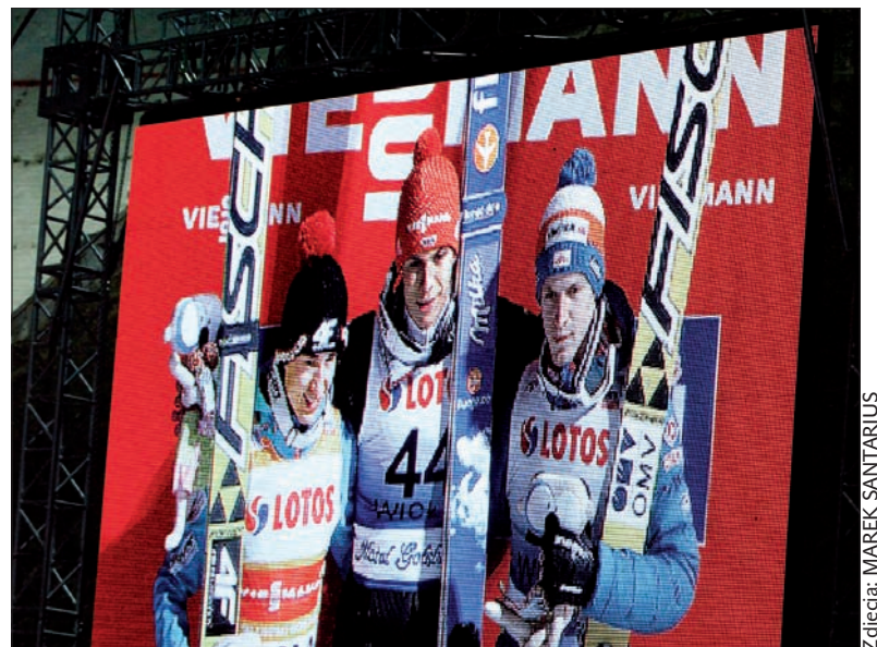
Najlepsi na telebimie. Coś dla kibiców w gorszych sektorach.