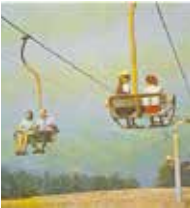
• Kolejka na Czantorię wozit turystów od 51 lat.

Za cztery lata na stokach Czantorii Wielkiej w Beskidzie Śląskim powstanie ścieżka w koronach drzew. Nowa atrakcja ma odmienić turystyczne oblicze jednej z najpopularniejszych beskidzkich gór.