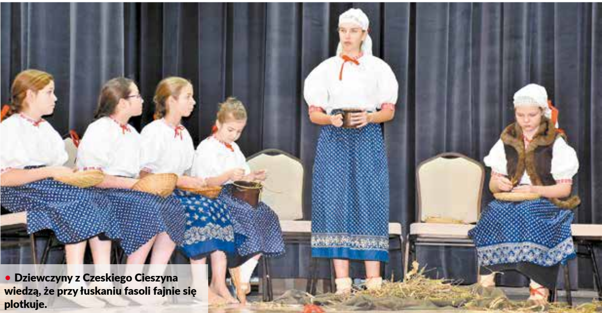
• Dziewczyny z Czeskiego Cieszyna wiedzą, że przy łuskaniu fasoli fajnie się plotkuje.

Uczestnicy Konkursu Gwar popisywali się gwarowymi opowieściami i wierszami. Jedni sięgali po utwory znanych śląskich twórców, inni posłużyli się wspomnieniami i historyjkami opowiedzianymi przez rodziców lub dziadków.