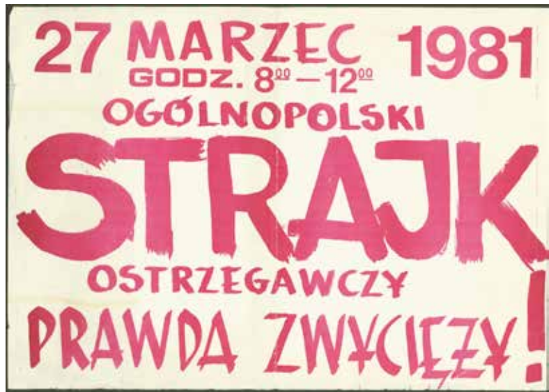
• Plakat wzywający do ogólnopolskiego strajku ostrzegawczego zaplanowanego przez NSZZ „Solidarność” na 27 marca 1981 roku.

Za lub przeciw. Trzeciego wyjścia nie ma. Polska Ludowa wprawdzie od początku narzucała nam proste alternatywy (z nią lub przeciw niej), jednak dopiero dzisiaj do wyboru zmuszono wszystkich. Wojskowy pucz nie pozostawił komfortu niezdecydowania. Nikt nie zachowa swojego azylu. Każdy musi podjąć los: prześladowcy, ofiary lub – przeciwnika. (...) Zadajemy sobie pytanie, czy wal-