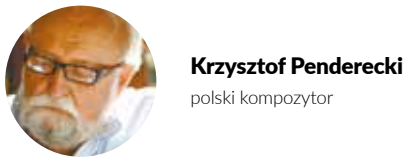
Krzysztof Penderecki polski kompozytor

Ja się lokciami nie rozpychałem nigdy, sama moja muzyka się rozpychała