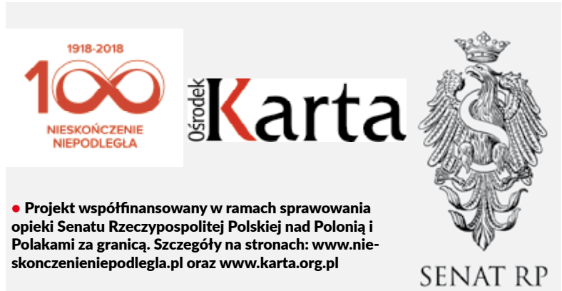
• Projekt współfinansowany w ramach sprawowania opieki Senatu Rzeczypospolitej Polskiej nad Polsnią i Polakami za granicą. Szczegóły na stronach: www.niekonkencienieniepodlegla.pl oraz www.karta.org.pl

Gdańsk, lato 1985 „Raport. Polska 5 lat po Sierpniu”, Warszawa 1985