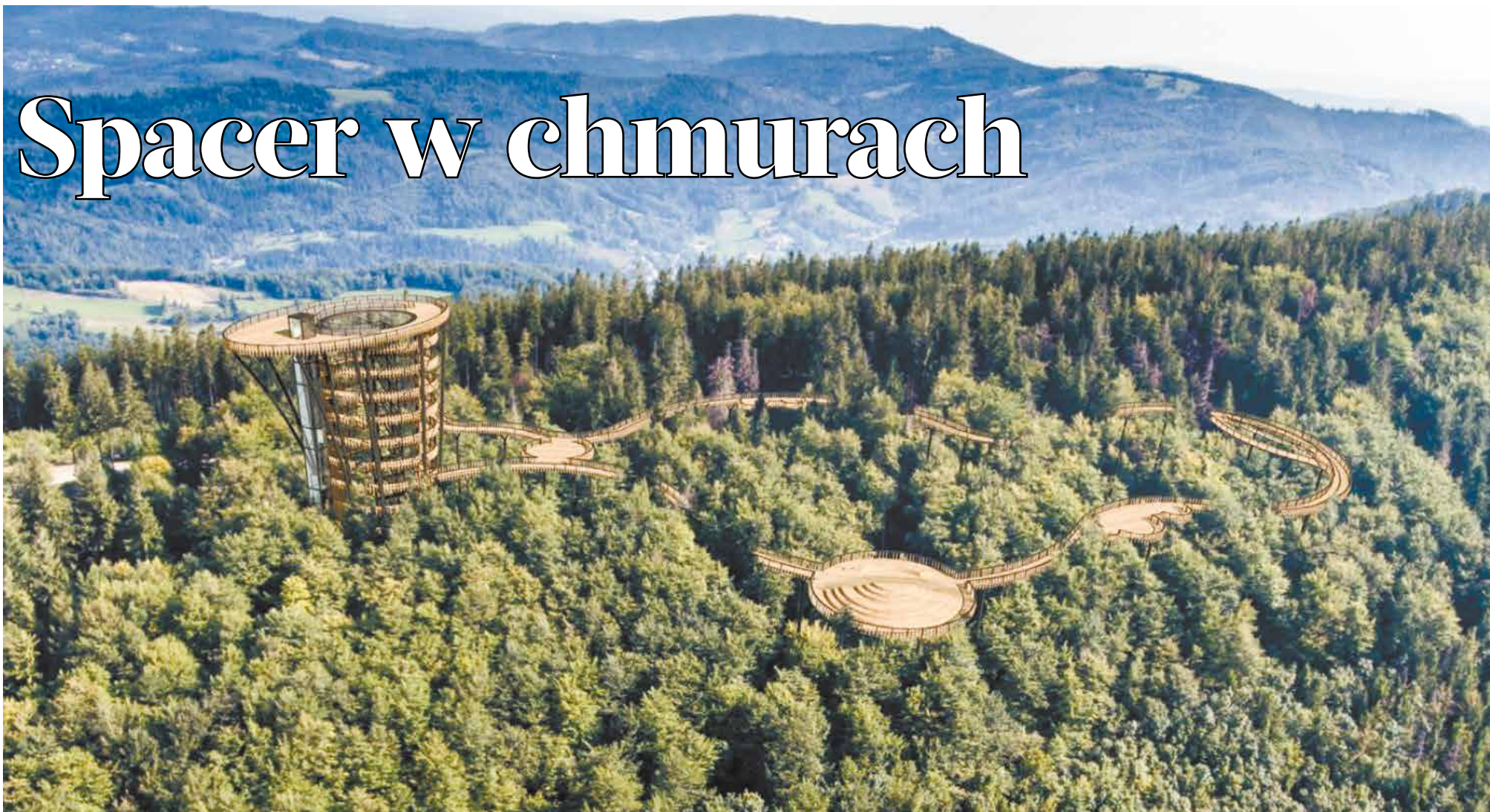
• Tak ma w przyszłości wyglądać ustronńska ścieżka w chmurach.

Za cztery lata na stokach Czantorii Wielkiej w Beskidzie Śląskim powstanie ścieżka w koronach drzew. Nowa atrakcja ma odmienić turystyczne oblicze jednej z najpopularniejszych beskidzkich gór.