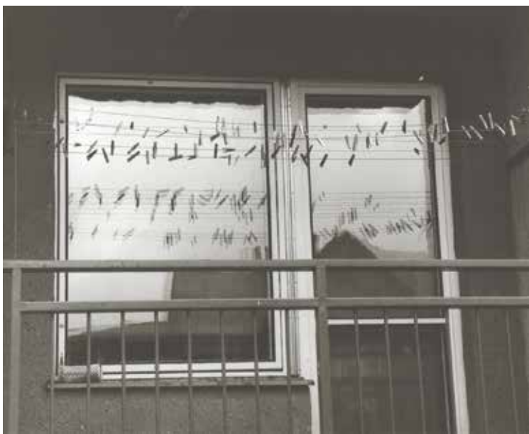
● Pogoda w ostatnich dniach nas nie rozpieszczała. Czas suszyć pranie w domowym zaciszu. Klamerki poczekają na lepsze czasy. Zdjęcie „wygrzebalismy” z naszego przepastnego archiwum

Niestety handlowcy wiedzą o każdej z naszych słabości. I nie wahają się stosować najrozmaitszych sztuczek. Efekt jest taki, że w dniach takich jak Black Friday kupujemy mnóstwo w gruncie rzeczy zupełnie nam niepotrzebnych rzeczy. Robimy to zaś – jakby to dawniej powiedziano – pod wpływem afektu. Ponieważ zaś na psychologiczne triki stosowane przez handlowców nie ma mocnych, a w starciu z wielkimi centrami handlowymi nie mamy żadnych szans, prywatnie w Czarny Piątek staram się omijać galerie handlowe wielkim łukiem. Jest przecież tyle innych dni w roku, kiedy można się wybrać na zakupy. ▲