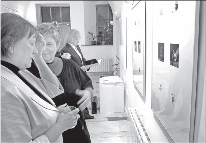
Fragment frysztańskiej wystawy.

bibliotece co najmniej do 15 lutego. Polski artysta – laureat wielu konkursów – jest w ostatnim okresie bardzo aktywny, bo poza karwińską wystawą przygotował jeszcze kilka innych. Dla przykładu dziś w Galerii „Rotunda” Miejskiej Biblioteki Publicznej w Bytomiu otwarta zostanie jego wystawa małych form graficznych nazwana „Ex libris pro vobis”. (o)