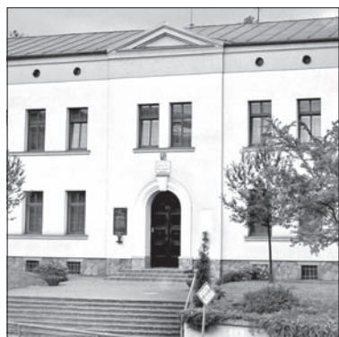
Polska podstawówka w Trzycieży,