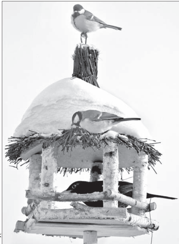
Na daszku karmnika dwie sikorki, a w środku... kos.

– Głosiku, co ty wyprawiasz?! – wykrzyknęła. Naprawdę nic się nie stało, że nie udało ci się zbudować altanki – dodała. Głosik spojrzał na nią z zaskoczeniem: – Jakiej znowu altanki? Zbudowałem karmnik! – pochwalił się. Faktycznie, na gałęzi drzewa umieszczona była drewniana budka dla ptaków, w której można było zostawić ptaszkom jedzenie. – Że też sama na to nie wpadłam! Będziemy pomagać ptakom przetrwać zimę! – wykrzyknęła z entuzjazmem. – Właśnie. Kiedy spałaś, zrobiłem im już kanapki. Są pyszne, aż ślinka cieknie – powiedział Głosik. W rękach trzymał chleb z szynką i żółtym serem posmarowanym keczupem. Ludmiłka szybko jednak odstąpiła jego zapach: – Zrobięś wprawdzie świetny karmnik, ale widać, że jeśli chodzi o dokarmianie ptaków, to jesteś