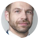
Robert Pelikán, czeski minister sprawiedliwości w dymisji

To mój definitywny koniec w polityce. Moje poglądy w znacznym stopniu odbiegają od partyjnej linii ANO. Chcę wrócić do zawodu adwokata