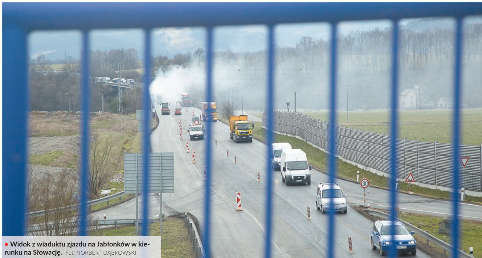
• Widok z wiaduktu zjazdu na Jabłonków w kierunku na Słowację.

WYDARZENIE: Ledwo kierowcy zdążyli się nacieszyć oddaną jesienią ub. roku do użytku obwodnicą Trzyńca, a już muszą przyzwyczaić się do nowych ograniczeń i korków na drodze I/11 w okolicach Jabłonkowa. Mają one potrwać do końca maja, lecz Dyrekcja Dróg i Autostrad zapowiada, że prawdopodobnie skończą się wcześniej.