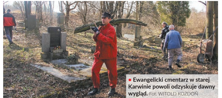
• Ewangelicki cmentarz w starej Karwinie powoli odzyskuje dawny wygląd.

Karwiński cmentarz sięgający swą historią 1903 roku z powodu szkód górniczych zamknięto w latach 70. XX wieku. Od tego momentu nieczynna nekropolia popadała w ruinę. Kiedy w zeszłym roku pojawiła się tam grupa zapaleńców, teren był niemal zupełnie dziki i zarosnięty.